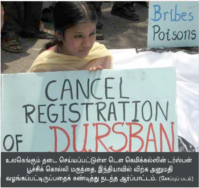
உலகெங்கும் தடை செய்யப்பட்டுள்ள டௌ கெமிக்கல்ஸின் டர்ஸ்பன் பூச்சிக் கொல்லி மருந்தை, இந்தியாவில் விற்க அனுமதி வழங்கப்பட்டிருப்பதைக் கண்டித்து நடந்த ஆர்ப்பாட்டம். (கோப்பு படம்)

1979-இல் அமெரிக்காவில் தடை செய்யப்பட்ட, டி.பி.சி.பி என்ற அபாயகரமான பூச்சி கொல்லி மருந்தை, நெமகான், ப்யூமாசோன் என்ற பெயர்களில் மத்திய அமெரிக்க நாடுகளின் விவசாயிகளுக்கு டௌ விற்பது. வாழைத்தோப்புக்கு இந்தப் பூச்சிமருந்தை தெளித்ததால் கோஸ்டா ரிகா நாட்டின் 25% ஆண்டுகளுக்கு ஆண்மையிழப்பு ஏற்பட்டது. நிகராகுவாவில் 22,000 பேர் பாதிக்கப்பட்டனர். இவர்களுக்கு டௌ உள்ளிட்ட 3 நிறுவனங்கள் சுமார் 49 கோடி டாலர் இழப்பீடாகத் தரவேண்டும் என்று 2002-இல் தீர்ப்பளித்தது, நிகராகுவாவின் நீதிமன்றம். டௌ கெமிக்கல்ஸ், அமெரிக்க வெளியுறவுத்துறை செயலர் காலின் பாவெல் மூலம் நிகராகுவா அரசை மிரட்டியது மட்டுமின்றி, தனது நற்பெயருக்கு களங்கம் விளைவித்து விட்டதாகக் கூறி வழக்கு தொடுத்தவர்கள் மீது 1700 கோடி டாலர் கேட்டு மான நட்ட வழக்கும் தொடுத்திருக்கிறது. ஆனால், “டி.பி.சி.பி என்ற இந்தப் பூச்சி கொல்லி மருந்து, விரைவீக்கத்தையும், ஆண்மை இழப்பையும் ஏற்படுத்தும்” என்று ஜூலை 23, 1958 தேதியிட்ட டௌ கெமிக்கல்ஸின் ரகசிய ஆவணத்திலேயே குறிப்பிடப்பட்டிருப்பது, இப்போது அம்பலமாகியிருக்கிறது.