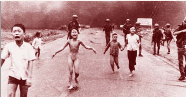
டௌ கெமிக்கல்ஸ் உற்பத்தி செய்து கொடுத்து, அமெரிக்க இராணுவம் 1972-இல் வீசிய நாபாம் குண்டுகளால் உடல் வெந்த நிலையில் ஓடிவரும் வியத்நாமியச் சிறுமி. (கோப்புப்படம்)

ஜெல்லியைப் போல கொழுகொழப்பான தும் தோலில் பட்டவுடன் தீயாய் எரியக் கூடிய துமான நாபாம் குண்டுகளும் கூட டௌ கெமிக்கல்ஸின் கண்டுபிடிப்புதான். வியத்நாமில் வீசப்பட்ட இந்த குண்டைத் தயாரித்த டௌ நிறுவனத்தை சிலாகித்து, ஒரு அமெரிக்க இராணுவ அதிகாரி அன்று கூறியது இதோ: “டௌ கெமிக்கல்ஸ் பசங்க கில்லாடிகள்தான். முதல் அடிக்கடி தயாரித்து அனுப்புன குண்டுக்கு சூடு பத்தல. அப்புறம் பசங்க அதில் பாலைஸ்டைரின் கலந்து அனுப்பிவிட்டாங்க. இப்போ போர்வையில் பீ ஒட்டற மாதிரி, அவனுங்க (வியத்நாம் மக்கள்) தோல் இது ஒட்டிகிச்சு. இருந்தாலும் அவனு தண்ணில குதிச்சு தப்பிச்சுகிட்டாங்க. அப்புறம் டௌ பசங்க வெள்ளை பால்பரஸ் கலந்து அனுப்பி விட்டாங்க. இது தண்ணிக்குள்ள போனாலும் எரியும். ஒரு சொட்டு பட்டா போதும். எலும்பு வரைக்கும் போகும். அப்புறம் மவனே, சாவு தான்.” இந்த நாபாம் குண்டைப்பற்றி அதனைத் தயாரித்த டௌ கெமிக்கல்ஸின் அன்றைய தலைவர் ஹெர்பர்ட் டி டோன், சொன்னார்: “இது ஒரு உயிர் காக்கும் ஆயுதம் - அமெரிக்கர்களுக்கு”