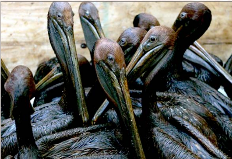
மெக்சிகோ வளைகுடாவில் பிரிட்டிஷ் பெட்ரோலியம் நிறுவனம் நடத்திய பேரழிவு: எண்ணெய் கசிவினால் மரணத்துடன் போராடும் கடல்வாழ் உயிரினங்கள்.

மெக்சிகோ வளைகுடாவில் குழாய் வெடித்து எண்ணெய்க் கசிவு ஏற்பட்ட போது மாண்டுபோன தொழிலாளர்கள் 11 பேர். ஆனால் போபாலில், அமெரிக்க யூனியன் கார்பைடு நிறுவனத்தால் ஆண் களும் பெண்களும் குழந்தைகளுமாகக் கொல்லப்பட்டவர்களின் எண்ணிக்கை