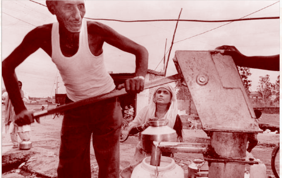
பாதுகாக்கப்பட்ட குடிநீர்கூட கொடுக்காமல் புறக்கணிக்கும் அரசின் வக்கிரம்: நச்சுக் கழிவுகளால் நஞ்சாகிவிட்ட நிலத்தடி நீரையே பயன்படுத்த வேண்டிய அவலத்தில் பாதிக்கப்பட்ட மக்கள். (கோப்புப்படம்)

நச்சுவாயுவின் பக்கவிளைவால் 1991-க்கு பின்னர் இறந்தவர்களே 20 ஆயிரத்துக்கும் மேல் இருப்பார்கள் என்கின்றனர், போபாலில் செயல்படும் மருத்துவர்கள். கீழே தள்ளிய குதிரை குழியும் பறித்த கதையாக நியாயமான நிவாரணத்தைக் கூட 26 ஆண்டுகளாகியும் தராத அரசு, நகரை அழகுபடுத்துவதாகச் சொல்லி 90-களின் ஆரம்பத்தில் புல்டோசர்களைக் கொண்டு அந்த ஏழை மக்களின் குடிசைகளைப் பிடித்து ஏறிந்தது.