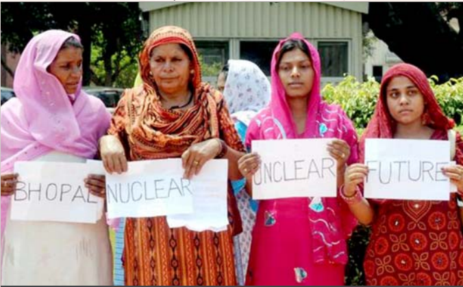
அணுசக்தி கடப்பாடு மசோதாவைக் கண்டித்து, போபால் விஷவாயுக் கசிவால் பாதிக்கப்பட்ட பெண்கள் நடத்திய ஆர்ப்பாட்டம். (ஊப்புப் படம்)

ஆனால் அதற்கு நேர் எதிராக, போபாலை விஞ்சும் படுகொலைகளை நிகழ்த்தினாலும், பைசா செலவில்லாமல் அமெரிக்க முதலாளிகளைக் காப்பாற்றுவதெப்படி என்று ஆண்டர்சனைப் போலவே சிந்தித்து மன்மோகன் அரசு தயாரித்திருப்பதுதான், அணுசக்தி கடப்பாடு மசோதா (Civil nuclear liability bill).