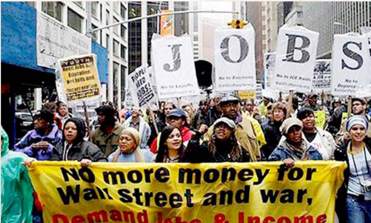
“வால் ஸ்ட்ரீட்” பங்குச் சந்தை முதலாளிகளுக்கும், ஆயுத வியாபாரிகளுக்கும் பொதுப்பணத்தை வாரியியிறைக்காதே என முழங்கி அமெரிக்க மக்கள் நடத்திய ஆர்ப்பாட்டம். (சோப்பு படம்)

(ஜூன் 15, 2010 - “தி இந்து” நாளேட்டில் பி.சாய்நாத் எழுதிய கட்டுரையின் சுருக்கப்பட்ட தமிழாக்கம்)