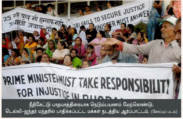
நீதிகேட்டு பாதயாத்திரையாக நெடும்பயணம் மேற்கொண்டு, டெல்லி-ஜந்தர் மந்தரில் பாதிக்கப்பட்ட மக்கள் நடத்திய ஆர்ப்பாட்டம். (கோப்பு படம்)