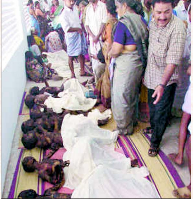
குடந்தையில் கல்வி முதலாளியின் இலாபவெறித் தீயில் கருகிப் போன குழந்தைகள்: இது, எதிர்பாராத தீ விபத்தா? படுகொலையா? (கோப்புப் படம்)

அமெரிக்காவிலுள்ள யூனியன் கார்பைடு கார்ப்பரேஷன் (யு.சி.சி.) தாய் கம்பெனி என்றும், இந்தியாவிலுள்ள யூனியன் கார்பைடு இந்தியா லிமிடெட் (யு.சி.ஐ.எல்.) அதன் துணை நிறுவனம் என்றும் இந்நிறுவனம் தொடங்கப்படும்போது அதிகாரபூர்வமாக அறிவிக்கப்பட்டுள்ளது. மேலும் இந்த இந்திய நிறுவனத்தில், அமெரிக்க நிறுவனம் பெருமளவு பங்குகளை வைத்திருந்தது. இந்த ஆலையானது காலாவதியான தொழில்நுட்பத்துடன், கழித்துக் கட்டப்பட்ட இயந்திரங்களுடன் அமெரிக்க நிறுவனத்தால்தான் வடிவமைக்கப்பட்டுள்ளது என்பதை ஆலையின் ஆவணங்கள் நிரூபித்துக் காட்டுகின்றன.