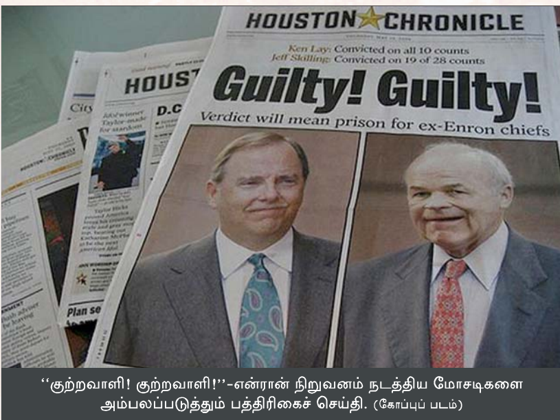
“குற்றவாளி! குற்றவாளி!”-என்றான் நிறுவனம் நடத்திய மோசடிகளை அம்பலப்படுத்தும் பத்திரிகைச் செய்தி. (கோப்பு படம்)

இத் தீர்ப்புகளில் முதலாவது 2008-இல் வழங்கப்பட்டது. எக்சான் வேலிஸ் எண்ணெய் நிறுவனம் 1989