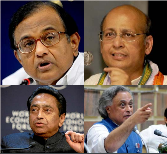
டௌ கெமிக்கல்ஸின் அடிவருடிகள்: (மேல்வரிசை) உள்துறை அமைச்சர் ப.சிதம்பரம்; காங்கிரசின் செய்தித் தொடர்பாளர் அபிஷேக் மணு சிங்வி; (கீழ் வரிசை) வர்த்தகத் துறை அமைச்சர் கமல் நாத்; சுற்றுப்புறச்சூழல் துறை அமைச்சர் ஜெய்ராம் ரமேஷ்.

வதை 1996-ஆம் ஆண்டோடு நிறுத்திக் கொண்டது; அதன் பிறகு அவ்விஷவாயு பாதிப்பால் புற்று நோய் மற்றும் சிறுநீரகக் கோளாறுக்கு ஆளானவர்கள், ஊனமாகப் பிறந்த குழந்தைகள், கண்பார்வை இழந்தவர்கள் எவ்வித நிவாரண உதவிக்கும் வழியின்றி அரசால் அம்போ என்று கைவிடப்பட்டனர். 1996-க்குப் பிறகு விஷவாயு பாதிப்பால் இறந்து போனவர்களின் எண்ணிக்கை மட்டும் 10,000-ஐத் தாண்டும் எனக் கூறப்படுகிறது. அதனால் தான், பாதிக்கப்பட்டவர்களுக்காகப் போராடும் அமைப்புகள் பாதிப்பு பற்றிப் புதிய கணக்கெடுப்பு நடத்த வேண்டும் என்று கோரி வருகின்றன.