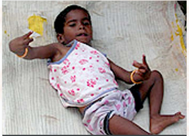
ஐரகந்து மாநிலத்தின் ஐாடுகுடாவிலுள்ள யுரேனியச் சுரங்கங்களிலிருந்து வெளிப்படும் கதிர்வீச்சால் ஊனமாகிப் போன சிறுவன்.

போபால் பிரச்சினையில் அமெரிக்க முதலாளிகள் சில பாடங்களைக் கற்றுக்கொண்டிருந்தனர். அன்று பாதிக்கப்பட்ட மக்கள் சிலர் நேரடியாக அமெரிக்க நீதிமன்றத்தில் வழக்கு தொடுத்தனர். அமெரிக்க நீதிமன்றத்தில் வழக்கு நடத்தினால் மிக அதிகமான தொகையை யூனியன் கார்பைடு இழப்பீடாகத் தரவேண்டிவரும் என்பதால், இந்திய மக்களின் வழக்காடும் உரிமையை ரத்து செய்ய ஒரு சட்டம் இயற்றியது காங்கிரசு அரசு. பின்னர், அமெரிக்க நீதிமன்றத்திலிருந்து இந்தியாவுக்கு வழக்கை மாற்றி, கோரிய இழப்பீட்டுத் தொகையில் 15% மட்டும் பெற்றுக்கொண்டு வழக்கையே முடித்துக் கொண்டது.