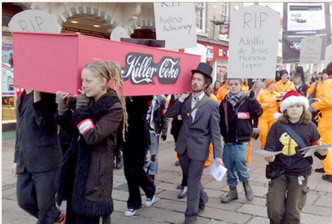
கோக்கின் கிரிமினல் குற்றச் செயல்களை அம்பலப்படுத்தி இங்கிலாந்தில் பல்கலைக் கழக மாணவர்கள் நடத்திய ஆர்ப்பாட்டம். (கோப்புப் படம்)

இந்திய நாடு மறுகாலனியாவது என்ற இந்தப் போக்கு போபால் நச்சுவாயுப் படுகொலைகள் மூலம் யூனியன் கார்ப்பைடால் தொடங்கி வைக்கப்பட்டது; விவசாயத் தொழில் பன்னாட்டு கழகமான மான்சாண்டோவால் நிறைவு செய்யப்படும். விவசாயத்தை அடிப்படைத் தொழிலாகக் கொண்டுள்ள இந்த நாட்டில் விவசாய உற்பத்