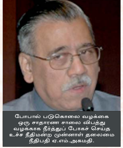
போபால் படுகொலை வழக்கை ஒரு சாதாரண சாலை விபத்து வழக்காக நீர்த்துப் போகச் செய்த உச்ச நீதிமன்ற முன்னாள் தலைமை நீதிபதி ஏ.எம்.அகமதி.