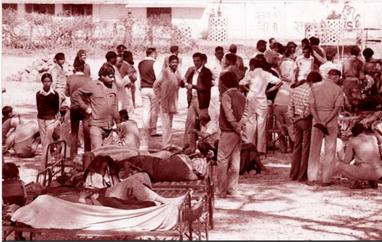
நச்சுவாயுவால் பாதிக்கப்பட்டு உயிருக்குப் போராடுவோரைக் கிடத்தக்கூட இடமின்றி நிரம்பி வழிந்த மருத்துவமனை. இது சாதாரண விபத்தா, பயங்கரவாதமா? (சுட்புப் படம்)