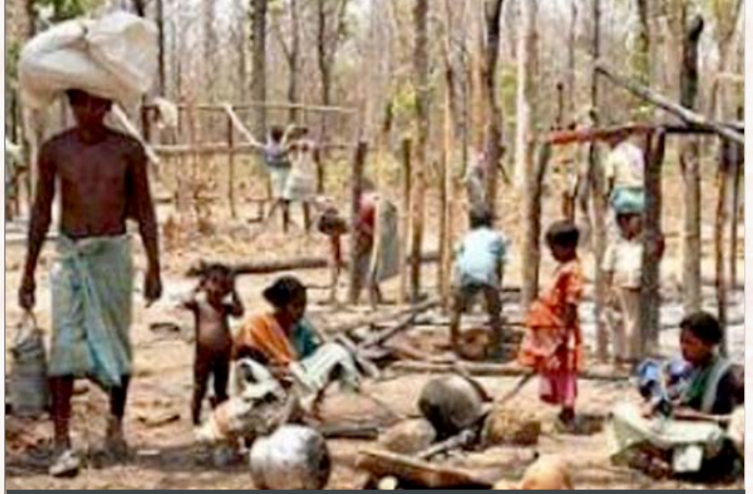
பன்னாட்டுச் சுரங்க முதலாளிகளின் இலாபத்திற்காக, உள்நாட்டிலேயே அகதிகளாக்கப்பட்டுள்ள சத்தீஸ்கர் மாநிலப் பழங்குடியின மக்கள்.

அதனால்தான், போபால் நச்சுப்புகைப் படுகொலைக் கான பொறுப்பை டௌ கெமிக்கல்ஸ் மீது தள்ளுவோ, ஆலையின் கழிவுப் பொருட்களை அகற்றுவதில் அதன் பொறுப்பை வலியுறுத்தவோ கூடாது என்று ரத்தன் டாடா இந்திய அரசுக்கு தானே முன்வந்து பரிந்துரை அனுப்பினார். 1980-களில் இருந்து தனியார்மயம் - தாராளமயம் - உலகமயமாக்கக் கொள்கையைப் பின்பற்றும் இந்திய அரசு, கொள்ளை இலாபம் தரும் அரசுத் துறை தொழில்களைத் தனியார்மயமாக்கிய போது நாட்டின் சொத்துக்களை அபகரித்துக் கொண்டு கொழுத்தவர்கள்தான், இந்தியாவின் இந்த நாடுகடந்த தரகு அதிகார வர்க்க முதலாளிகள். இவர்கள் அமெரிக்க ஏகாதிபத்திய மற்றும் பன்னாட்டுத் தொழில் கழகங்களின் இளைய பங்காளிகளாகி, நாட்டை மறுகாலனியாக்கி ஆதாயம்