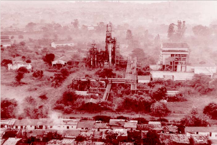
நெருக்கமான குடியிருப்புப் பகுதியில் கட்டியமைக்கப்பட்ட யூனியன் கார்பைடு நச்சு ஆலை: போபால் மக்களை மரணவாயிலில் தள்ளிய இலாபவெறி. (சோப்பு படம்)

இப்படித்தான் கடந்த 2004-ஆம் ஆண்டு குடந்தையில், பள்ளி எனும் கொள்ளிவாய்க்குள் 93 குழந்தைகள் சிக்கி எரிந்து கரிக்கட்டையாகிய போதும், கீற்றுக் கொட்டகைதான் தீ விபத்துக்குக் காரணம், விதிமுறைகளைப் பின்பற்றாததுதான் காரணம் என்று அரசும் பத்திரிகைகளும் கண்ணீர் வடித்தன. கல்வி முதலாளிகளின் இலாப வெறி எனும் தீயினால்தான் குடந்தையில் பள்ளிக் குழந்தைகள் கருகிப் போயினர் என்ற உண்மையை மூடி மறைத்தன.