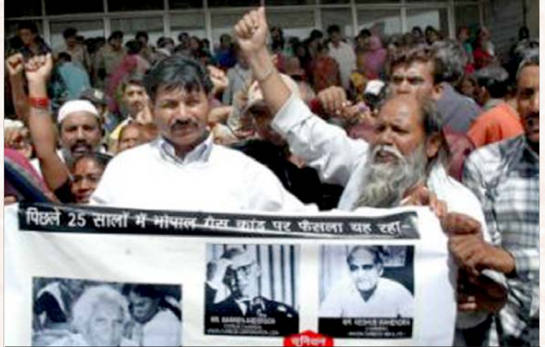
இந்தியக் குற்றவாளிகளுக்கு அளிக்கப்பட்ட இரண்டு ஆண்டு சிறைத் தண்டனையைக் கண்டித்துப் பாதிக்கப்பட்ட மக்கள் போபால் மாவட்ட நீதிமன்றம் முன்பு நடத்திய ஆர்ப்பாட்டம்.

அவ்வாலை தொழில்நுட்பக் குறை பாடுடைய ஆலை என்பதையும், அவ்வாலையில் கொடிய நச்சுத் திரவமான மெதில் ஐசோ சயனடை அதிக அளவில் சேமித்து வைத்திருந்தனர் என்பதையெல்லாம் ஏற்றுக் கொண்ட உச்ச நீதிமன்ற நீதிபதிகள், “சம்பவம் நடந்த அன்று நிர்வாகிகளா ஆலையை இயக்கினார்கள்? அன்று விபத்து நடக்கப் போவதை அவர்கள் அறிந்தா இருந்தார்கள்? பல பேரைப் பலி கொள்ளும் நோக்கத்தோடா நச்சுத் திரவத்தைச் சேமித்து வைத்திருந்தார்கள்?” என்ற திகைப்பூட்டும் கேள்விகளை எழுப்பி, 9 இந்தியக் குற்றவாளிகளின் மீதான கொலைக் குற்றமாகாத மரணம் விளைவிக்கும் குற்ற வழக்கை, ஒரு சாதாரண சாலை விபத்தைப் போன்ற குற்றமுறு கவனக்குறைவான வழக்காக நீர்த்துப் போகச் செய்தனர்.