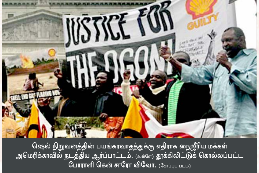
ஷெல் நிறுவனத்தின் பயங்கரவாதத்துக்கு எதிராக நெஜீரிய மக்கள் அமெரிக்காவில் நடத்திய ஆர்ப்பாட்டம். (உள்ளே தூக்கிலிட்டிட்டுக் கொல்லப்பட்ட போராளி கென் சாரோ விவோ. (கோப்பு படம்)

இதுவொருபுறமிருக்க, 1989-ஆம் ஆண்டில் அமெரிக்காவின் எக்சான் எண்ணெய் நிறுவனத்தின் கப்பல் விபத்துக்குள்ளாகி, அலாஸ்கா அருகே கடலில் 10 மில்லியன் காலன் அளவுக்கு எண்ணெய் சிந்தி அப்பகுதியின் சுற்றுச்சூழல் நாசமாகியது. அந்த விபத்தில் யாரும் உயிரிழக்கவில்லை. எனினும் மீன்கள் செத்து மிதந்தன,