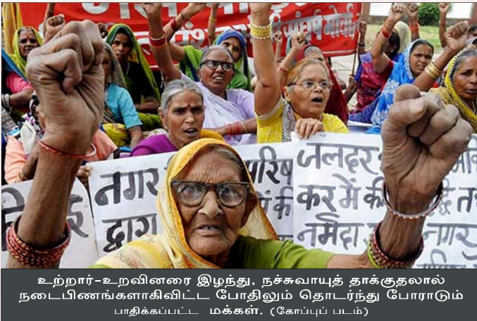
உற்றார்-உறவினரை இழந்து, நச்சுவாயுத் தாக்குதலால் நடைபிணங்களாகிவிட்ட போதிலும் தொடர்ந்து போராடும் பாதிக்கப்பட்ட மக்கள். (கோப்பு படம்)