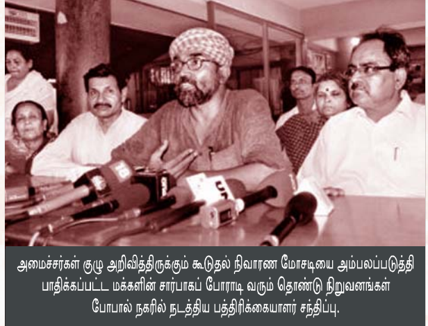
அமைச்சர்கள் குழு அறிவித்திருக்கும் கூடுதல் நிவாரண மோசடியை அம்பலப்படுத்தி பாதிக்கப்பட்ட மக்களின் சார்பாகப் போராடி வரும் தொண்டு நிறுவனங்கள் போபால் நகரில் நடத்திய பத்திரிக்கையாளர் சந்திப்பு.

காங்கிரசில் மட்டுமல்ல, எதிர்க்கட்சியான பா.ஜ.க-விலும் டெள கெமிக்கல்ஸுக்கு நண்பர்கள் இருக்கிறார்கள். அக்கட்சியின் முக்கியத் தலைவர்களுள் ஒருவரான அருண் ஜெட்லி 2006-ஆம் ஆண்டில் டெள கெமிக்கல்ஸின் வழக்குரைஞராகப் பணியாற்றியிருக்கிறார். “யூனியன் கார்பைடு ஆலைக்குள் பெட்ரோல்-டீசல் கழிவுகள்தான் கொட்டிக்கிடக்கிறதேயொழிய, இரசாயனக் கழிவுகள் எதுவும் கிடையாது” என அறிக்கை விட்ட புண்ணியவான்தான் பாபுலால் கௌர். இவர் மத்தியப் பிரதேச பா.ஜ.க. அரசில் போபால் நிவாரணப் பணிகளுக்கான அமைச்சராக இருந்தபொழுதுதான் இந்த அறிக்கையை வெளியிட்டார் என்பது குறிப்பிடத்