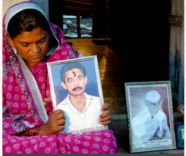
தற்கொலை செய்து கொண்ட விதர்பா பகுதியைச் சேர்ந்த பருத்தி விவசாயி: மான்சாண்டோ நிறுவனம் பி.டி.பருத்தி விதை மூலம் இந்திய விவசாயிகள் மீது தொடுத்துவரும் பயங்கரவாதத் தாக்குதல். (சோப்புப் படம்)

இந்தச் சூழலில் நடந்த போபால் நச்சவாயுப் படுகொலை நிகழ்வில் ராஜீவ் கும்பலின் நடத்தை என்பது ஏகாதிபத்திய, பன்னாட்டுத் தொழில் நிறுவனங்களுக்கு அதன் விசுவாசத்தை உறுதிப்படுத்துவதற்கான ஒரு