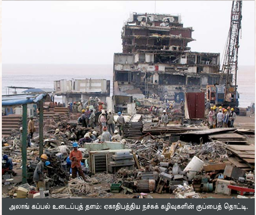
அலாங்கப்பல் உடைப்புத் தளம்: ஏகாதிபத்திய நச்சுக் கழிவுகளின் குப்பைத் தொட்டி.

நிலமும் நீரும் கடலும் காற்றும் வாழ்வும் வளமும் மட்டுமல்ல, இயற்கையின் உன்னதப் படைப்பான மனிதனும் ஏகாதிபத்தியங்களின் இலாபவெறிக்காக சூறை