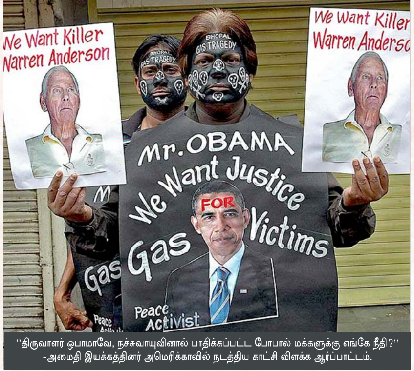
“திருவாளர் ஓபாமாவே, நச்சுவாயுவினால் பாதிக்கப்பட்ட போபால் மக்களுக்கு எங்கே நீதி?” -அமைதி இயக்கத்தினர் அமெரிக்காவில் நடத்திய காட்சி விளக்க ஆர்ப்பாட்டம்.

நைஜீரியாவில், பன்னாட்டு ஏகபோக எண்ணெய் நிறுவனமான ஷெல் நடத்திய சூறையாடலால்