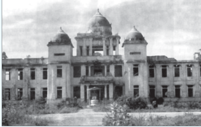
1983, ஜூலையில் ஈழத்தமிழர்களுக்கு எதிராகச் சிங்கள இனவெறியாளர்களால் நடத்தப்பட்ட படுகொலை மற்றும் கலவரத்தின் பொழுது எரிக்கப்பட்ட சிதைக்கப்பட்ட யாழ் நூலகம். (கோப்புப் படம்)

ஒரு அரசியலும், வவுனியாவிற்கு வடக்கிலும் கிழக்கிலும் தமிழர்களிடம் ஓட்டுப் பொறுக்குவதற்காக மட்டுமே தமிழ்த் தேசிய அரசியலும் தேவைப்பட்டன. அதற்கேற்பவே இவ்விரண்டு கட்சிகளும் தமிழீழச் சிக்கலைக் கையாண்டன.