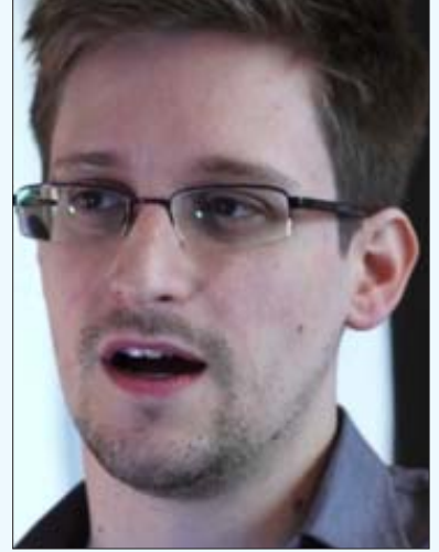
ரசியாவில் தற்காலிகமாக அரசியல் தஞ்சமடைந்துள்ள ஸ்னோடென்