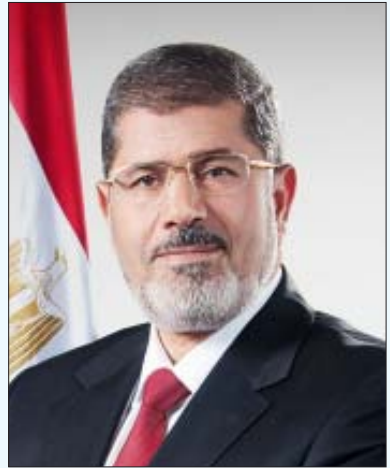
எகிப்து இராணுவத்தால் அதிபர் பதவியிலிருந்து நீக்கப்பட்டு, சட்டவிரோதக் காவலில் வைக்கப்பட்டுள்ள முகம்மது மோர்ஸி

டாலும், அது தேர்தலை ரத்து செய்யும்படி இராணுவக் கும்பலைநிர்பந்திக்கும் அளவிற்குப் பலம்வாய்ந்ததாக அமையவில்லை.