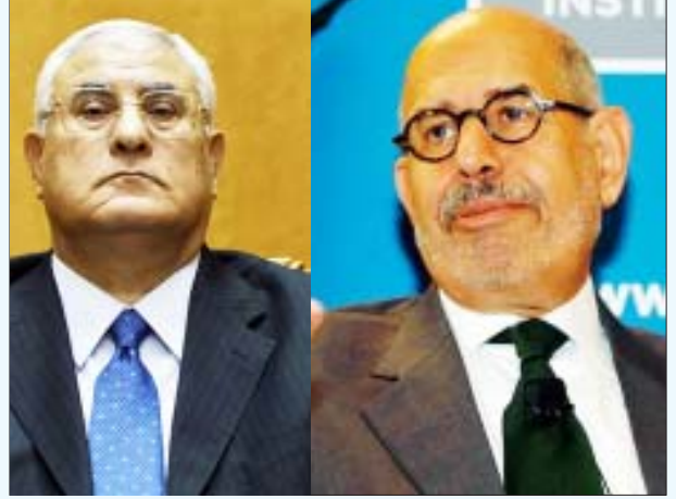
இராணுவத்தால் புதிய அதிபராக நியமிக்கப்பட்டுள்ள முன்னாள் அதிபர் முபாரக்கின் விசுவாசியும் உச்ச நீதிமன்ற நீதிபதியுமான அட்லி மஹ்மூத் மன்சூர் (இடது) மற்றும் துணை அதிபராக நியமிக்கப்பட்டுள்ள அமெரிக்க விசுவாசி முகம்மது எல்-பராதேய்.

“முபாரக்கால் ஊட்டி வளர்க்கப்பட்ட இராணுவம், முபாரக்கால் நியமிக்கப்பட்ட நீதிபதிகள், போலீசு மற்றும் அதிகாரவர்க்கம் - இக்கும் பல்தான் இப்பொழுது