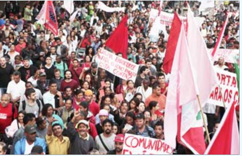
உலகமயத்தால் கொழுத்துப் போயுள்ள கோடீசுவர கும்பலுக்கும் அவர்களின் அரசுக்கும் எதிரான போராட்டத்தில் பிரேசில் நாட்டு உழைக்கும் மக்கள்.