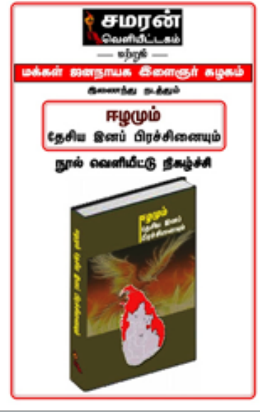
சமரன் வெளியீட்டகத்தால் வெளியிடப்பட்ட ஈழமும் தேசிய இனப் பிரச்சினையும் என்ற நூலின் வெளியீட்டு விழா அழைப்பிதழ். (கோப்புப் படம்)

கொண்டு இங்கிலாந்து முடியரசுக்குச் சேவை செய்தனர். அதைப் போலவே, இலங்கையிலும் சிங்களப் பௌத்த மேட்டுக்குடியினரும் யாழ்ப்பாண வேளாள சாதி மேட்டுக்குடியினரும் ஆங்கிலக் கல்வி சட்டம் பயின்று, காலனிய இலங்கையில் அரசின் நிர்வாக அமைப்பில் இடம் பிடித்துக் கொண்டு இங்கிலாந்து முடியரசுக்குச் சேவை செய்தனர். இந்தவகையில் சிங்கள டான் சேனநாயகா, அவரது மகன் டட்டி சேனநாயகா குடும்பமும் ஈழத்தின்பொன்னம்பலம் அருணாச்சலம், அவரது மகன் பொன்னம்பலம் இராமநாதன் குடும்பமும் ஒன்றுபட்டுத் தலைமை வகித்தன. சிங்கள - ஈழத்தமிழ் சமூகங்களின் சார்பாக இவர்கள் ஒன்றுபட்டு நிறுவிக் கொண்டதுதான், அனைத்து இலங்கை தேசியக் காங்கிரசு கட்சி. இக்கட்சிக்குத் தலைமையேற்றிருந்த பொன்னம்பலம் இராமநாதன் (இப்பெயர் சமரன் குழு சொல்வதைப் போல இராமநாதன், பொன்னம்பலம் என்ற இரண்டு நபர்களைக் குறிப்பதில்லை, ஒரே நபர்தான்) இசுலாமியர்கள் மீதான 1915 தாக்குதலில் சிங்களவருக்கு வக்காலத்து வாங்கியதில் சிறப்பு ஏதுமில்லை.