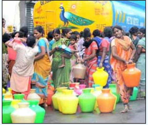
ஒப்பந்தச் சேவைகள் அமர்த்தம் என்ற முறையின் கீழ் நடக்கும் குடிநீர் வியாபாரக் கொள்ளை

ஆட்சியை லைசென்ஸ்-பர்மிட்-கோட்டா ராஜ்ஜியம் என்று ஏளனம் செய்தார். சோவியத் ஒன்றியத்தின் உதவியுடன் வந்த அரசுத் துறைத் தொழில்களை வெள்ளையானைகளைக் கட்டி மேய்க்கும் வேலை என்று கேலி பேசினார். எதற்கு? எல்லாம்பார்ப்பன-பனியா-மார்வாரி - பார்சி தரகு முதலாளிகளின் கொள்ளைக்கு முழுமையாகத் திறந்து விடவேண்டும் என்பதற்காக! எல்லாம் தனியார்மயமாக்க வேண்டும் என்பதற்காக!