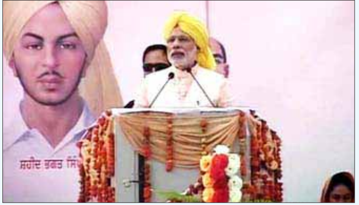
பகத்சிங்கைத் தமது ஆளாகக் காட்ட முயலும் இந்து மதவெறிக்கும்பல்: பகத்சிங், ராஜ்குரு, சுகதேவ் ஆகியோரின் நினைவுநாளையொட்டி, பஞ்சாபிலுள்ள ஹுசைனிவாலா கிராமத்தில் அமைந்துள்ள தேசிய தியாகிகள் நினைவிடத்தில் உரையாற்றும் ஏகாதிபத்திய விசுவாசி நரேந்திர மோடி.

பகத்சிங், தன்னுடைய கட்டுரைகளில் தீண்டாமை மற்றும் சாதியைப் பற்றி எள்ளி நகையாடவே செய்வார். குறிப்பாக, “மேல்சாதிக்காரருடைய வீட்டின் அடுப்பங்கரைக்குள் நாய் நுழைய முடியும்; ஆனால் மனிதர்கள் போகமுடியாது” எனக்கூறுகிறார். தாழ்த்தப்பட்டோரின் ஒடுக்குமுறைக்கெதிராக பேசும் போது “ஓ, ஒடுக்கப்பட்டவர்களே! நீங்கள் சிங்கம் போன்றவர்கள்! விழித்தெழுங்கள்! உங்கள் உரிமைகளை நீங்களே பறித்துக் கொள்ளுங்கள்” என்கிறார். மேலும் புரட்சியின் மூலமே சாதியை ஒழிக்க முடியும் என்பது பகத்சிங்கின் எண்ணம்.