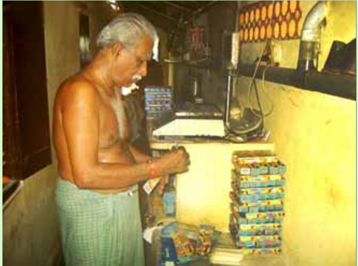
குடிசைத் தொழிலாக நடந்துவரும் மெழுகுவர்த்தி தயாரிப்பு.

குறுந்தொழிலையும், அதனை நடத்திவரும் அடித்தட்டுப் பிரிவினரையும் கைதூக்கிவிடப் போவதாக மோடியும் அவரது பரிவாரங்களும் விளம்பரம் செய்துவருவது எத்தகையதொரு பித்தலாட்டம்!