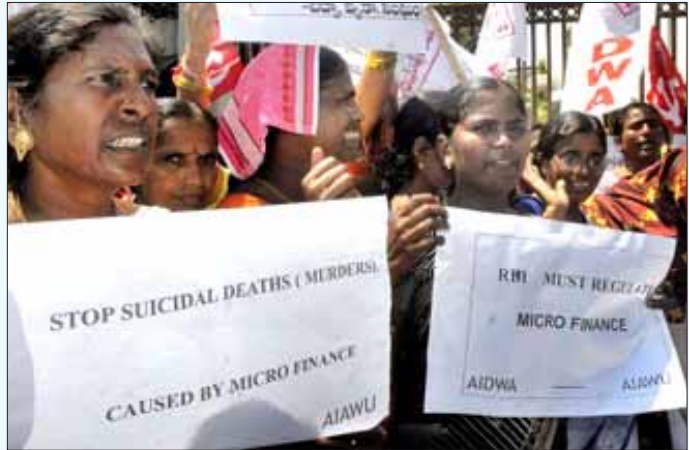
குறு நிதி நிறுவனங்களின் அத்துமீறல்களையும் அடாவடித் தனங்களையும் கண்டித்தும், அவற்றின் மீது நடவடிக்கை எடுக்கக் கோரியும் ஹைதராபாத்திலுள்ள ரிசர்வ் வங்கிக் கிளையின் முன்பாக ஆர்ப்பாட்டம் நடத்தும் கிராமப்புற பெண்கள். (கோப்பு படம்)

கார்ப்பரேட் நிறுவனங்களும், பொதுத்துறை நிறுவனங்களும் தமது உற்பத்தியில் 20 முதல் 30 சதவீத வேலைகளை குறு மற்றும் சிறு நிறுவனங்களிடம் கொடுத்து வாங்க வேண்டும் எனக் கோரிக்கை வைக்கப்பட்டாலும், அதனை முழுமையாக நடைமுறைப்படுத்தும் நிலையில் பொருளாதார நிலையும் இல்லை. அரசின் பொருளாதாரக் கொள்கையும் குறு, சிறு நிறுவனங்களுக்கு ஆதரவாக இல்லை. குறிப்பாக, உற்பத்தித்துறையில் நுழையும் பன்னாட்டு நிறுவனங்கள் தமது வேலைகளை, தமக்குச் சொந்தமான துணை நிறுவனங்களிடமே கொடுத்து வாங்கிக் கொள்கின்றன; அல்லது வெளிநாடுகளிலிருந்து இறக்குமதி செய்து கொள்கின்றன. பொருளாதாரமந்தம், தேக்கம் மற்றும் பன்னாட்டு நிறுவனங்களுக்கு ஆதரவான அரசின் தொழிற்கொள்கை ஆகியவை காரணமாக ஜாப் ஆர்டர் கிடைக்காமல், குறு மற்றும் சிறு நிறுவனங்கள் மூடப்படும் அபாயத்தை எதிர்கொண்டு நிற்கின்றன. இந்த நிலையில் முத்ரா திட்டத்தை குருமூர்த்தி உள்ளிட்ட இந்து மதவெறிக்கும்பல் சர்வரோக நிவாரணியாக முன்னிறுத்துவது புண்ணுக்கு புணுகுதலும் ஜால வித்தைக்கு ஒப்பானதாகும்.