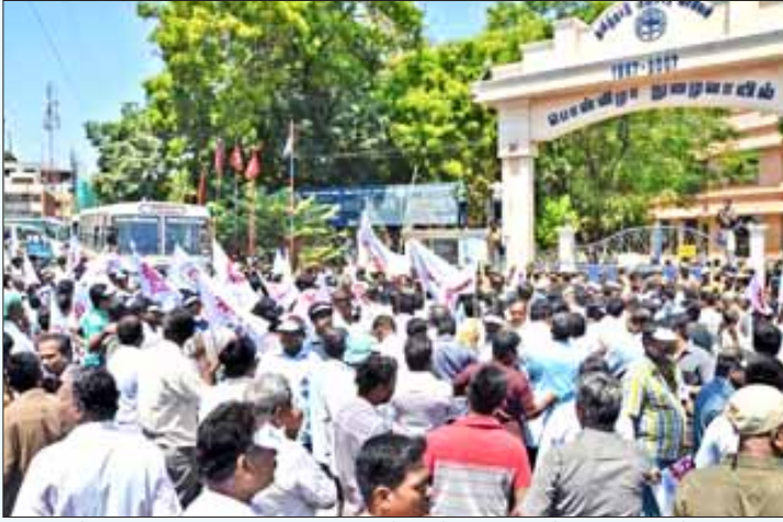
தமிழ்நாடு குடிசை மற்றும் குறுந்தொழில் சங்கத்தினர் தடையில்லா மின்சாரம் வழங்குவதை உறுதி செய்யக் கோரி கோயம்புத்தூர் மின்வாரிய அலுவலகத்தை முற்றுகையிட்டு நடத்திய ஆர்ப்பாட்டம். (கோப்புப் படம்)

களின் வளர்ச்சிக்காக 10,000 கோடி ரூபாய் ஒதுக்கப்படுவதாக அறிவிக்கப்பட்ட திட்டம் நடைமுறைக்கே வரவில்லை என சிறுதொழில் சங்கங்கள் குறிப்பிடுகின்றன. இவையெல்லாம் முத்ராவங்கித் திட்டமும் மற்றும் மொரு சவடால் அறிவிப்பு தவிர வேறில்லை என்பதைத்தான் எடுத்துக் காட்டுகின்றன.