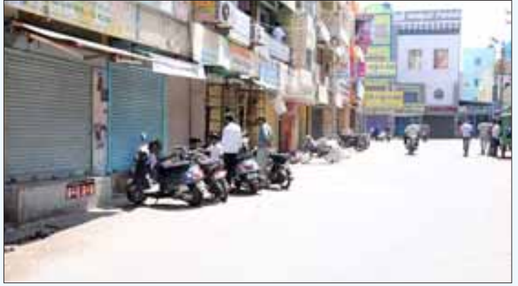
காவிரியின் குறுக்கே மேக்கேதாட்டு அணையைக் கட்டத் திட்டமிடும் கர்நாடக அரசின் அடாவடித்தனத்தை எதிர்த்து தஞ்சை டெல்டா மாவட்டங்களில் நடந்த கடையடைப்புப் போராட்டம்

மனைத் தொழிலில் ஈடுபட்டுள்ள புதுப்பணக்கார மாஃபியா கும்பலின் ஆதாயத்துக்காகவும் ஏரிகள் தனியாருக்குத் தாரை வார்க்கப்பட்டன; அல்லது, அவை வீட்டுமனைகளாக மாற்றப்பட்டன. இதனால்தான் பெங்களூரு நகரில் குடிநீர்தட்டுப்பாடும் கட்டணக்கொள்ளையும் தீவிரமாகியுள்ளது.