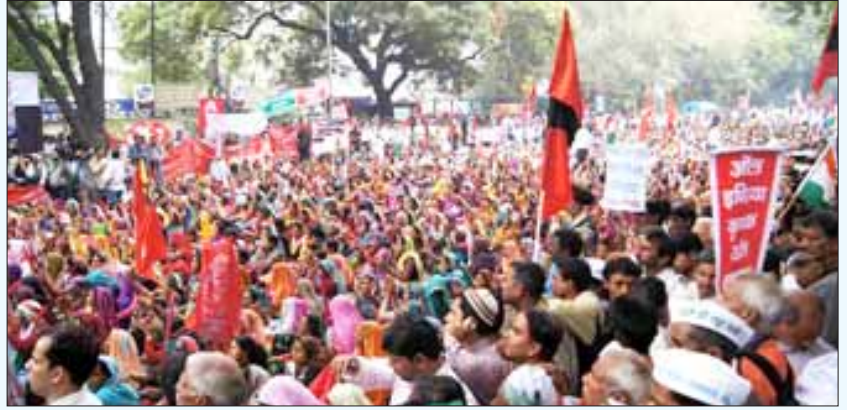
முப்போகமும் விளையக்கூடிய செழிப்பான விளைநிலங்களை கார்ப்பரேட் நிறுவனங்களுக்குப் பிடுங்கிக் கொடுக்கும் நோக்கோடு மோடி அரசு கொண்டுவந்திருக்கும் நிலம் கையகப்படுத்தும் அவசரச் சட்டத்தை எதிர்த்து விவசாயிகளும் எதிர்க்கட்சிகளும் இணைந்து டெல்லியில் நடத்திய ஆர்ப்பாட்டம்.

இவர்களின் சேவைக்காக, விவசாயப் பல்கலைக்கழகங்கள், விவசாய ஆராய்ச்சிக்கான இந்திய கவுன்சில் (ICAR), வேளாண் அமைச்சகங்கள், வேளாண் விரிவாக்க அலுவலகங்கள், பல்துறை வல்லுனர் குழுக்கள் ஆகியவை பணிக்கப்பட்டுள்ளன. இவையனைத்தையும் இயக்க பன்னாட்டு மற்றும் தரகு அதிகார வர்க்க முதலாளித்துவக் கம்பெனிகளின் தலைமை நிர்வாகிகள், அரசு அதிகாரிகள், வல்லுனர்கள், அமெரிக்க - பன்னாட்டு வேளாண் உணவுக் கழக நிறுவனத் தலைவர்கள் கொண்ட உயர் மட்ட குழு அமைக்கப்பட்டுள்ளது. இவ்வாறு ஒவ்வொரு துறையிலும் இந்த முறையில் அரசின் பல்வேறு நிறுவனங்கள், அவர்களின் நோக்கங்கள், திட்டங்கள், பணிகள் ஆகியவை மாற்றியமைக்கப்பட்டுள்ளன.