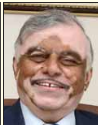
பிரஜாபதி துளசிராம் கொலை வழக்கில் புதிதாக முதல் தகவல் அறிக்கை பதிவு செய்ய வேண்டியதில்லை என அமித் ஷாவிற்கு (இடது) ஆதரவாகத் தீர்ப்பளித்த நீதிபதி சதாசிவத்துக்குக் கிடைத்த வெகுமதி - கேரள மாநில ஆளுநர் பதவி.