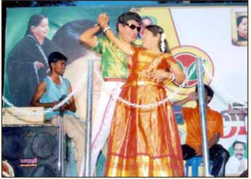
தேர்தல் பிரச்சாரக் கூட்டங்கள் என்பது குத்தாட்ட ஆபாச வக்கிரமாக மாறிப் போனது.

தேர்தலுக்கு முன்பு அமைக்கப்படும் கூட்டணிகள் தேர்தல் முடிந்தவுடன் கலைந்து புதிய கூட்டணிகள் அமையும்; தேர்தலுக்குத் தேர்தல் கூட்டணிகள் மாறும். அதேவேளையில், கார்ப்பரேட் முதலாளிகளின் பகற் கொள்கைக்கு சேவை செய்வதிலும் தங்களது தலைமையிலான அரசுகளை அதற்கான கருவியாகப் பயன்படுத்துவதிலும், அதன்மூலம் எல்லாவிதமான முறைகளிலும் தங்களுக்கான சொத்துக்களைக் குவித்துக் கொள்வதிலும் இவர்கள் ஒன்றுபட்டு நிற்கின்றனர். ஆட்சி நடத்துகின்ற, அரசை இயக்குகின்ற கட்சிகளின் தன்மையில் இப்படிப்பட்ட மாற்றங்கள் நடந்துள்ளன.