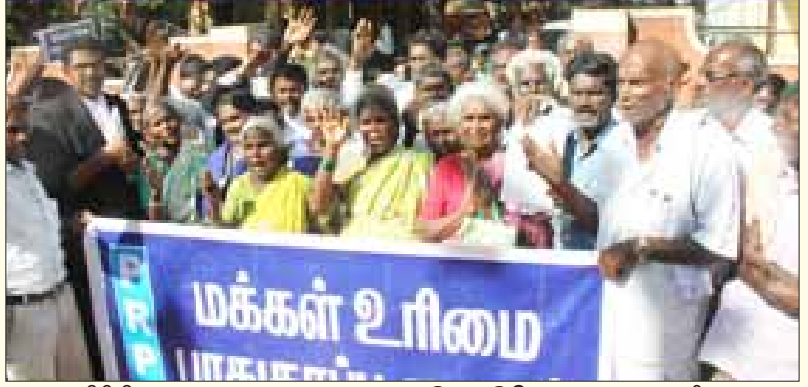
கிரிமினல் மருத்துவர்களுக்கு ஓராண்டு மட்டுமே தண்டனை அளித்த தீர்ப்பை எதிர்த்து திருச்சி நீதிமன்ற வளாகத்தில் பாதிக்கப்பட்டவர்கள் நடத்திய ஆர்ப்பாட்டம்.

வழியின்றி முடங்கிவிட்டனர். அப்பாவி மக்களை இந்த நிலைமைக்கு ஆளாக்கிய மருத்துவர்களோ, கிரிமினல்களைப் போலத் தடயங்களை அழிக்கும் முயற்சியில்தான் ஈடுபட்டார்கள்.