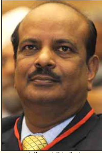
டான்சி வழக்கில் சிறப்பு நீதிமன்றத்தால் தண்டிக்கப்பட்ட ஜெயாவைச் சட்டத்தை வளைத்து விடுதலை செய்த நீதிபதி தினகர்.

இப்படி அ.தி.மு.க.வால் அரசு அதிகாரத்தோடு உருவாக்கப்பட்ட எல்லா தடைகளையும் மீறி அக்கட்சியைச் சேர்ந்த