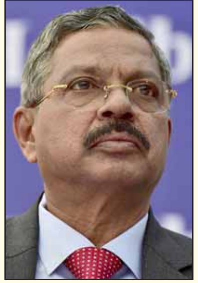
ஜெயலலிதாவுக்கு உச்சநீதி மன்றத் தலைமை நீதிபதி தத்து.

ஜெயலலிதாவுக்கு எதிரான வழக்குகளில் மட்டுமல்ல, பன்னாட்டு முதலாளிகள், தரகுமுதலாளிகளுக்கு எதிரான வழக்குகளிலும், பார்ப்பன பாசிஸ்டுகளுக்கு எதிரான வழக்குகளிலும் இதுதான் நடந்தது. இன்னமும் நடந்து கொண்டிருக்கிறது.