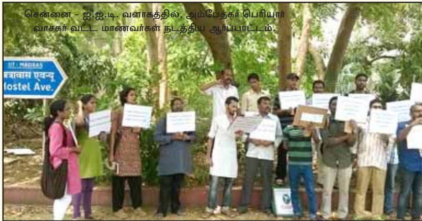
சென்னை - ஐ.ஐ.டி. வளாகத்தில், அம்பேத்கர் பெரியார் வாசகர் வட்ட மாணவர்கள் நடத்திய ஆர்ப்பாட்டம்.

உள்ளே விவேகானந்தா ஸ்டடி சர்க்கிள் என்ற ஆர்.எஸ்.எஸ்.