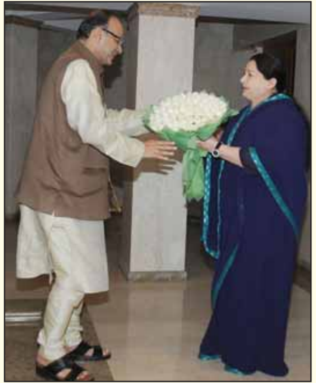
நிதியமைச்சர் அருண் ஜெட்லி போயசு தோட்டத்தில் ஜெயாவைச் சந்தித்த சில நாட்களிலேயே அவர் வருமான வரி வழக்கிலிருந்து விடுவிக்கப்பட்டார். காக்கை உட்காரப் பணம் பழம் விழுந்த கதையல்ல இது.

● சொத்துக் குவிப்பு வழக்கு பெங்களூரு சிறப்பு நீதிமன்றத் தில் நடந்துவந்தபோது, ஜெயா-சசி கும்பலின் லெட்டர் பேடு கம்பெனிகளை அவ்வழக்கிலிருந்து விடுவிக்க வேண்டும் எனக் கோரி சென்னை உயர்நீதி மன்றத்தில் வழக்கொன்றைத் தாக்கல் செய்தது, ஜெயா-சசி கும்பல். இந்த வழக்கு பெங்களூரு சிறப்பு நீதிமன்றத்திற்குத் தெரியாமல் சென்னை உயர்நீதி மன்றத்தில் தொடுக்கப்பட்டிருந்ததையும்; இந்த வழக்கை விசாரிக்கும்