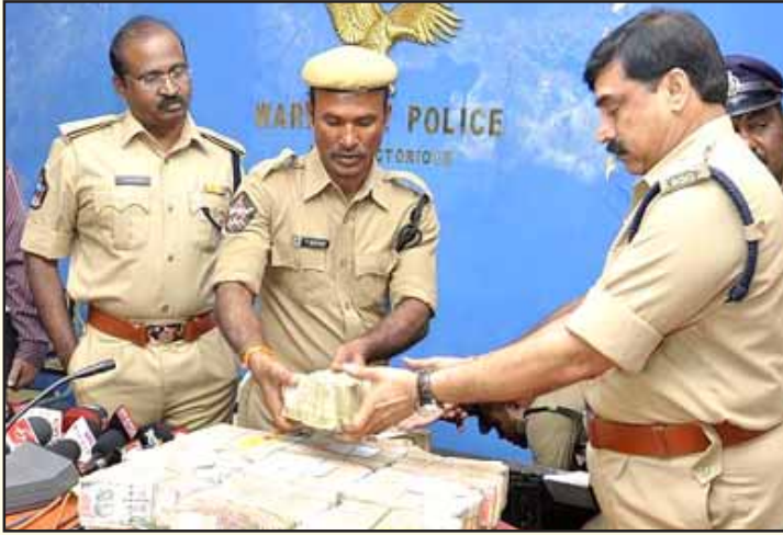
கடந்த நாடாளுமன்றத் தேர்தலின்பொழுது ஓட்டுக்களைப் பெறுவதற்காகப் பல்வேறு ஓட்டுக்கட்சிகளின் வேட்பாளர்கள் பதுக்கி வைத்திருந்த 1.95 கோடி ரூபாய் கைப்பற்றப்பட்டதாக அறிவித்தது. தேர்தல் கமிசன். தேர்தல் என்பது கருப்புப் பணத்திருவிழா என்பதன் சாட்சியம் இது.

கின்றன. சேஷன் இந்தியத் தேர்தல் தலைமை ஆணையாளராக இருந்த காலத்திலிருந்து இவ்வாறு தேர்தல் நடத்தை விதிகள் அமல்படுத்தப்பட்டு வருகின்றன. இதனை சேஷனின் விசேட திறமை, தேர்தலை நேர்மையாக நடத்த வேண்டும் என்ற அவரது இலட்சியம், அதாவது ஒருதனிநபரின் முன்முயற்சி என்ற கோணத்தில் பார்க்கக்கூடாது. மாறாக, ஆளும் வர்க்கம் மறுகாலனியாதிக்க கொள்கைகளுக்கேற்ப அரசு, தேர்தல் முறை ஆகியவற்றில் கொண்டு வந்துள்ள பொது மாற்றங்கள் என்று இதைப் பார்க்க வேண்டும்.