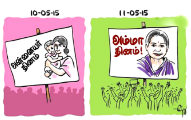
நமது எம்.ஜி.ஆர். நாளேட்டுக்குப் போட்டியாக, ஜெயலலிதா விடுதலை செய்யப்பட்டதைக் கொண்டாடிக் குதூகலிக்கும் தி இந்து கருத்துப்பட்டம்.

இத்தீர்ப்பைப் பற்றி இணையத்தின் வாயிலாகக் கருத்து கேட்டதில் பெரும்பான்மையினர் ஜெயாவை ஆதரிப்பதாகப் புள்ளிவிவர சதவீதக் கணக்குக் காட்டி சதிராடியும், ஜெயலலிதா மீண்டும் முதல்வராகப் பதவியேற்பதை நேரடி வர்ணனையுடன் ஒளிபரப்பு செய்தும் இந்த ஊடகங்கள்தமது விசுவாசத்தைப்பறை சாற்றின. அதிக முறை ஊழல் வழக்குகளில் தண்டிக்கப்பட்டு, பின்னர் நீதித்துறையை விலைக்கு வாங்கி விடுதலையாகி முதல்வராகியுள்ள ஜெயலலிதா, 5-வது முறையாக முதல்வராகப் பதவியேற்று கருணாநிதியைச் சமன் செய்துவிட்டார் என்று பூரித்துப் போகும் இந்த ஊடகங்கள், இந்துத்துவ அபாயத்திலிருந்து தமிழகத்தைக் காப்பாற்றியவர், காவிரி, முல்லைப் பெரியாறு மற்றும் ஈழப் பிரச்சினையில் மைய அரசைத் துணிவுடன் எதிர்த்து நின்றவர் என்றெல்லாம் வாதங்களை அடுக்கி, ஜெ சும்பலை வெட்கமின்றி ஆதரித்து நின்றன.