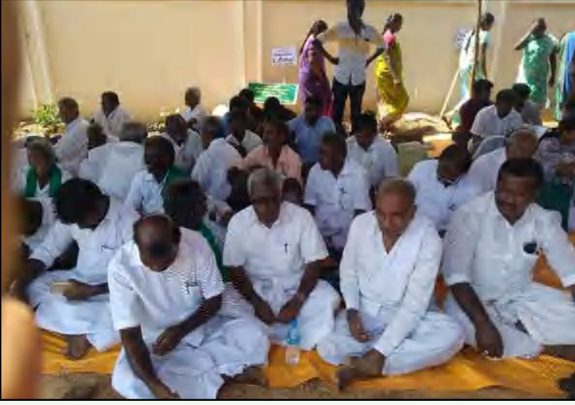
காவிரி உரிமை மீட்புக் குழுவின் தலைமையில் காவிரி மேலாண்மை வாரியத்தை உடனே அமைக்கக் கோரி தஞ்சையில் நடைபெற்று வரும் போராட்டம்.

குற்றவாளிக் கூண்டில் நிறுத்தும் இந்த ஆரிய பார்ப்பன யோக்கியர்கள், இதே அளவுகோலைத் தாங்கள் ஆளும் மாநிலங்களுக்கும் பொருத்துவார்களா? நாட்டிலேயே மிக அதிக அணைகளைக் கொண்ட மாநிலமான மகாராஷ்டிராதான் அடிக்கடி வறட்சியின் பிடியில் சிக்கிக் கொள்கிறது. நீர்த் தேக்கங்களை அமைப்பதில் மிகப் பெரும் ஊழலும் கொள்ளையும் அம்மாநிலத்திலும் நடந்திருக்கிறது. விவசாயிகளின் தற்கொலையில் இந்தியாவிலேயே முதலிடத்தில் உள்ள மாநிலமும் மகாராஷ்டிராதான். கடந்த இருபது ஆண்டுகளாக அந்த மாநிலத்தை மாற்றிமாற்றி ஆண்டுவரும் “தேசிய”க் கட்சிகளான காங்கிரசும் பா.ஜ.க.வும்தான் இந்தக் குற்றத் துக்குப் பொறுப்பேற்க வேண்டும்.