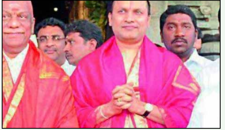
ஆர்.கே.நகர் தொகுதி வாக்காளர்களுக்குப் பணம் கொடுத்தபோது மத்திய ரிசர்வ் போலீசாரிடம் சிக்கிக் கொண்டவர்கள்.

விளம்பரச் சுவரொட்டிகளைக் கிழிப்பது, சுவருக்கு வெள்ளையடிப்பது என்பன போன்ற கெடுபிடி காமெடிகள் அப்போதிருந்து தான் அரங்கேறத் தொடங்கின. மக்களின் கருத்துரிமையையும் எளிது