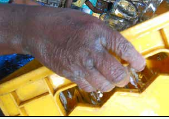
ஆசிட் கொண்டு பாட்டிலைக் கழுவி, கழுவிப் பொத்தாலாகிப் போன ஒரு பெண் தொழிலாளியின் கை.

“மனசு ஒப்பாமத்தான் இங்க வர்றோம். இன்னிக்கு கூலி வாங்கினா காய்கறி சந்தையில் கொழந்தைகளுக்கு ஒரு வாரத்துக்கு காய் ஆக்கிப் போட்டுடலாம். இந்த வேலை பாத்தும் குடும்பச் செலவுக்குப் பத்தலை. எக்ஸ்ட்ரா கூலி கிடைக்கும்னுட்டு, லாரில லோடு ஏத்தற வேலையும் செய்வோம். அது, ஆம்பளங்க செய்ற வேலைன்னு சொல்லுவாங்க. என்ன பன்றது?”