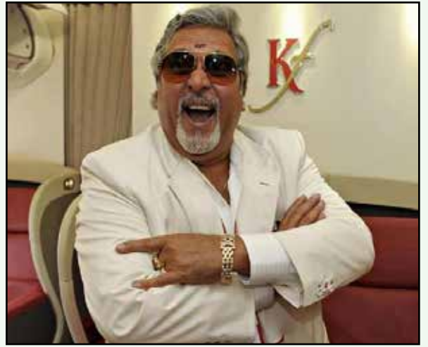
பொதுத்துறை வங்கிகளிடமிருந்து பெற்ற 9,000 கோடி ரூபாய் கடனைத் திருப்பிச் செலுத்தாமல் ஏப்பம் விட்டுவிட்டு, இலண்டனுக்குத் தப்பியோடிவிட்ட தரகு முதலாளி விஜய் மல்லையா. (கோப்பு படம்)

என்னை தன் ஆபீசுக்கு கூட்டிச்சென்ற பெண் அதிகாரி, “அய்யா உங்க கணக்கை வாராக் கடன் லிஸ்ட்டில் சேர்த்துட்டோம்னா, நீங்க நினைக்கிற மாதிரி உங்களுக்குச் சலுகை கிடைக்கும். ஆனால், உங்கள் பெயரை ‘பிரச்சனைக்கு உரியவர்’ என்று முத்திரை குத்தி கம்ப்யூட்டரில் போட்டுருவாங்க. அப்புறம் நீங்க தமிழ்நாட்டுல கூட்டுறவு பேங்குல கூட கடன்வாங்க முடியாது. பிள்ளைகளுக்கு கல்விக்கடனும் வாங்க முடியாது. நீங்க எங்க அப்பா மாதிரி இருக்கீங்க, அப்படின்றதால இதைச் சொல்றேன்.” என்றார்.