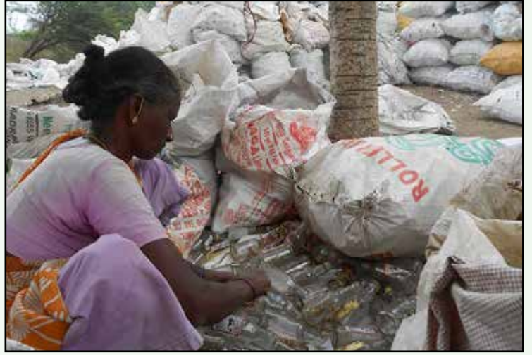
ஒரு மூட்டை பாட்டிலிருந்து மூடியைக் கழட்டுவதற்குக் கூலி ஏழு ரூபாய். கோணி ஊசியை வெச்சு கழற்றும்போது, அடிபட்டுக் கை பானமா பொளந்துக்கும். காயம் பட்ட அன்னிக்கு வேலையும் இல்லை, கூலியும் இல்லை.

“என்னைய போட்டோல்லாம் எடுத்து பேப்பர்ல போட்டறாதிங்க. எங்க டீச்சர் பார்த்தா திட்டும்” என்று சொல்லி விட்டு, வெள்ளந்தியாக சிரித்தார். “நாங்க பாட்டில் கழுவுற வேலையெல்லாம் செய்ய மாட்டோம். அக்காங்க, கழுவி வைச்சா கேஸ்ல அடுக்கி எண்ணி வைக்கற வேலைய செய்வோம். லீவு வந்தா, வாரம் 50, 100 சம்பாதிப்போம். எங்கம்மாக்கிட்ட கொடுத்து எங்களுக்கு”