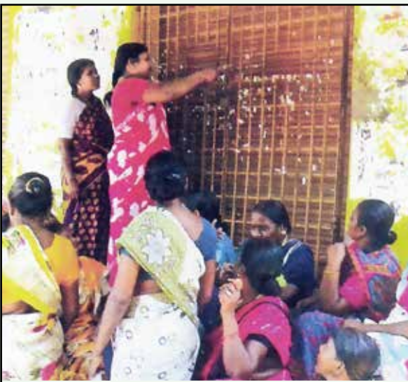
வேலூர் மாவட்டம்-அணைக்கட்டுக்கு அருகேயுள்ள அமைந்துள்ள டாஸ்மாக் கடையைப் பூட்டுப் போட்டு மூடும் பெண்கள்.