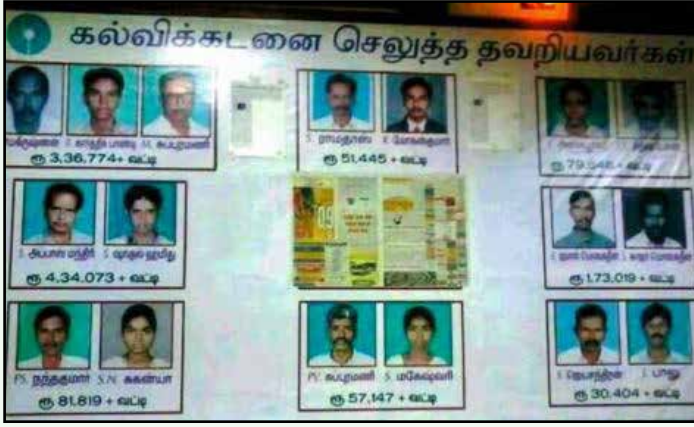
கல்விக்கடன் தவணையைக் கட்டாத தவறிய மாணவர்கள், அவர்களின் பெற்றோர்களின் புகைப்படங்களை வெளியிட்டு அவமானப்படுத்தியது, போடிநாயக்கனூர் ஸ்டேட் பாங்க். (கோப்புப் படம்)

மேனேஜர். ஒரு பார்வைக்கு சாதாரண வாத்தியார் மாதிரி தெரிந்ததால், உள்ளே நுழையும்போது இருந்த நடுக்கம் கொஞ்சம் குறைந்து மெதுவாக உட்கார்ந்தேன்.