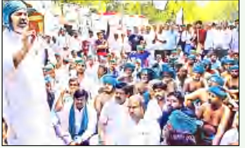
டெல்லி ஜந்தர் மந்தரில் நடைபெற்று வரும் தமிழக விவசாயிகளின் போராட்டத்தை ஆதரித்து உரையாற்றும் உ.பி. மாநிலத்தைச் சேர்ந்த விவசாய சங்கப் பிரதிநிதி.