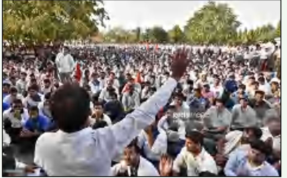
நீதிமன்றத் தீர்ப்பைக் கண்டித்து மாருதி தொழிலாளர்கள் மாணேசரில் நடத்திய ஆர்ப்பாட்டம்.

தாக்குதலுக்குப் பயன்படுத்தப்பட்ட ஆயுதங்களான பீம்களை, ஆலையிலிருந்து 20 கி.மீ. முதல் 70 கி.மீ. தொலைவில் உள்ள தொழிலாளிகளின் வீடுகளிலிருந்து கைப்பற்றியதாகக் கூறியது போலீசு. கொலைக்குப் பயன்படுத்திய ஆயுதத்தை 70 கி.மீ. தள்ளியிருக்கும் தமது வீட்டில் கொலைகாரன் பத்திரமாக வைத்திருந்ததாகவும், சுமார் ஒரு மாதம் கழித்து அதைக் கைப்பற்றி