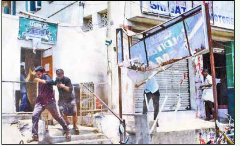
காஞ்சிபுரம் பேருந்து நிலையத்திற்கு அருகிலிருக்கும் டாஸ்மாக் கடையை அடித்து நொறுக்கும் பொதுமக்கள்.

புணர்வை ஏற்படுத்தும் வகையில் பத்திரிகையாளர் சஞ்சீவி குமார் எழுதிய “மெல்ல தமிழன் இனி...” என்ற தொடர் கட்டுரையை தி இந்து தமிழ் நாளேடு வெளியிட்டது. ஆனால் ஆங்கில தி இந்து நாளேடானது, தற்போதைய உச்ச நீதிமன்றத்தின் உத்தரவு உணர்ச்சி வேகத்தில் எடுக்கப்பட்டுள்ளது என்றும், இதனால் அரசுக்கு வருவாய் இழப்பும் சுற்றுலாவை நம்பியுள்ள சிறிய மாநிலங்களுக்குக் கரும் பாதிப்பு ஏற்படும் என்றும் தலையங்கமே எழுதுகிறது. ஓட்டுக் கட்சிகளின் சந்தர்ப்பவாதத்தை விட, இரட்டை நாக்குடன் பேசும் இந்து நாளேட்டின் ஊடக சந்தர்ப்பவாதம் மிகக் கேவலமானதாக இருக்கிறது.