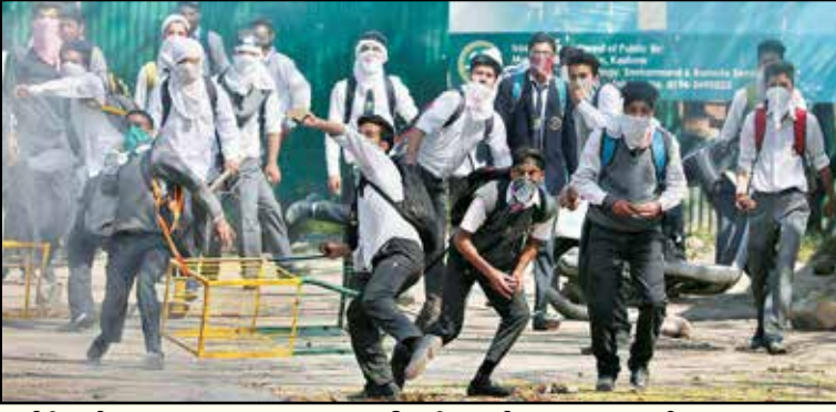
சிறீநகரில் அரசுப் படைகளைக் கல்லெறிந்து விரட்டும் கல்லூரி மாணவர்கள்.

90 சதவீதத்துக்கும் மேலான வாக்காளர்களால் புறக்கணிக்கப்பட்ட சிறீநகர் இடைத்தேர்தல் முடிவும் கூட, அம்மாநிலத்தை ஆளும் பா.ஜ.க.-பி.டி.பி. கூட்டணிக்கு எதிரானதாகவே அமைந்தது. அத்தேர்தலில் காங்கிரசு-தேசிய மாநாட்டுக் கட்சி கூட்டணி வேட்பாளரான பரூக் அப்துல்லா வெற்றி பெற்றார். ஆனந்த்நாக் இடைத்தேர்தலில் இதைவிடத் தீவிரமான எதிர்ப்பையும், தோல்வியையும் ஆளுங்கூட்டணி சந்திக்க வேண்டியிருக்கும் என்ற நிலையில், மோடியின் கௌரவத்தைக் காப்பாற்றுவதற்காக இடைத்தேர்தலையே காலவரையின்றி ஒத்திவைத்துவிட்டது, இந்தியத் தேர்தல் ஆணையம்.