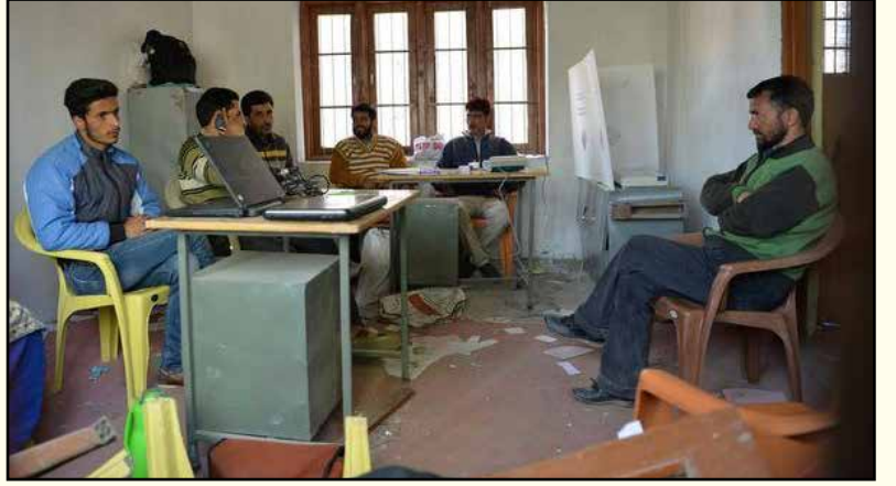
சிறீநகர் நாடாளுமன்றத் தொகுதிக்கு நடந்த இடைத்தேர்தலின்போது, ஓட்டுப்போட ஒருவர்கூட வராமல் வெறிச்சோடிப் போன ஒரு வாக்குச்சாவடி.

இந்திய இராணுவத்தின் கீழ்த்தரமான அடக்குமுறைகளுக்கு எதிராகவும், சுயநிர்ணய உரிமை உள்ளிட்ட ஜனநாயக, குடியரிமைகளுக்காகவும் போராடிவரும் காஷ்மீர் முசுலீம்களைத் தீவிரவாதிகள், பயங்கரவாதிகள், பாகிஸ்தான் கைக்கூலிகள், மத அடிப்படையானவாதிகள் எனப் பலவாறாக அவதூறு செய்து கொள்