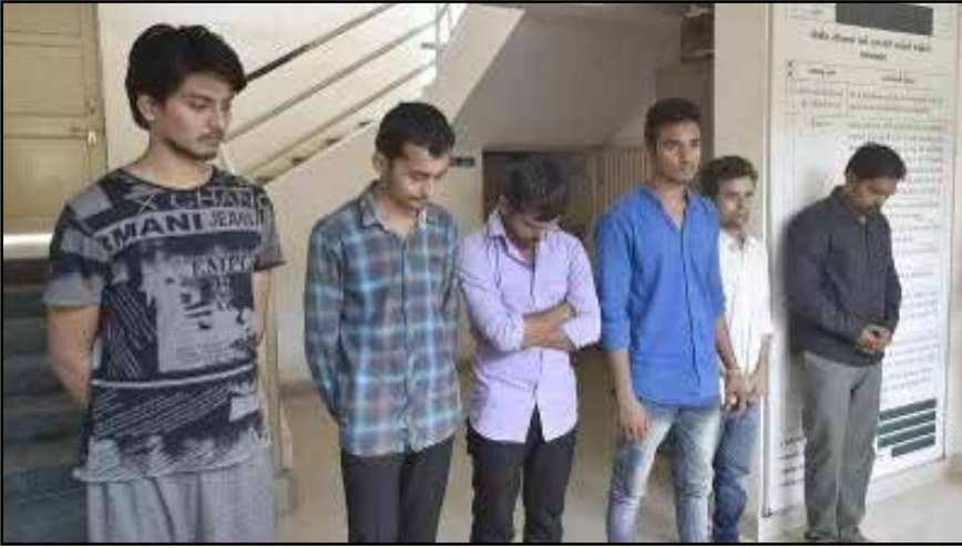
குஜராத் மாநிலத்தில் நூற்றுக்கும் மேற்பட்ட போலி ஆதார் கார்டுகளைத் தயாரித்த குற்றத்துக்காக கைது செய்யப்பட்டவர்கள்.

(predictive intelligence) புகுத்தும் முனைப்புடன் அரசு செயல்பட்டு வருகின்றது.