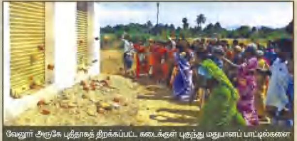
வேலூர் அருகே புதிதாகத் திறக்கப்பட்ட கடைக்குள் புதுந்து மதுபானப் பாட்டில்களை அடித்து நொறுக்கிய பிறகும், அக்கலையைத் திறக்க அதிகார வர்க்கம் முயற்சி செய்வதைப்பற்றி, அக்கலையை கற்களைக் கொண்டு தாக்கும் பெண்கள்.