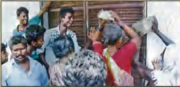
திருவண்ணாமலை அருகே டாஸ்மாக் கலையை மூடக் கோரி முற்றுசெய்யப்பட்டதோடு, அக்கலையின் இரும்புக் கதவுகளைக் கற்களைக் கொண்டு தாக்கி நொறுக்க முயலும் பெண்கள்.