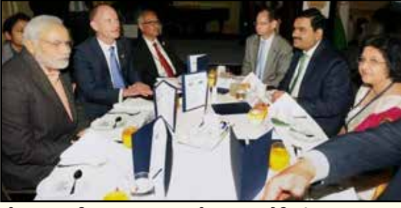
பிரதமரர், புரோக்கரர்? - அதானிக்கு ஆஸ்திரேலிய சுரங்கத்தை முடித்துக் கொடுப்பது தொடர்பாக ஆஸ்திரேலிய நாட்டு அதிகாரிகளுடன் பேச்சுவார்த்தை நடத்தும் நரேந்திர மோடி. (கோப்புப் படம்)

கில் கொண்டு, அப்பகுதி மக்கள் எதிர்ப்பு தெரிவித்த போதிலும், எதிர்ப்புகளையெல்லாம் மீறி இச்சுரங்கத்தைத் தொடங்கிவிடத் துடிக்கிறார் அதானி.