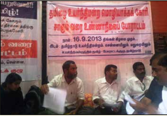
தமிழை, சென்னை உயர்நீதி மன்றத்தின் வழக்காடு மொழியாக அங்கீகரிக்கக் கோரி உயர்நீதி மன்ற வழக்குரைஞர்கள் நீதிமன்ற வளாகத்தினுள் நடத்திய போராட்டம். (கோப்புப் படம்)

இரண்டாம், மூன்றாம் நிலைக்குத் தள்ளக்கூடிய இப்பரிந்துரைகளைத் தமிழகத்தின் மீது திணித்துவிட முயற்சிக்கிறது, மோடி அரசு. தமிழகத்தின் பள்ளிக் கல்வியில் தமிழ் மொழி ஏற்கெனவே இரண்டாம் நிலைக்குத் தள்ளப்பட்டுள்ள நிலையில், தமிழை ஒரு மொழிப்பாடமாகக்கூடப் படிக்காமல் உயர் கல்வியை முடித்து விடக் கூடிய அவலமான நிலை தமிழகத்தில் நிலவிவரும் நிலையில், மோடி அரசு அளித்துள்ள பரிந்துரைகள் எதிர்காலத்தில் தமிழுக்குப் பெருங்கேட்டிணையே ஏற்படுத்தும்.