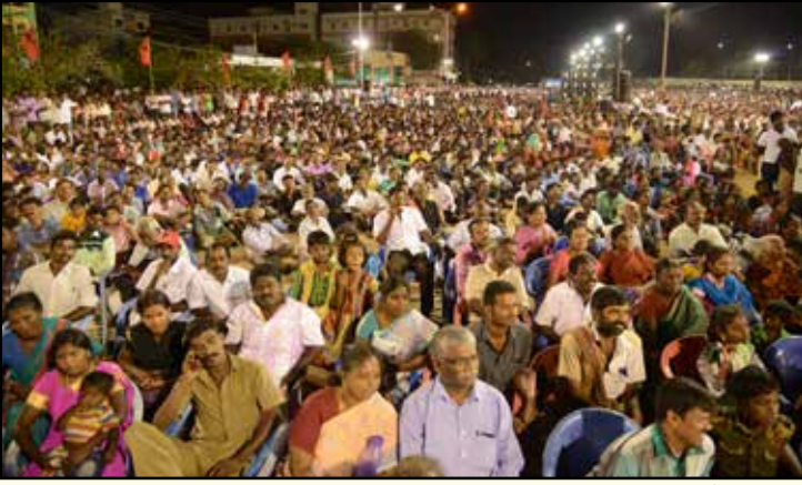
“மூடு டாஸ்மாக்கை!” என்ற முழக்கத்தை முன்வைத்து மக்கள் அதிகாரம் அமைப்பு திருச்சியில் நடத்திய சிறப்பு மாநாட்டில் திரண்ட மக்கள் திரளின் ஒரு பகுதி. (கோப்புப் படம்)

தான் பார்த்தது. அரசை முடக்கியிருப்பது, நீதிமன்றத்தின் அதிகாரம் அல்ல, மக்களின் அதிகாரம்! கடப்பாரையும் துடைப்பமும் ஏந்திய பெண்கள்! “மக்கள் எதிர்ப்பு காட்டும் இடங்களில் நாங்கள் கடை திறக்க முயற்சிக்க மாட்டோம்” என்று உயர் நீதிமன்றத்தில் வாக்குறுதி அளிக்கிறார் அரசு வழக்கறிஞர். இது மக்கள் எதிர்ப்பைச் சமாளிக்க முடியாத நிலையில் போடப்படும் யோக்கிய வேடமல்லவா?