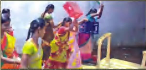
திருப்பூர் முதலியானையும் பகுதியில் நடந்தவற்றை டாஸ்மாக் கலையை மூடக்கோரி போராடியதோடு பாருக்குள் புதுந்து மதுபான புடிக்களை அள்ளிவந்து சாலையில் போட்டு உடைக்கும் பெண்களின் ஆவேசம்.