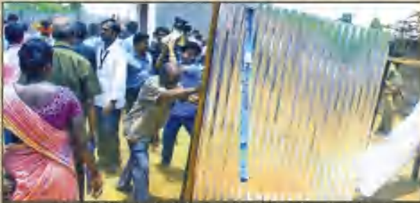
மதுரையில் கல்லூரிக்கு அருகே திறப்புத்தகாகக் கட்டப்பட்டிருந்த டாஸ்மாக் வெட்டை, பொதுமக்களும் மாணவர்களும் இணைந்து அடித்து நொறுக்கி அப்புறப்படுத்தியின்றனர்.