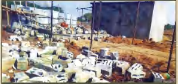
அரியலூரில் புதிதாக கட்டப்பட்டு வந்த டாஸ்மாக் பார் இடித்துத் தரைமட்டமாக்கப்பட்ட காட்சி.