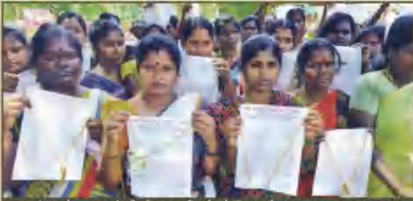
டாஸ்மாக் கடைகள் திறப்பதை நிறுத்தக் கோரும் மனுவை சாதாரணமாக அளிப்பதற்குப் பதிலாக, அதிகார வர்க்கத்தின் புத்திக்கு உரைக்கும் விதத்தில் மனுவோடு தாலி, பூவையும் சேர்த்துக் கொண்டுவந்த காஞ்சிபுரத்தைச் சேர்ந்த பெண்கள். (வலது) செங்கல்பட்டில் பெண்களின் சாலை மறியல் போர்.