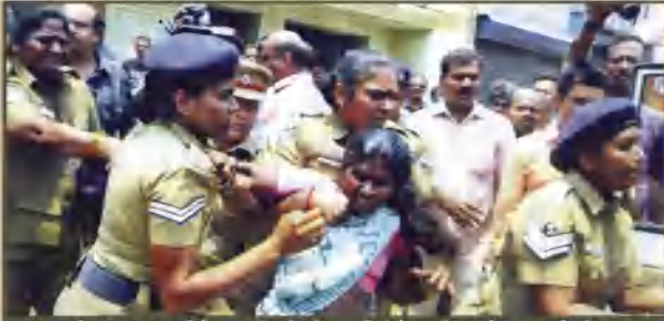
சேலம்-பெரமனூரில் குடியிருப்புப் பகுதியில் டாஸ்மாக் கடை திறப்பதை எதிர்த்துப் போராடிய பெண்களைத் தாக்கி, கைது செய்யும் போலீசு.