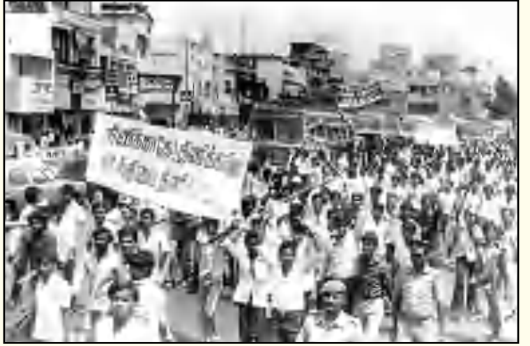
இந்தித் திணிப்பை எதிர்த்து தமிழக மாணவர்களும் இளைஞர்களும் நடத்திய மொழிப் போர். (கோப்புப் படம்)

இவை தவிர, மைய அரசின் ரயில்வே துறை, விமான போக்குவரத்துத் துறை, வெளியுறவுத் துறை ஆகியவற்றில் இந்திப் பயன்படுத்தப்படுவதை அதிக