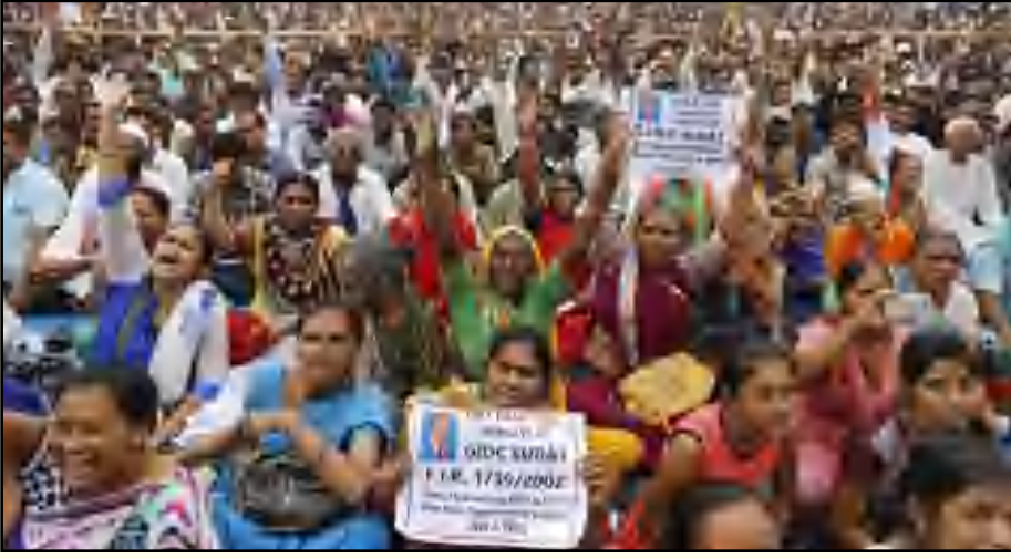
பசு பாதுகாப்பு என்ற பெயரில் இந்து மதவெறிக் கும்பல் ஊனாவைச் சேர்ந்த தாழ்த்தப்பட்டோரைத் தாக்கியதைக் கண்டித்து ஊனாவில் தாழ்த்தப்பட்ட அமைப்புகள் நடத்திய கண்டன ஆர்ப்பாட்டம். (கோப்புப் படம்)

படி ஒரு அனுமதிச்சீட்டு பற்றி நான் கேள்விப்பட்டதே இல்லை என்று ஜெய்ப்பூர் ஆர்.டி.ஓ. பஸ்தேவ்ராம் போஜக் கூறியதாகப் பத்திரிகையாளர்கள் அம்பலப் படுத்தியிருக்கின்றனர். (Anand kochukudy, thewire.in, 14.4.2017)