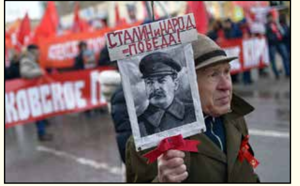
சோசலிசம் வீழ்த்தப்பட்ட ரசியாவில் மீண்டும் "கம்யூனிச பூதம்!"