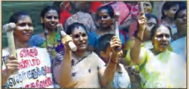
சென்னை-தண்டையார்பேட்டையில் சேனியம்மன் கோவில் தெருவில் உள்ள டாஸ்மாக் கலையை அடித்து நொறுக்க கத்தியலுடன் திரண்ட பெண்கள்.