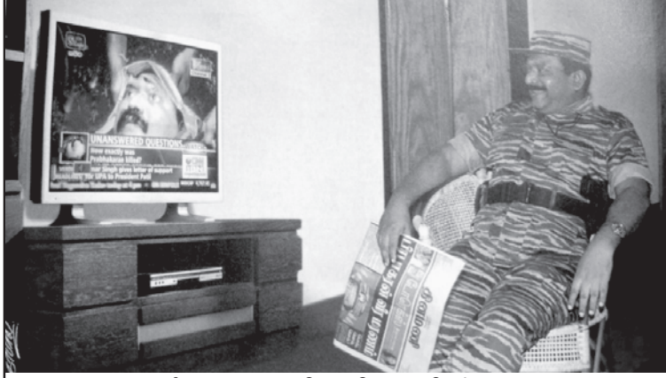
நக்கீரன் அட்டை - பொய்யென்று தெரிந்தாலும் அதையே புலி ஆதரவாளர்கள் நம்ப விரும்பினார்கள்.

கஸ்பரும் கனிமொழியும் புலித்தலைவர்களைக் காப்பாற்ற வேண்டும் என்ற நல்லெண்ணத்தால் உந்தப்பட்டே இந்த முயற்சியில் இறங்கியிருக்கக்கூடும். கருணாநிதியை அவமதித்த புலிகள், ராஜீவ் கொலை மூலம் தி.மு.க.வினரை அடிவாங்க வைத்து விட்டு, தற்போது தேர்தலில்