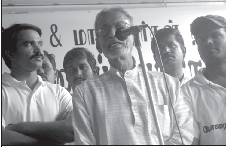
முள்ளிவாய்க்கால் படுகொலை: இரத்தத்தில் 'கை கழுவிவர்கள்'!

இந்தக் கேள்விகள் எதையும் புலி ஆதரவாளர்கள் இவர்களைக் கேட்க