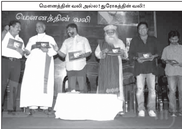
மெளனத்தின் வலி அல்ல! துரோகத்தின் வலி!

புலி ஆதரவாளர்களின் மனோநிலை கொஞ்சம் விசித்திரமானதுதான். ‘ஏசு கிறிஸ்து வின் கடைசி ஆசை’ என்ற திரைப்படத்தில் வரும் ஒரு காட்சியை அது நினைவூட்டுகின்றது. சிலுவையில் அறையப்பட்டு அரையாய்க் நிலையில் கனவு காணும் ஏசு, தான் சிலுவையிலிருந்து தப்பி காதலியை மணந்து குடும்பம்