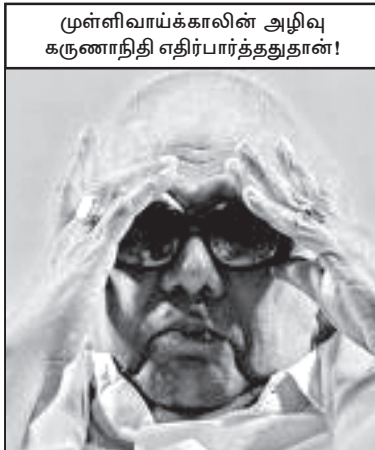
முள்ளிவாய்க்காலின் அழிவு கருணாநிதி எதிர்பார்த்ததுதான்!

குண்டு வீச்சின் இரைச்சலுக்கும், மக் களின் ஓலத்துக்கும் இடையே, ரத்தமும்