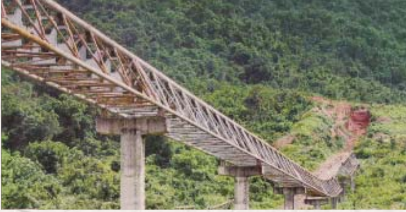
வேதாந்தா நிறுவனம் ஓரிசாவின் லாஞ்சிகர் வனப்பகுதியில் எவ்வித முன் அனுமதியும் பெறாமல், பாக்கைத் தாதுவை எடுத்துச் செல்வதற்காகக் கட்டியுள்ள “கன்வேயர் பெல்ட்”.

மூடி மறைக்க முடியாத அளவிற்கு வேதாந்தாவின் மோசடிகளும், காங்கிரசு அரசின் முறைகேடுகளும் அம்பலமாகிவிட்டன. வேதாந்தாவுக்கு ஆதரவாகத் தீர்ப்பு வழங்கிய உச்ச நீதிமன்ற நீதிபதிகளின் யோக்கியதையே சந்தி சிரித்துக் கொண்டிருக்கிறது. போதாக்குறைக்கு வேதாந்தா நிறுவனம் ‘கேய்ன்ஸ்’ என்னும் எரிசக்தித் துறை பன்னாட்டு நிறுவனத்தை வாங்கி, இந்தியாவின் எரிசக்தித் துறையையே தனது ஏகபோகத்தின் கீழ் கொண்டுவர விரும்பும் முகேஷ் அம்பானியோடு உரசி யிருப்பதால், காங்கிரசு அமைச்சரவையில் நிறைந்திருக்கும் அம்பானி பக்தர்களுக்கும் நியம்கிரியின் பழங்குடி மக்கள் மீது அபிமானம் பிறந்து விட்டது. அனைத்துக்கும் மேலாக, பன்னாட்டு நிறுவனங்கள் மற்றும் தரகு முதலாளிகளுக்காக சிதம்பரம் நடத்திவரும் காட்டு வேட்டை, பழங்குடி மக்களை மென்மேலும் மாவோயிஸ்டுகளின் பக்கம் தள்ளிவிடுமோ என்ற அச்சமும் ஆளும் வர்க்கத்தைப் பிடித்தாட்டுகிறது.