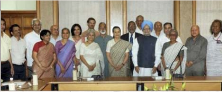
உணவுப் பாதுகாப்புச் சட்டத்தை உருவாக்கி வரும் தேசிய ஆலோசனை கவுன்சில் உறுப்பினர்களுடன் சோனியாவும் மன்மோகன் சிங்கும்: காங்கிரசின் இரட்டை வேடம்.

ஒழித்துக் கட்ட வேண்டும்; அல்லது அவற்றின் எண்ணிக்கையைக் கணிசமாகக் குறைக்கும் வண்ணம் வருமான வரம்பு நிர்ணயிக்க வேண்டும்” என்ற ஆலோசனையும் வழங்கப்பட்டுள்ளது. வெளித் தோற்றத்தில் பட்டினி கிடக்கும் ஏழைகளுக்கு ஆதரவாகப் பேசுவது போலத் தெரியும் இந்த உத்தரவு, உண்மையில் உணவு வழங்கல் கொள்கையில் உலக வங்கியின் கட்டளைகளை விரைவாக நடைமுறைக்குக் கொண்டு வரவேண்டும் என்ற கண்ணோட்டத்தின் அடிப்படையில்தான் வழங்கப்பட்டுள்ளது என்பதற்கு இந்த ஆலோசனையே சாட்சி. உச்ச நீதிமன்றத்தின் உத்தரவிலுள்ள இந்த ஆலோசனையை டாக்டர் மன்மோகன் சிங் புறக்கணிக்க மாட்டார் என்று அடித்துக் கூறலாம்.