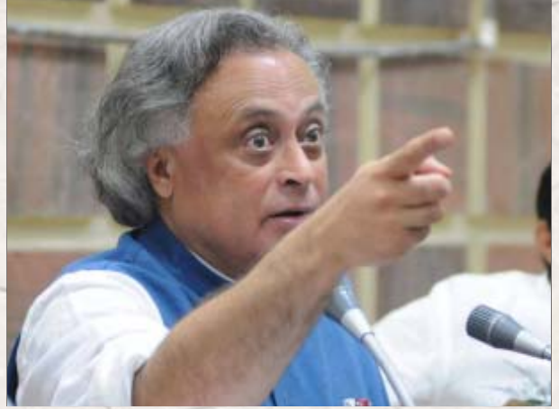
வேதாந்தா பாக்கைட்டை வெட்டி எடுப்பதற்குத் திடீர்த் தடை விதித்துள்ள சுற்றுப்புறச் சூழல் அமைச்சர் ஜெய்ராம் ரமேஷ்.

வேதாந்தாவுக்கு எதிரான வழக்கில் ஒரு மனுதாரராக சேர்ந்துகொள்வதற்குக் கூட அந்த மண்ணின் மைந்தர்களான பழங்குடியினருக்கு எவ்வித உரிமையும் இல்லை என்று கூறி பழங்குடி மக்களை அந்த வழக்கிலிருந்தே வெளியேற்றினார் உச்ச நீதிமன்றத்தின் தலைமை நீதிபதி கே.ஜி.பாலகிருஷ்ணன். அப்போது பழங்குடி மக்களின் பாரம்பரிய வாழ்விட உரிமை அரசியல் சட்டத்திலிருந்து எங்கே காணாமல் போயிருந்தது? இந்த வழக்கை விசாரித்த உச்ச நீதிமன்ற நீதிபதி கபாடியா, நியம்கிரியின் கோண்டு இன மக்களை, புல்லைத் தின்னும் பழங்குடிகள் என்று திமிர்த்தனமாக ஒரு கூட்டத்தில் பேசியபோதும், “நான் ஸ்டெர்லைட் நிறுவனத்தின் பங்குதாரர்” என்று நீதிமன்றத்தில் பகிரவ்