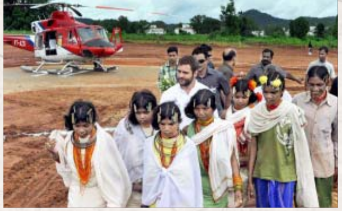
வேதாந்தா நிறுவனத்தின் பாக்கைட் சுரங்கத்திற்குத் தடை விதிக்கப்பட்ட பின், கோந்த இன மக்கள் வசிக்கும் பகுதிக்குத் திடீர் விஜயம் செய்த ராகுல் காந்தி.

கும் மூத்த சிப்பாய் மன்மோகன் சிங், “சுற்றுச் சூழல் சுற்றுச்சூழல் என்று பேசிக்கொண்டு, வறுமை ஒழிப்பு இலட்சியத்தை நாம் கைவிட்டு விட முடியாது” என்கிறார். வறுமையை ஒழிக்க வேண்டுமென்றால் பழங்குடி மக்களின் காடுகளையும் நிலங்களையும் பிடுங்கி பன்னாட்டு நிறுவனங்கள்-தரகு முதலாளிகளிடம் ஒப்படைக்க வேண்டும் என்பது மூத்த சிப்பாயின் கொள்கை. மூத்த சிப்பாய் பேசுவதைப் பற்றி இளைய சிப்பாய் பேச மறுக்கிறார்.