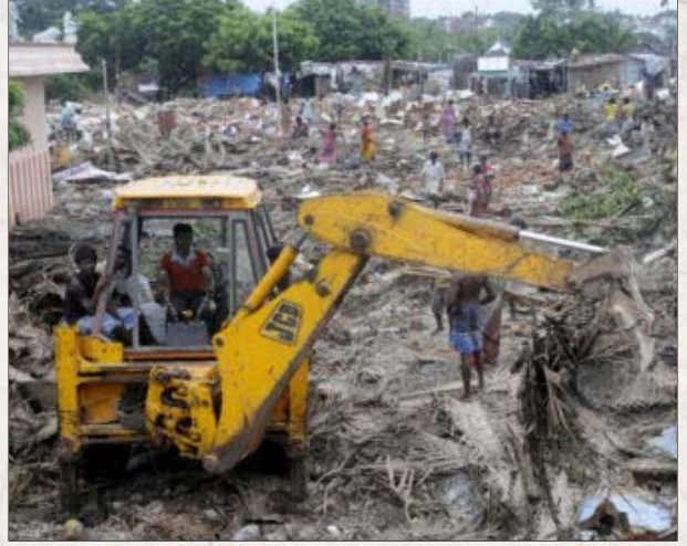
சென்னையில் அமைக்கப்பட்டு வரும் மெட்ரோ ரயில் திட்டத்திற்காக, சைதாப்பேட்டையில் அடையாறு கரையோரமிருந்த குடிசைகள் இடித்துத் தள்ளப்படுகின்றன.

“அரசு நிர்வாகத்தின் செயல்திறனை இவ்வாறு அதிகரிக்க வேண்டுமானால், அரசு நிர்வாகப் பணிகளில் அவுட் சோர்சிங் முறையை அறிமுகப்படுத்த வேண்டும். அரசு நிர்வாகத்தில் மட்டுமின்றி, கல்வி, சுகாதாரம் போன்ற துறைகளிலும், உள்கட்டுமானத் துறையிலும் தனியார் துறையுடன் கூட்டு அமைத்துக் கொண்டால் மட்டுமே இந்தக் கட்டுமானங்களை உருவாக்குவதற்கான மூலதனத்தை அரசாங்கத்தால் பெறமுடியும்” என்றும் வலியுறுத்துகிறது, அந்த அறிக்கை.