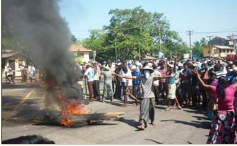
எரிபொருள் விலை உயர்வைக் கண்டித்து, வடமேற்கு மாகாணத்திலுள்ள சிலா என்ற கடற்கரை கிராமத்தைச் சேர்ந்த மீனவர்கள் ராஜபக்சே அரசுக்கு எதிராக நடத்திய போராட்டத்தின் மீது நடத்தப்பட்ட துப்பாக்கிச் சூட்டில் ஒருவர் கொல்லப்பட்டார்; எட்டு பேர் படுகாயமுற்றனர். (கோப்புப்படம்)

தமிழினவாதிகளின் பார்வையில் ஈழ இனச் சிக்கலுக்கு தமிழீழத் தனியரசு என்பது ஒரே தீர்வு என்பது மட்டுமல்ல; தமிழகத் தமிழினவாதிகளுக்கு ஈழ இனச் சிக்கல் ஒன்று மட்டுமே விவாதத்துக்கும் வினையாற்றுவதற்குமான ஒரே பிரச்சினை. இந்த நாட்டைச் செயற்களமாகக் கொண்டுள்ள ம.க.இ.க.வினர்தம்முள் உள்ள எல்லாப் பிரச்சினைகளில் ஈழ இனச் சிக்கலுக்கு அதற்குரிய முன்னுரிமை தருகின்றனர். இந்த உண்மையை அறிந்திருந்தும், ம.க.இ.க.வினர் ஈழத் தமிழருக்கு எதிரானவர்கள், அவர்களுக்கு ஈழத்தமிழர் மீது அக்கறையில்லை, அதனால்தான் தமிழீழத் தனியரசு கோரிக்கைக்காக ம.க.இ.க.வினர் போராட மறுக்கிறார்கள் என்று அவதூறு செய்கிறார்கள்.