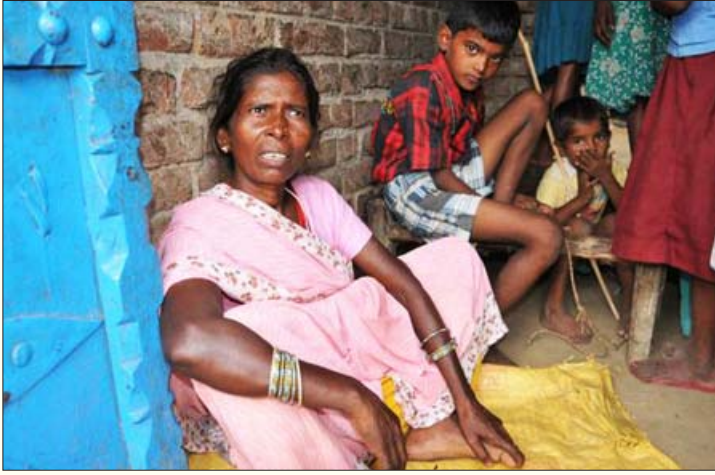
“தீர்ப்புக்குப் பின்னர் சாதிவெறியர்கள் மீண்டும் தாக்குதல் நடத்தலாம் என்ற அச்சம் எங்களைப் பிடித்தாட்டுகிறது. நாங்கள் எல்லா நம்பிக்கைகளையும் இழந்து நிற்கிறோம்” என்று கூறும் தாழ்த்தப்பட்ட மூதாட்டி.

வதற்குக் காரணம், அவர்கள் நக்சல் பாரிகளைப் பெற்றெடுத்துவிடுவார்கள் என்பதால்தான்” என்று ரன்வீர் சேனா பகிரங்கமாகவே கொக்கரித்தது.