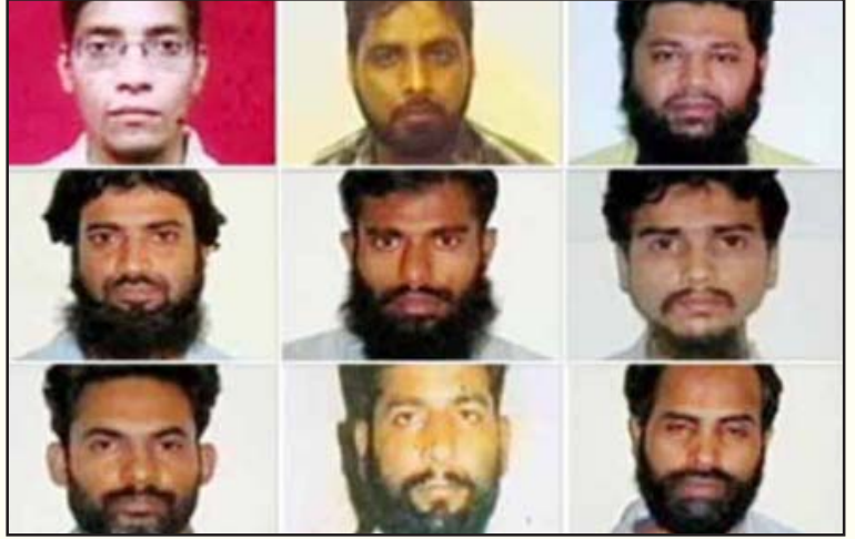
மாலேகான் குண்டுவெடிப்பு வழக்கில் மோசடியாகச் சிக்கவைக்கப்பட்டு, ஐந்தாண்டு சிறைவாசம் அனுபவித்த அப்பாவி முசலீம்கள்.