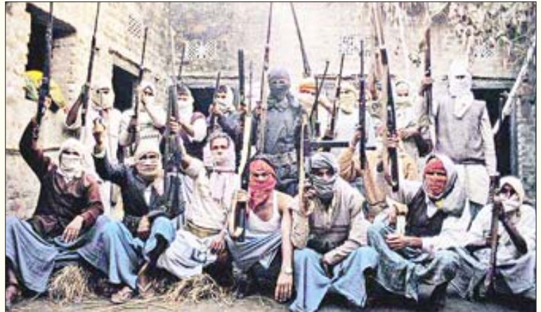
பூமிகார் நிலப்பிரபுக்களின் ஆதிக்க சாதி கொலைகார குண்டர்படையான ரன்வீர் சேனா. (கோப்புப் படம்)

“இத்தீர்ப்பையடுத்து ஆதிக்க சாதிவெறியர்கள் இனிப்புக்ள் வழங்கி, பட்டாசு வெடித்து ஆனந்தக் கூத்தாடுகின்றனர். ‘உங்கள் வீட்டைக் கொளுத்தினாலும், உங்களைக் கொன்றாலும் எங்களை யாராலும் எதுவும் செய்ய முடியாது பார்த்தீர்களா’ என்று எங்களிடம் எகத்தாளம் செய்கின்றனர். இந்த வெற்றியைக் கொண்டாடும் வகையில் அவர்கள் எங்கள் மீது மீண்டும் தாக்குதல் நடத்தலாம்