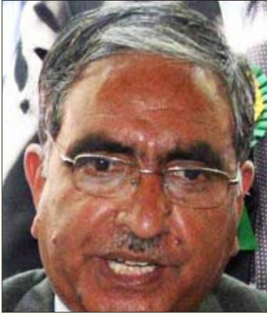
ஓமர் அப்துல்லா அரசைக் கவிழ்ப்பதற்காக இராணுவத்திடமிருந்து 1.19 கோடி ரூபாய் இலஞ்சமாகப் பெற்றதாகக் குற்றஞ்சமத்தப்பட்டுள்ள காஷ்மீர் மாநில அமைச்சர் குலாம் ஹசன் மிர்.