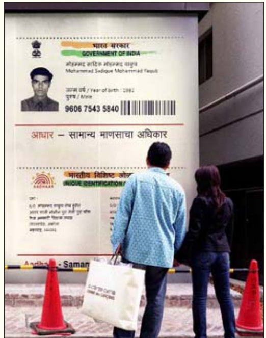
ஆதார் குறித்த மயக்கம்: படித்தவர்களும் பாமரர்களே!

இந்த வங்கிகள் கிராமங்களில் தனது கிளைகளைத் திறக்காமல், வணிக முகவர்கள் (Business correspondents) எனப்படுவோரை நியமித்து, அவர்களிடம் அட்டைகளை “ல்வைப்” செய்வதற்கான கருவிகளையும் குறிப்பிட்ட அளவு பணத்தையும் அளித்து, அவர்களையே நடமாடும் வங்கிகளாகப் பயன்படுத்தத் திட்டமிட்டுள்ளனர். இத்திட்டத்தின் கீழ் சுமார் 70,000 பேர் நியமிக்கப்பட்டிருக்கின்றனர். கிராமங்களில் உள்ள மகளிர் சுய உதவிக் குழுக்கள், கூட்டுறவுச் சங்கங்கள், அஞ்சலகங்கள் போன்ற அமைப்புகளையும்