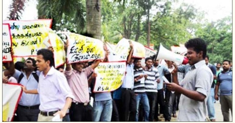
யாழ் பல்கலைக்கழக மாணவர்கள் மீது சிங்கள இராணுவம் நடத்திய தாக்குதலைக் கண்டித்து கண்டியிலுள்ள பேராதனை பல்கலைக்கழக மாணவர்கள் நடத்திய ஆர்ப்பாட்டம்: இனம் கடந்த ஒற்றுமையின் அடையாளம் (கோப்புப் படம்)

அதேசமயம், தமிழினவாதிகள்தாம் இந்தியாவின் தேசிய இனச் சிக்கலில் போலி கம்யூனிஸ்டுகளின் நிலைப்பாடுகளுக்கு இணையான நிலைப்பாடுகளை எடுக்கின்றனர். வடகிழக்கு இந்தியாவிலும் காசுமீரத்திலும் தன்னுரிமை கோரும் போராட்டங்களை ஆதரிக்காதது மட்டுமல்ல, அவை அவசியமற்றவை என்று கூட பல சமயங்களில் எதிர்க்கவும் செய்கின்றனர். சி.பி.ஐ. கட்சியின் அதிகாரபூர்வ நிலைப்பாடு ஈழ விடுலைக்கு எதிரானது என்று தமிழினவாதிகளுக்குத் தெரியும்; இருந்தாலும், ஜெயலலிதாவின் அடிவருடியான தா.பாண்டியன் அவரது அருளைப் பெறுவதற்காகவே ஈழ ஆதரவு