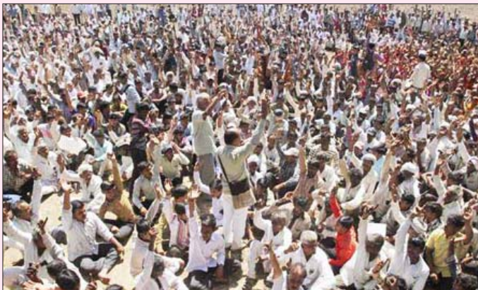
குஜராத்தில் நிறுவப்படவுள்ள அணு உலைத் திட்டத்துக்கு எதிராக கிராம மக்கள் நடத்தும் ஆர்ப்பாட்டம்.

குஜராத் மாநிலம் பாவ்நகர் மாவட்டத்திலுள்ள மிதி விர்தி கிராமத்தில் “வெஸ்டிங் ஹவுஸ் கார்ப்பரேசன்” என்ற அமெரிக்க நிறுவனம், 60 ஆயிரம் கோடி ரூபாய் மதிப்பில் 6000 மெகா வாட் மின்னுற்பத்தித் திறனுள்ள அணு உலைகளைக் கட்டவிருக்கிறது. இப்பேரழிவுத் திட்டத்தை எதிர்த்து அப்பகுதியிலுள்ள 40-க்கும் மேற்பட்ட கிராமங்களைச் சேர்ந்த விவசாயிகள் தொடர்ந்து போராடி வருகின்றனர்.