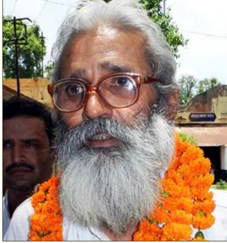
லஷ்மண்பூர்-பதே கொலை வெறியாட்டத்தை வழிநடத்திய ரன்வீன் சேனா குண்டர்படையின் தலைவன் பிரம்மேஷ்வர் சிங். (கோப்பு படம்)