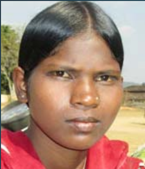
சிகாய் மந்தாவி 21

அமெரிக்காவிற்கு அடிமைகளாகக் கடத்தி வரப்பட்ட ஆப்பிரிக்க கருப்பின மக்கள் நவீன அமெரிக்காவை உருவாக்கியதைப் போல, இன்று இந்தியாவின் பல்வேறு நகரங்களில் அடிக்கட்டுமான வசதிகளை உருவாக்குபவர்கள் ஓரிசா, பீகார், சத்தீஸ்கர் போன்ற 'வளர்ச்சி'யற்ற மாநிலங்களிலிருந்து வெளியேறியும் தொழிலாளர்கள் தான். இந்தியாவில் நடைமுறைப்படுத்தப்படும் தனியார் மயம் - தாராளமயம் நாடெங்கும் ஏற்றத்தாழ்வான வளர்ச்சியைத்தான் உருவாக்கியிருக்கிறது. இந்த ஏற்றத்தாழ்வான வளர்ச்சிதான் தொழிலாளர்களை அகதிகளாகச் சிதறடிக்கிறது. முதலாளித்துவத்தின் கொடிய சுரண்டலுக்கு இந்த ஏற்றத்தாழ்வான வளர்ச்சி அவசியமான ஒன்றாகும். எனவே, சத்தீஸ்கரைச் சேர்ந்த பழங்