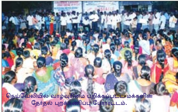
நெய்வேலியில் வாழ்வுரிமை பறிக்கப்பட்ட மக்களின் தேர்தல் புறக்கணிப்பு போராட்டம்.

புதுச்சேரியில் அதிகார வர்க்கமும் போலீசும் மேற்கொண்ட அடாவடி, அச்சுறுத்தல்களை முறியடித்து 15.4.2014 அன்று பு.ஜ.தொ.மு. தோழர்கள் செஞ்சட்டையுடன் செங்கொடி ஏந்தி முழக்கமிட்ட படியே இரு சக்கர வாகனப் பிரச்சாரத்தை மேற்கொண்டு, கிராமங்களில் தேர்தல் புறக்கணிப்பு தெருமுனைக் கூட்டங்களை நடத்தினர். காஞ்சிபுரம் அருகே வெண்பாக்கத்தில் உள்ள ஆக்சில் இந்தியா தொழிலாளர் சங்கத்தின் சார்பிலும், திருப்பெரும்புதூர் பேருந்து நிலையம் அருகேயும் பு.ஜ.தொ.மு. தெருமுனைக் கூட்டங்களை நடத்தியது. திருவள்ளூர் மாவட்ட பு.ஜ.தொ.மு. சார்பில் கும்மிடிப்பூண்டியில் விண்ணதிரும் முழக்கங்களுடன் நடந்த சைக்கிள் பேரணியும் தெருமுனைக் கூட்டங்களும் உழைக்கும் மக்களிடம் பெருந்த வரவேற்பைப் பெற்றன. ஓசூரில் ஏப்ரல் 22 அன்று லெனின் பிறந்த நாள் விழாவை தேர்தல் புறக்கணிப்பு பிரச்சார இயக்கமாக மேற்கொண்ட பு.ஜ.தொ.மு. பல இடங்களில் ஆலை வாயில் கூட்டங்களை நடத்தியது.