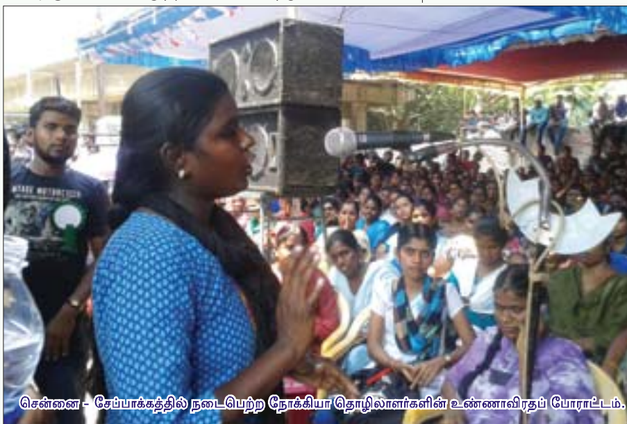
சென்னை - சேப்பாக்கத்தில் நடைபெற்ற நோக்கியா தொழிலாளர்களின் உண்ணாவிரதப் போராட்டம்.

மைக்ரோசாப்ட்டோடு போட்டுக்கொண்ட ஒப்பந்தக் கேடு நெருங்குவதால், ஏய்த்த வரியைக் கட்டாமல் ஆலையை மூடிவிட்டு வெளியேறும் குறுக்கு வழியை நடைமுறைப்படுத்தத் தொடங்கிவிட்டது, நோக்கியா. இதன் முதல்கட்டமாக தனது மாதாந்திர கைபேசி உற்பத்தி இலக்கை 1.3 கோடியிலிருந்து 40 இலட்சமாகத் திட்டமிட்டே குறைத்தது. அதனையடுத்து 6,600 தொழிலாளர்களைச் சிறுக்கச்சிறுக் வெளியேற்றும் முடிவை அறிவித்திருக்கிறது. மேலும், சென்னை ஆலை மூடப்பட்டால் ஏற்படும் உற்பத்தி இழப்பை, சீனாவிலும், வியட்நாமிலும் திறக்கப்பட்டுள்ள புதிய ஆலைகள் ஈடு செய்துவிடும் எனத் தனாவெட்டாக தெரிவித்திருக்கிறது.