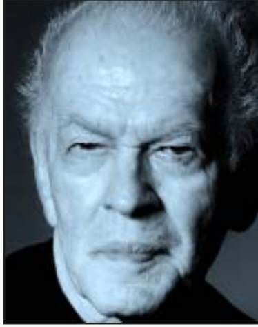
2002-ஆம் ஆண்டு வெனிசுலாவில் நடந்த ஆட்சிக்கவிழ்ப்பின் பின்னணியில் இயங்கிய ஆல்பர்ட் ஐன்ஸ்டீன் கழக நிறுவனரும், அமைதிவழி ஆட்சிக்கவிழ்ப்பு சித்தாந்த வழிகாட்டியுமான ஜென் ஷார்ப்.

அமெரிக்கப் பல்கலைக்கழகங்களில் பட்ட மேற்படிப்பு வசதிகளை ஏற்படுத்தித் தருவது, பேராசிரியர்களுக்கு சர்வதேச மாநாடுகளில் கலந்து கொள்ளும் வாய்ப்புக்களை உருவாக்கித் தருவது எனப் பல வழிகளில் மாணவர்களையும் பேராசிரியர்களையும் தங்களது வலையில் விழவைக்கின்றனர்.