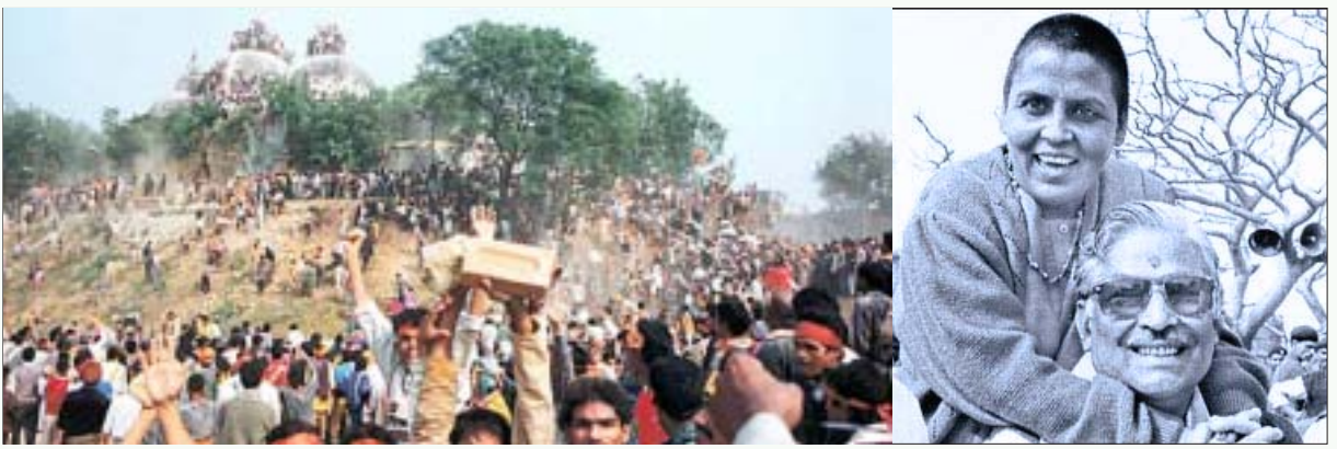
இந்து மதவெறிக் கும்பலால் சதித்தனமாக இடிக்கப்படும் பாபர் மசூதி. அதனைத் திறந்த வாயை மூடாமல் வக்கிரமான குதூகலிப்போடு கண்டு ரசிக்கும் உமாபாரதி மற்றும் முரளி மனோகர் ஜோஷி. (கோப்புப் படங்கள்)

பாபர்மசூதி இடிப்புபற்றி கோப்ராபோஸ்ட் தொகுத்த வீடியோ வெளிவரப் போகிறது எனத் தெரிந்ததுமே, அதைத் தடை செய்யக் கோரி தேர்தல் கமிசனிடம் புகார் அளித்தது பா.ஜ.க. “இது மதரீதியான பிளவை ஏற்படுத்தி, அமைதியான முறையில் தேர்தல் நடக்கும் சூழலைக் கெடுத்துவிடும்” எனப் பீதியூட்டியது. எனினும், தேர்தல் ஆணையம் இவ்வீடியோ வெளியிடப்படுவதற்குத் தடைவிதிக்க மறுத்துவிட்டது. வீடியோ வெளியான பிறகோ, அதில் தமது வானரப் படையினரே வாக்குமூலங்கள் அளித்திருப்பது பற்றிப் பேச மறுத்துவிட்டு, “முசலீம் வாக்குகளைக் கவருவ தற்காகத் தேர்தல் சமயத்தில் வெளியிடுகிறார்கள்” எனக் குற்றஞ்சுமத்தி, பிரச்சினையைத் திசைதிருப்பியது அக் கும்பல்.