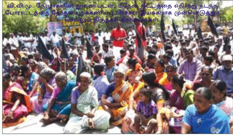
வி.வி.மு. தோழர்களின் துணையுடன், மீதேன் திட்டத்தை எதிர்த்து நடந்த போராட்டத்தை தேர்தல் புறக்கணிப்பு பிரச்சார இயக்கமாக முன்னெடுத்துச் செல்லும் திருநகரி கிராம மக்கள்.

திருச்சி பகுதியில் அரசியல் தலைவர்களைத் தனிப்பட்ட முறையில் அவமதிப்பு செய்வதாகக் குற்றம் சாட்டி தேர்தல் புறக்கணிப்பு பிரச்சாரக் கூட்டங்களுக்கு அனுமதி மறுக்கப்பட்டு, நீண்ட போராட்டத்துக்குப் பின்னரே 7 இடங்களில் தெருமுனைக் கூட்டங்கள் நடத்தப்பட்டன. 18.4.2014 அன்று சென்னை - மணலி பகுதியில் தேர்தல் புறக்கணிப்பு அரசியல் முழக்கங்களைக் கொண்ட சுவரொட்டி ஓட்டியதையடுத்து, பொய்வழக்கு சோடித்து இரு பு.ஜ.தொ.மு. தோழர்களைக் கைது செய்து சிறையிலடைத்தது போலீசு. இதேபோல கடலூரிலும் பு.மா.இ.மு. முன்னணியாளர்கள் கைது செய்யப்பட்டனர். ஓட்டுப் பொறுக்கிகளின் அச்சுறுத்தல், போலீசின் அடாவடிகள் - என அனைத்தையும் எதிர்கொண்டு உழைக்கும் மக்களின் உற்சாகமான ஆதரவோடு நடந்த இப்பிரச்சார இயக்கம், தமிழகம் மற்றும் புதுச்சேரியில் புரட்சிப்புயலாக வீசியது.