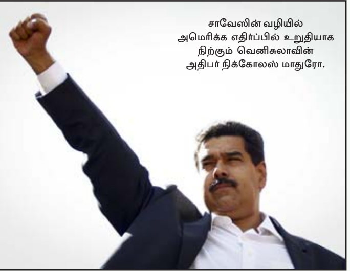
சாவேஸின் வழியில் அமெரிக்க எதிர்ப்பில் உறுதியாக நிற்கும் வெனிசுலாவின் அதிபர் நிக்கோலஸ் மதுரோ.

போராட்டக் காரர்கள் அமைதிவழியில் போராடுவதாக அமெரிக்க ஆதரவு ஊடகங்கள் சித்தரிக்கின்றன. ஆனால் இந்தக் கும்பல், அரசின் அடக்குமுறையை வரவழைப்பதற்காகவே வன்முறைச் செயல்