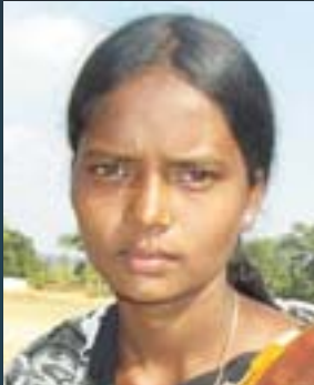
சத்ரி போதாய் 20

வெளியே தெரிந்த செய்திகளுக்கு அப்பால், சத்தீஸ்கரின் பழங்குடியினப் பெண்கள் மும்பை, டெல்லி, பஞ்சாப் மற்றும் இந்தியாவின் தென்பகுதிகளில் உள்ள பெரு நகரங்களுக்குக் கடத்தப்பட்டு, துன்புறுத்தப்பட்டு விபச்சாரத்தில் தள்ளப்படுவதும் நடந்து வருகிறது. திரையில் தொடர்ச்சியாக மாறிக் கொண்டேயிருக்கும் பிம்பங்கள் போல, இம்மக்களது வேலை மற்றும் வாழ்நிலையில் வலுக்கட்டாயமாக பல மாற்றங்கள் அடுத்தடுத்து திணிக்கப்பட்டதுதான் அவர்களின் அவல நிலை அனைத்திற்கும் காரணமாகும். கார்ப்பரேட் பகற் கொள்ளையும் அரசு பயங்கரவாதமும் தலைவிரித்தாடும் சத்தீஸ்கரில், 'நாட்டின் வளர்ச்சி' என்கிற பெயரில் பல