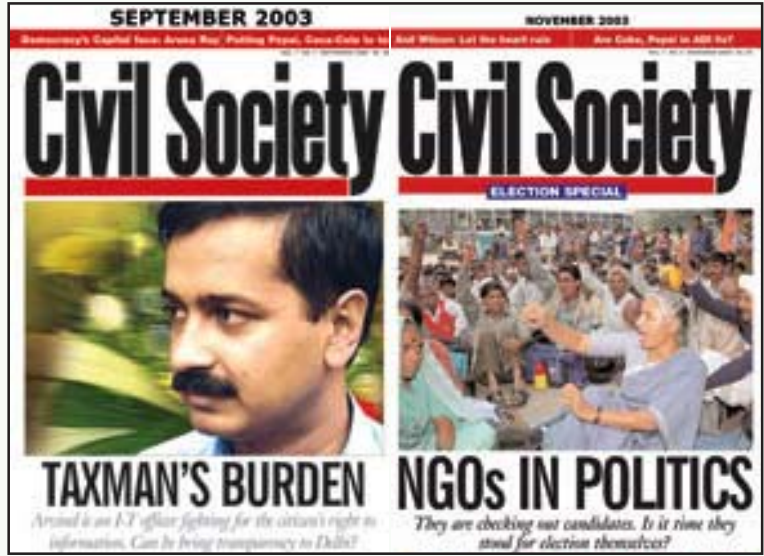
குடிமை சமூகம் முதல் இதழில் - 2003 செப்டம்பரில் அரவிந்த் கேஜரிவால் குறித்த அட்டைப்படக் கட்டுரை (இடது); மற்றும் அரசுசாரா தொண்டு நிறுவனங்கள் அரசியலில் ஈடுபடுவதைக் குறித்து விவாதம் நடப்பதாக அட்டைக் கட்டுரை இடம் பெற்ற குடிமை சமூகம் 2003 நவம்பர் இதழ்.

இந்த மாற்றத்துக்கு என்ன காரணம்? ஏகாதிபத்திய உலகமயமாக்கம் திணிக்கப்பட்ட புதிய தாராளமயப் பொருளாதாரக் கொள்கை, அரசியல் கட்டுமானச் சீர்திருத்தத்தின் ஒரு பகுதியாகத்தான் இந்த மாற்றங்கள் கொண்டுவரப்பட்டன. “இனிநாட்டின் அரசியல், பொருளாதார, சமூக, மருத்துவம் - சுகாதாரம், கல்வி - பண்பாடு உட்பட அனைத்துத் துறைகளிலும் சட்ட திட்டங்கள் எதுவானாலும், அரசின் முறைசார்ந்த அமைப்புகள் மட்டும் தீர்மானிப்பதாகவும் செயல்படுத்துவதாகவும் இருக்கக் கூடாது. அப்படியான சட்ட திட்டங்கள் மக்களுக்கு ஏற்புடையவைதானா என்று அறியவும் அல்லது மாற்றுக்களைப் பரிந்துரைக்கவும் அரசுசாரா தொண்டு நிறுவனங்களை உள்ளடக்கிய குடிமைச் சமூக அமைப்புகளும் சேர்ந்துதான் தீர்மானிக்கவேண்டும்” என்பது கடந்த 25 ஆண்டுகளாக இந்திய அரசு - அது எதுவானாலும் - அமலாக்கிவரும் புதிய பொருளாதார, புதிய கட்டுமானச்