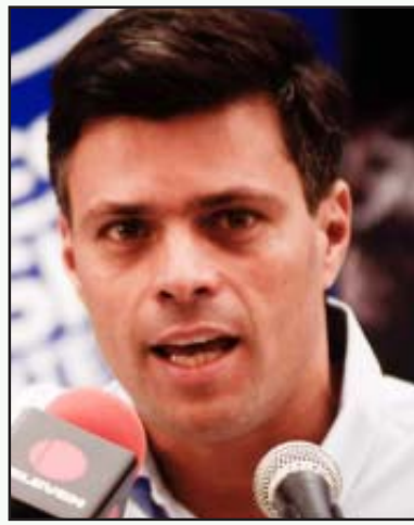
வெனிசுலாவின் எதிர்த்தரப்பு தலைவரும் சி.ஐ.ஏ. கைக்கூலியுமான லோபஸ் மென்டோசா.

மேட்டுக்குடி இளைஞர்களைக் கொண்ட இந்தக் கலவரக் கும்பல், விலைவாசி உயர்வு, பெருகிவரும் குற்றச் செயல்கள், அத்தியாவசியப் பொருட்களின் தட்டுப்பாடு ஆகியவற்றிற்கு எதிராகப் போராடுவதாகக் கூறிக்கொண்டு, அதற்குத் தீர்வாக தனியார்மய, தாராளமயக் கொள்கைகளை அமல்படுத்தக் கோருகிறது. தொழிலாளர்களுக்கு வழங்கப்படும் சலுகைகளும், மக்களுக்கு வழங்கப்படும் மானியங்களும் தான் வெனிசுலாவின் பொருளாதார நெருக்கடிக்குக் காரணம் என்று பிரச்சாரம் செய்கிறது.