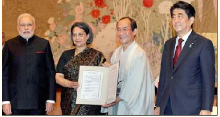
ஜப்பானின் கூட்டோடு, உ.பி. மாநிலத்திலுள்ள காசியை நவீன நகராக உருவாக்கும் ஒப்பந்தம் கையெழுத்திடும் நிகழ்ச்சியில் நரேந்திர மோடியோடு கலந்துகொண்ட ஜப்பானின் பிரதமர் ஷின்சோ அபே (வலது ஓரம்).

பொருட்களையும் ஏல முறையில் ஒதுக்கீடு செய்யும் சட்டத்திருத்தம் - என அடுத்தடுத்து அவசரச் சட்டங்களை அறிவித்து, அதன் வழியாக நமது நாட்டின்கனிம வளங்களை, விவசாய நிலங்களை, பொது மக்களின் சேமிப்பை, தொழிலாளர்களின் உழைப்பை ஏகாதிபத்திய நிறுவனங்களும், உள்நாட்டுத் தரகு முதலாளிகளும் கூட்டாகச் சேர்ந்துகொண்டு தடையின்றிக் கொள்ளையடிப்பதற்கான ஏற்பாடுகளைத் தொடங்கி வைத்துவிட்டது மோடி அரசு.