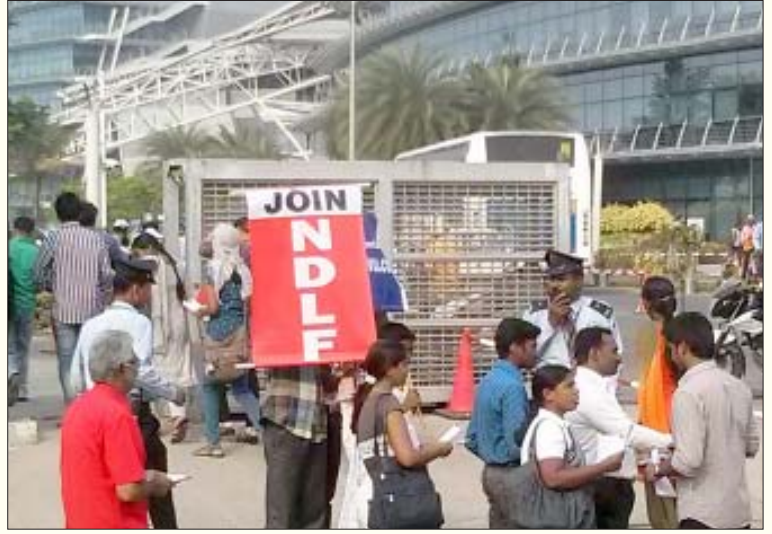
சென்னை - சிறுசேரியில் அமைந்துள்ள டி.சி.எஸ். அலுவலகத்தின் நுழைவாயிலில் பிரச்சாரத்தில் ஈடுபட்ட பு.ஜ.தொ.மு. மற்றும் தோழமை அமைப்பினர்.

தனியார்மய, தாராளமயக் கொள்கைகளின் மூலம் தொழில் வளர்ச்சியும் வேலைவாய்ப்பும் பெருகி மக்களின் வாழ்க்கைத் தரம் உயரும் என்ற நம்பிக்கையை, நடுத்தர வர்க்கத்தினரின் மத நம்பிக்கையாகவே உருவாக்குவதிலும், அவர்கள் வழியாக சமூகம் முழுவதற்கும் இக்கருத்தைப் பரப்புவதிலும் ஐ.டி. துறை வேலைவாய்ப்பு பெரும் பங்கு வகித்து வந்திருக்கிறது. மலையை அறுத்து கிரானைட்டாக ஏற்றுமதி செய்வதையும், ஆற்றைச் சூறையாடி பல மாடிகட்டிடம் கட்டுவதையும், நிலத்தடி நீரை பாட்டிலில் அடைத்து விற்பதையும் கிராமப்புற மக்கள் சோற்றுக்காக நகரம் நோக்கி ஓடுவதையும் “முன்னேற்றம்” என்று கூசாமல் பேசுகின்ற துணிச்சலை