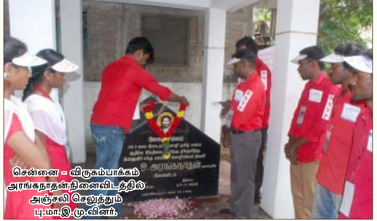
சென்னை - விருகம்பாக்கம் அரங்கநாதன் நினைவிடத்தில் அஞ்சலி செலுத்தும் பு.மா.இ.மு.வினர்.

சென்னை, கோவை, கரூர், கடலூர், சிதம்பரம், விருத்தாசலம், வேதாரண்யம், விழுப்புரம், தருமபுரி, புதுச்சேரி, தஞ்சை, திருச்சி ஆகிய பகுதிகளில் இவ்வமைப்பினர் மொழிப்போர் தியாகிகளின் திருவுருவப்படங்களுக்கு மலர்தூவி மரியாதை செலுத்தினர். திருச்சியில், மத்திய பேருந்து நிலையம் பெரியார் சிலைக்கு மாலை அணிவித்து பேரணியாகப் புறப்பட்டு, தென்னூர் இந்தி பிரச்சார சபாவை முற்றுகையிட்டு ஆர்ப்பாட்டத்தை நடத்தினர்.