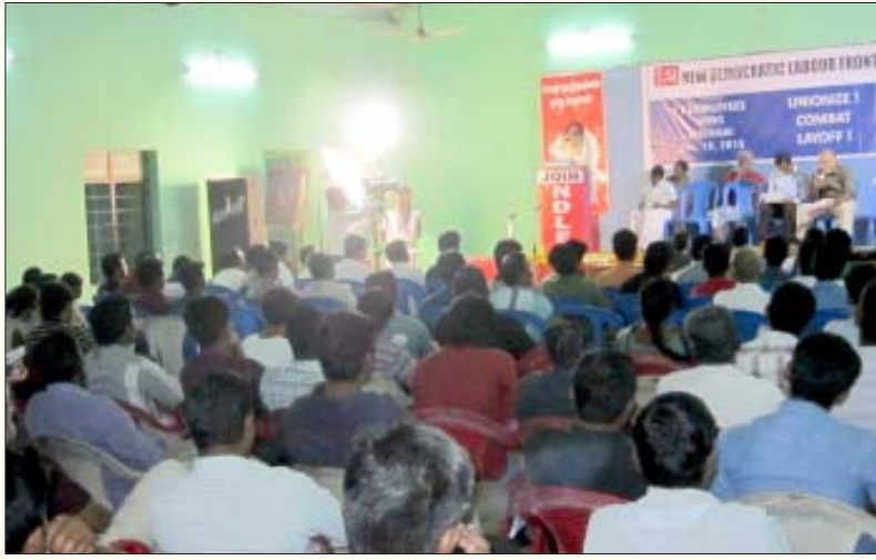
பு.ஜ.தொ.மு.வின் ஐ.டி. ஊழியர் பிரிவு நடத்திய கலந்துரையாடல் கூட்டத்தில் கலந்துகொண்ட தோழர்கள் மற்றும் ஐ.டி. நிறுவன ஊழியர்கள்.

முயன்று தங்களது நிறுவனத்தின் கூம்பு வடிவ நிர்வாகக் கட்டமைவில் மேலே ஏறியவர்கள். பொறியாளர்களுக்கு வேலைகளை ஒதுக்கித் தருவது, மென்பொருளின் தரத்தைப் பரிசோதிப்பது, புதியவர்களைப் பயிற்றுவிப்பது போன்ற இவர்கள் செய்து வரும் பணிகளில் பல இப்போது தானியங்கியமாகி (automated) வருகின்றன. மேலும் இவர்கள் செய்து வரும் பணிகளை