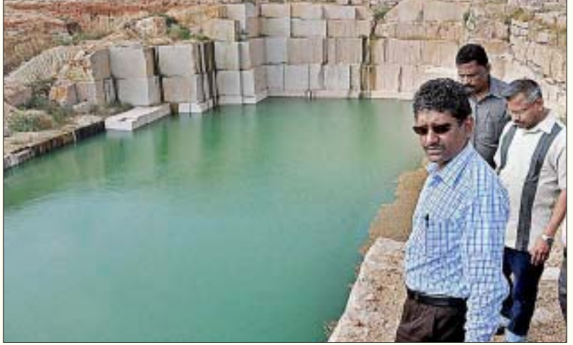
85 ஏக்கர் பரப்பளவு கொண்டதாக இருந்த சூரியனேந்தல் கண்மாய், வெறும் இரண்டு ஏக்கராக குறுகிப்போன அவலத்தை ஆய்வு செய்யும் சகாயம்.

கீழவளவு பகுதியில் அமைந்துள்ள பொதுப்பணித் துறைக்குச் சொந்தமான 47 ஏக்கர் பரப்பு கொண்ட சிறு