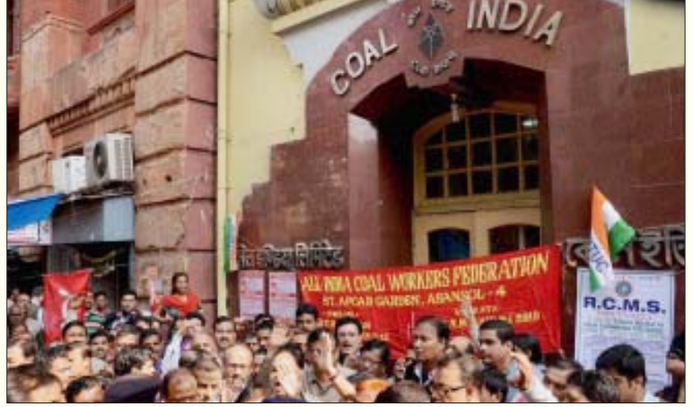
நிலக்கரிச் சுரங்க ஒதுக்கீடு சட்டத்தில் கொண்டுவரப்பட்டுள்ள திருத்தங்களை எதிர்த்து கோல் இந்தியா நிறுவனத்தின் தொழிலாளர்களும் ஊழியர்களும் கொல்கத்தாவில் அமைந்துள்ள அந்நிறுவனத்தின் தலைமை அலுவலகம் முன்பு நடத்திய ஆர்ப்பாட்டம்.

இது மட்டுமின்றி, ஏழைகளின் அரைவயிற்றுக்கஞ்சியிலும் மண்ணை அள்ளிப் போடவும் இந்த அரசு தயங்காது என்பதை சாந்தகுமார் அறிக்கை எடுத்துக் காட்டியிருக்கிறது. உணவு மானியத்தைக் குறைக்கும் வழிகளை ஆராய்வதற்காக மோடி அரசால் நியமிக்கப்பட்ட அக்குழு, “இந்திய உணவுக் கழகத்தை முற்றிலும் மாற்றியமைத்து, நாட்டின் 67 சதவீத மக்களுக்கு உணவுப் பொது காப்புச் சட்டப்படி உணவுப் பொருட்களை வழங்கு