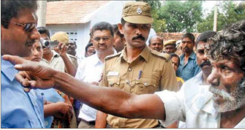
மதுரை அருகேயுள்ள குண்டாங்கல் பகுதியில் வாழ்ந்துவந்த 83 குடும்பங்கள் கிராணைட் மாஃபியா கும்பலால் துரத்தியடிக்கப்பட்டதை சாட்சியமாக அளிக்கும் விவசாயி.