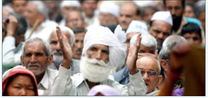
மோடி அரசு கொண்டுவந்துள்ள நிலம் கையகப்படுத்தும் சட்டத் திருத்தங்களை எதிர்த்து டில்லியில் உள்ள ஜந்தர் மந்தர் பகுதியில் நடந்த விவசாயிகளின் ஆர்ப்பாட்டம்.

தனியார்மய-தாராளமயக் கொள்கையின் கீழ் இவர்கள் முன்வைக்கும் வளர்ச்சியென்பது வேலை வாய்ப்பை வழங்காத வளர்ச்சி. அமெரிக்க, ஐரோப்பிய சந்தைகளின் காலை நக்கும் வளர்ச்சி. மொத்த உள்நாட்டு உற்பத்தி அதிகரிப்பு என்பது வேலைவாய்ப்பை பெருக்குவதில்லை, வறுமையை ஒழிப்பதில்லை. ஆற்று மணலையும், தாது மணலையும், கிராண்ட்டையும் கொள்ளையடித்து விற்பதுகூட மொத்த உள்நாட்டு உற்பத்தியை கூட்டத்தான் செய்கிறது. நிலக்கொள்ளையும் அத்தகையதுதான். இங்கிலாந்தில் விபச்சாரம் மற்றும் போதை மருந்து வியாபாரத்தில் ஆண்டுக்கு ஒரு லட்சம் கோடி ரூபாய் புரள்வதால், அதையும் மொ.உ.உற்பத்தியில் (0.7 சதவீதம்) சேர்த்துக் கொண்டு விட்டது பிரிட்டிஷ் அரசு. மொ.உ.உற்பத்தியை உயர்த்த மோடி முன்வைக்கும் பாதையும் அத்தகையதுதான்.