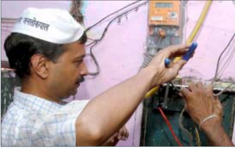
மின் கட்டணத்தைச் செலுத்த முடியாமல் போனதால் துண்டிக்கப்பட்ட இணைப்பை, மீண்டும் 'சட்டத்தை மீறி'க் கொடுக்கும் கேஜ்ரிவாலின் 'கலக' நடவடிக்கை. (கோப்புப் படம்)

“தண்ணீர், மின்சாரம், சாலை, மருத்துவம், கல்வி போன்ற மக்களின் வாழ்க்கையை நேரடியாகப் பாதிக்கின்ற விசயங்கள் குறித்து முன்னெப்போதும் கண்டிராத வகையில் மக்களுக்கு அரசியல் கல்வி அளிக்கிறது.”