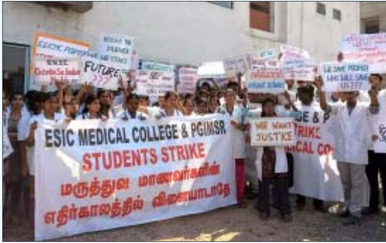
நாடெங்கிலும் உள்ள அரசு இ.எஸ்.ஐ. மருத்துவக் கல்லூரிகளை மூடப்போவதாக மைய அரசு அறிவித்திருப்பதைக் கண்டித்து சென்னையிலுள்ள இ.எஸ்.ஐ. மருத்துவக் கல்லூரி மாணவர்கள் நடத்திய ஆர்ப்பாட்டம்.

உடல் உறுப்புகளைத் திருடிப் பணக்கார நோயாளிகளுக்கு விற்றுக் காசு பார்ப்பது.