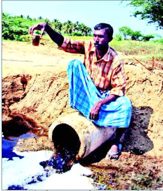
பாலாற்றில் கொட்டப்படும் தோல் ஆலைக் கழிவு நீர். (கோப்புப் படம்)

பத்து உயிர்களைக் காவு வாங்கிய அந்த தொட்டி உடைந்தது ஏன்? சுத்திகரிப்பு நிலையத்தில் ஆலைகளிலிருந்து வந்து சேரும் கழிவுநீரை 20 மணி நேரம் வரை சேமித்து ஒரு படித்தானதாக மாற்றும் தொட்டியானது சமன் செய்யும் தொட்டி (equalization tank) என்று அழைக்கப்படுகிறது. அந்தத் தொட்டியில் எந்திரங்களால் இயக்கப்படும் கலக்கிகள்