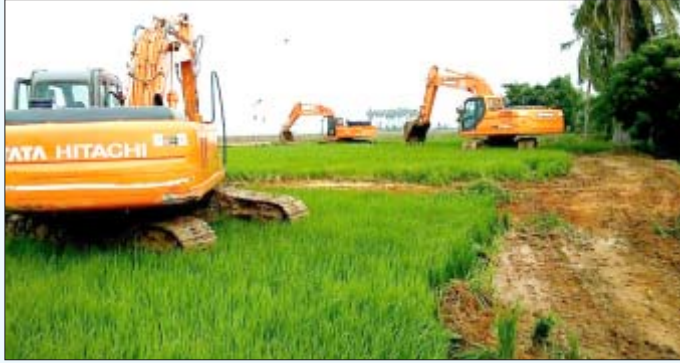
சென்னைக்கு அருகே கும்மிடிபூண்டி வட்டத்தில் அமைந்துள்ள கண்ணன் கோட்டை கிராமத்தில் விவசாயிகளின் எதிர்ப்பையும் யீறி பயிர்களை அழித்து, நிலங்களைக் கையகப்படுத்தியது, தமிழக அரசு.

அப்பகுதியில் சுற்றுச்சூழல் எவ்வளவு பாதிக்கப்படும் (environmental impact assessment) என்பதும், விவசாயத்தின் மூலம் கிடைத்து வந்த வேலைவாய்ப்பு எவ்வளவு, அந்த இடத்தில் தொடங்கப்படும் தொழிலால் கிடைக்கக் கூடிய வேலைவாய்ப்பு எவ்வளவு என்பதும் மதிப்பிடப்பட வேண்டும். ஒரு போகத்துக்கு மேல் விளையும் நிலத்தை,