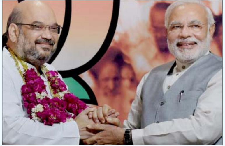
ஆணவமும் செருக்கும் கொண்ட மோடி - அமித்ஷா கூட்டணியில் செருப்படிபட்டு மண்ணைக் கவ்வியது.

இந்த வெற்றியைச் சாத்தியமாக்கியிருப்பது, மோடியின் 8 மாத ஆட்சியின்மீது மக்களுக்கு ஏற்பட்ட வெறுப்பு மட்டுமல்ல; காங்கிரசு உள்ளிட்ட எல்லா ஒட்டுக்கட்சிகள் மீதும் போலீசு-அதி கார வர்க்கம்-நீதித்துறை உள்ளிட்ட இந்த அரசமைப்பின் மீதும் மக்கள் கொண்டிருக்கும் அவநம்பிக்கையும் வெறுப்பும் டில்லி தேர்தல் முடிவுகளில் பிரதிபலிக்கின்றன. இது, தோற்றுப்போன இந்த அரசமைப்பு அளித்திருக்கும் வெற்றி என்றும் கூறலாம். நம்பிக்கை இழந்த மக்களின் நம்பிக்கைதான் ஆம் ஆத்மி பெற்றிருக்கும் வெற்றி. அதனால்தான் வெற்றியின் இந்தப் பரிமாணம் தன்னை அச்சுறுத்துவதாகக் கூறுகிறார் கேஜ்ரிவால்.