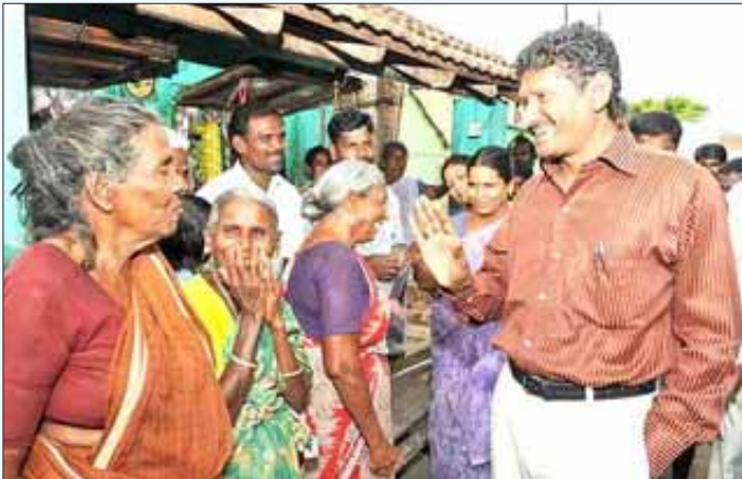
கிராணைட் கொள்ளை குறித்து கிராம மக்களிடம் விசாரணை நடத்தும் சகாயம்.

சகாயம் விசாரணையிலிருந்து தொகுக்கப்பட்ட இந்த செய்திகளை நாட்டின் நிலைமைகளோடு பொருத்திப் பார்க்கும்போது ஒரு உண்மை தெளிவாகத் தெரிகிறது. சகாயம் கத்தி மேல் நடப்பவரைப்போல “சர்க்கஸ்” தான் காட்டுகிறார்; அவர் இப்படிச் செய்வது “அஞ்சாத துணிச்சல்” என்று சொல்லமுடியாது; அதிகாரவர்க்க சட்டமுறைப்படி நடந்து கொண்டால்