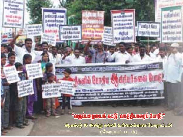
“வகுப்பறையைக் கட்டு வாத்தியாரைப் போடு” ஆகஸ்டு 15 அன்று கல்வி உரிமைக்கான போராட்டம்! (கோப்புப் படம்)

அரசுப் பேருந்துகளை ஓட்டை உடைசலாக ஓடவைத்து அதன் மூலம் தனியார், ஆம்னி பேருந்து முதலாளிகளின் கொள்ளைக்கு உதவுவதைப் போலவே, தனியார் கல்வி கொள்ளைக்காக அரசுப் பள்ளிகள் ஒழித்துக்கட்டப்படுகின்றன.