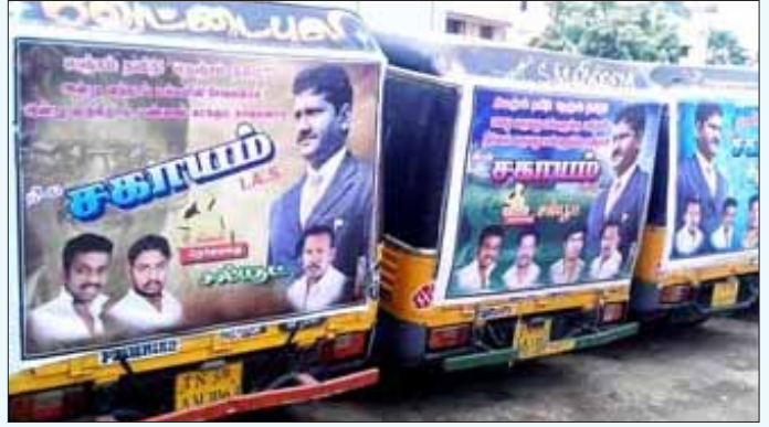
சகாயம் குறித்தும், அவரது விசாரணை குறித்தும் உருவாக்கப்படும் பிரேமைகள்.

“வேறென்ன செய்ய முடியும்? வேறு மாற்று ஒன்றுமே இல்லாதபோது, சகாயம் - ஏதோ அத்திபூத்தார்