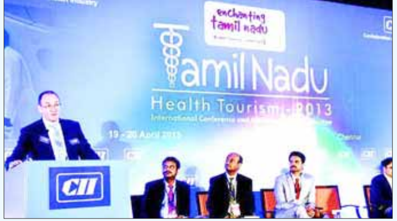
தரகு முதலாளிகளின் சங்கமான சி.ஐ.ஐ., மருத்துவ சுற்றுலா குறித்து சென்னையில் நடத்திய கருத்தரங்கம். (கோப்புப் படம்)

● ஸ்ட்ரெச்சர், வீல்சேர் தள்ளுபவர் துவங்கி, மருத்துவமனையின் அத்துணை பிரிவு ஊழியர்களிடமும் ரூ.50 முதல் ரூ.500 வரை இலஞ்சமாக நோயாளிகளின் உறவினர்கள் அழ வேண்டியிருக்கிறது. அறுவை சிகிச்சைக்கு சில ஆயிரம் ரூபாய்கள் வரை பறிக்கப்படுகிறது.