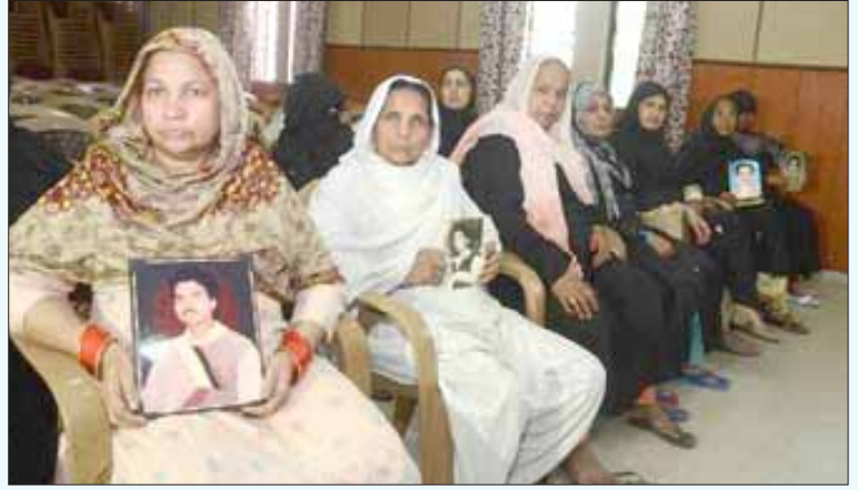
இந்து மதவெறி கொண்ட பிரதேச ஆயுதப் படை போலீசாரால் படுகொலை செய்யப்பட்ட தமது அன்புக்குரியவர்களின் புகைப்படங்களுடன் முசுலீம் தாய்மார்கள். (கோப்புப் படம்)

முசுலீம்கள் அனைவரையும் வீட்டைவிட்டு வெளியேறுமாறும், தவறினால் சுட்டுக் கொல்லப்படுவார்கள் என்றும் உத்தரவிட்டது. வீட்டைவிட்டு வெளியேறிய ஆண், பெண், குழந்தைகள், முதியவர்கள் அனைவரும் நடுத்தெருவில் துப்பாக்கி முனையில் நிறுத்தப்பட்டனர். காலியாக இருந்த வீடுகளினுள் புகுந்து தேடுதல் வேட்டை நடத்திய ஆயுதப் படை போலீசார் வீட்டினுள் இருந்த உடமைகளைச் சேதப்படுத்தியதோடு, பணம், நகைகளைக் கொள்ளையடித்தனர். துப்பாக்கி முனையில் நிறுத்தப்பட்ட முசுலீம்களுள் குழந்தைகள், பெண்கள், முதியவர்கள் தனியாகவும் இளவயது முசுலீம்கள் தனியாகவும் பிரிக்கப்பட்டனர். இளவயது முசுலீம்களுள் 42 பேர் பிரதேச ஆயுதப் படை போலீசாரால் வலுக்கட்டாயமாக வேனில் ஏற்றப்பட்டுக் கடத்திச் செல்லப்பட்டனர். இன்னுமொரு 324 பேர் அருகிலுள்ள போலீசு நிலையத்திற்கு இழுத்துச் செல்லப்பட்டனர்.