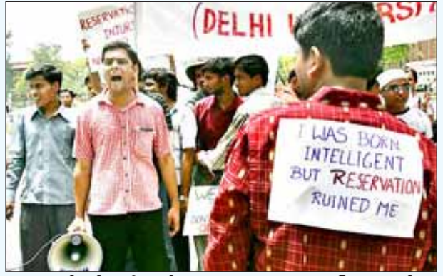
“நான் பிறவி அறிவாளி. எனது வாழ்க்கையை இட ஒதுக்கீடு சீர்குலைத்துவிட்டது” என்ற ஆதிக்க சாதி திமிர் பிடித்த பதாகைகளோடு இட ஒதுக்கீட்டிற்கு எதிராக டெல்லியில் நடந்த ஆர்ப்பாட்டம். (கோப்புப் படம்)

இதனைச் சாதிப்பது முன்னேறிய சாதியினரின் சாதி ரீதியான வலைப்பின்னல். இத்தகைய சாதி அபிமானம் என்பது