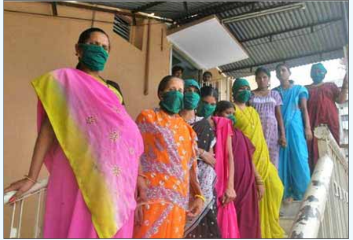
குஜராத்-அகமதாபாத் நகரைச் சேர்ந்த வாடகைத் தாய்மார்கள். (கோப்புப் படம்)

சீனா அடிப்படையான மருத்துவ நலத்தில் பாராட்டத்தக்க தன்னிறைவைப் பெறக் காரணமாக இருந்தது அந்நாட்டு அரசின் விருப்புறுதி மட்டுமே