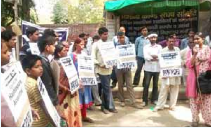
அரசு பயங்கரவாதக் குற்றவாளிகளை விடுதலை செய்த தீர்ப்பைக் கண்டித்துத் தன்னார்வ அமைப்புகள் டெல்லியில் நடத்திய ஆர்ப்பாட்டம்.

யிலேயே மரணமடைந்தனர். மேலும், மலியானா என்ற கிராமத்தில் பிரதேச ஆயுதப் படை நடத்திய கண்மூடித் தனமான துப்பாக்கிச் சூட்டில் இருபதுக்கும் மேற்பட்ட முசுலீம்கள் கொல்லப்பட்டனர்.