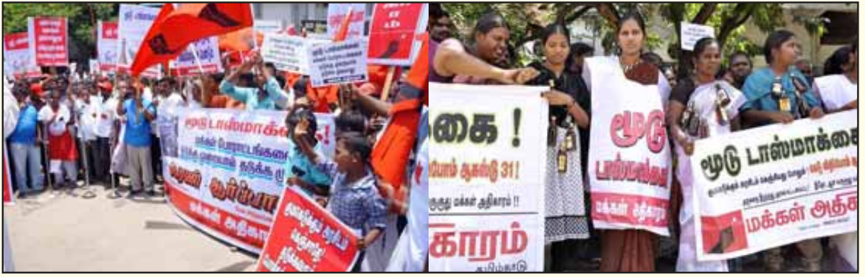
“மூடு டாஸ்மாக்கை! அடக்குமுறையால் தடுக்க முடியாது!!” என்ற முழுக்கத்தை முன்வைத்து மக்கள் அதிகாரம் அமைப்பால் ஆகஸ்டு 31 அன்று திருச்சி (இடது) மற்றும் மதுரையில் நடத்தப்பட்ட பெருந்திரள் ஆர்ப்பாட்டம்.

ம.தி.மு.க., விடுதலைச்சிறுத்தைகள், மனிதநேய மக்கள் கட்சி இணைந்து 4.8.2015 அன்று முழு அடைப்புப் போராட்டத்தை நடத்தின. இப்போராட்டத்திற்கு தே.மு.தி.க., காங்கிரசு, இடது, வலது கம்யூனிஸ்ட் கட்சிகள் ஆதரவு தெரிவித்தன. தி.மு.க. ஆக.10 அன்று தமிழகம் தழுவிய அளவில் ஆர்ப்பாட்டங்களை நடத்தியது. இடது கம்யூனிஸ்ட் கட்சியின் இளைஞர் அமைப்பும், மகளிர் அமைப்பும் தமிழகத்தின் பல்வேறு பகுதிகளில் ஆர்ப்பாட்டங்களை நடத்தின.