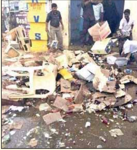
“எங்கள் ஊரில் டாஸ்மாக்கடை தேவையில்லை” என ஊராட்சி மன்றம் தீர்மானம் நிறைவேற்றிய பிறகும், அதனை மதிக்காமல் நடத்தப்பட்டு வந்த டாஸ்மாக்கடையை அடித்து நொறுக்கும் கலிங்கப்பட்டி கிராம மக்கள்.