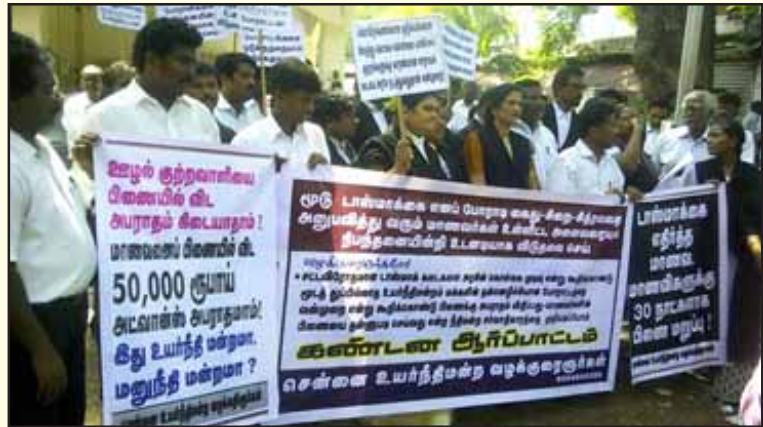
டாஸ்மாக்கை மூடக் கோரிப் போராடிய மக்கள் அதிகாரம், சென்னை மாணவர்கள், மேலப்பாளையூர் கிராம மக்களுக்கு நிபந்தனையற்ற பிணை தர மறுத்த நீதிமன்றங்களின் கைக்கூலித்தனத்தை அம்பலப்படுத்தி சென்னை உயர்நீதி மன்ற வழக்குரைஞர்கள் நடத்திய ஆர்ப்பாட்டம்.

அ.தி.மு.க. வினர் அண்ணாசாலையை மறித்து வெறியாட்டம் போடுவதை கண்டுகொள்ளாத உயர்நீதிமன்றம், தே.மு.தி.க. சாலையோரமாக நின்று மனிதச் சங்கிலி போராட்டம் நடத்தினால், மக்களுக்கு ஏற்படக்