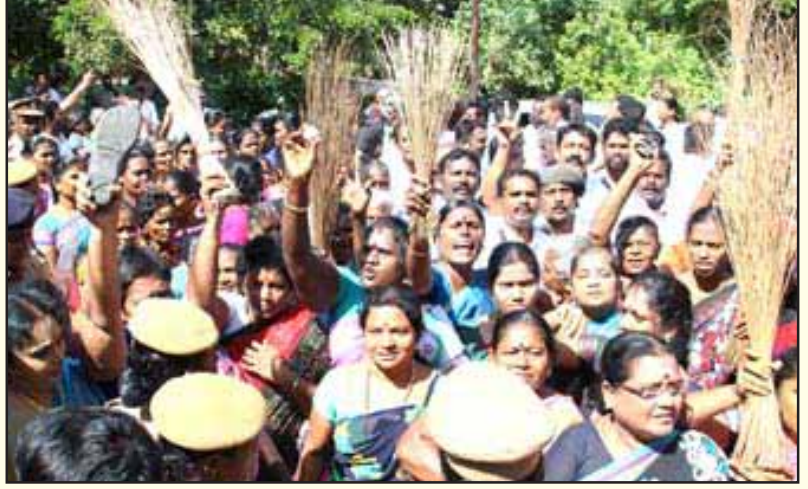
ஈ.வி.கே.எஸ். இளங்கோவனுக்கு எதிராக அ.தி.மு.க. காலிகள் மதுரையில் நடத்திய ஆர்ப்பாட்டம்.

பழைய சினிமாக்களில் எம்.ஜி.ஆர்., என்.டி.ஆருடன் அரைகுறை ஆடையுடன் தான் போட்ட கவர்ச்சி ஆட்டங்களைக் கூச்சநாச்சமின்றி இன்னமும் ஒளிபரப்பித் தனது ரசிகர்களுக்குக் கிளுகிளுப்பூட்டிவரும் புரட்சித் தலைவியை இளங்கோவனுடைய பேச்சு அவமானப்படுத்தி விட்டதாகக் கூறித் தமிழகமெங்கும் மேற்படிக் கூத்துகள் நடக்கின்றன. ஆனால், இந்த ஜெயலலிதா என்னவெல்லாம் பேசி இப்போதைய நிலைக்கு வந்தார் என்பதை மக்கள் மறந்துவிட்டார்கள் என்ற துணிச்சலில் இப்படி ஆட்டம் போடுகிறார்கள்.