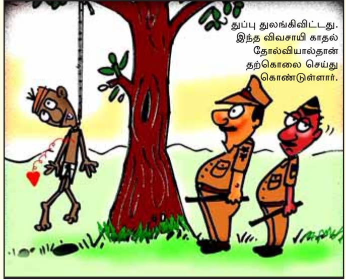
துப்பு துலங்கிவிட்டது. இந்த விவசாயி காதுல் தோல்வியால்தான் தற்கொலை செய்து கொண்டுள்ளார்.

மகசூல் குறைவு, கந்துவட்டிக்காரர்களின் அச்சுறுத்தல், சர்க்கரை ஆலைகள் நிலுவைத் தொகை வழங்காததால் ஏற்பட்ட கடன் சுமை, வங்கியில் பெற்ற கடனை அடைக்க முடியாத நிலையில் வங்கி நிர்வாகம் நிலத்தை ஏலம் விடுவதற்கான நோட்டீசு அனுப்பியதால் மனமுடைந்துபோவது - எனப் பல்வேறு காரணங்களால் விவசாயிகளின் தற்கொலை செய்து கொள்ளும் கொடுமை நம் கண்முன்னே நிகழ்ந்து கொண்டிருக்கிறது. குறிப்பாக, தனியார்மயம் - தாராளமயம் திணிக்கப்பட்ட கடந்த 20 ஆண்டுகளில் மட்டும் நாடு முழுவதும் ஏறத்தாழ 3.2 லட்சம் விவசாயிகள் தற்கொலை செய்து கொண்டுள்ளனர். ஆனாலும், நாட்டின் முதுகெலும்பான விவசாயிகளின் தற்கொலைச் சாவுகளைத் தேசிய முக்கியத்துவம் வாய்ந்த பிரச்சினையாகக் கருதாமல், இன்றைய அரசியலமைப்பு முறையே இத்தகைய சாவுகளை அற்ப விவகாரமாக ஒதுக்கித் தள்ளுகிறது.