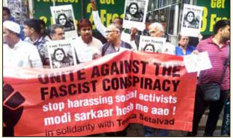
தீஸ்தா மீது பொய்வழக்கு போடப்பட்டிருப்பதைக் கண்டித்து மும்பையிலுள்ள சி.பி.ஐ. அலுவலம் எதிரே நடந்த ஆர்ப்பாட்டம்.