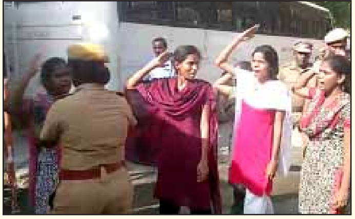
தம் மீது போடப்பட்டுள்ள பொய் வழக்குகளை ரத்து செய்யக் கோரி எழும்பூர் நீதிமன்ற வளாகத்திற்குள்ளேயே முழுக்கமிடும் மாணவிகள்.

குற்றம் சாட்டப்பட்ட நபர் குற்றவாளிதானா என் பதும், இழப்பு எனக் கூறப்படும் தொகை உண்மை தானா என்பதும் விசாரணைக்குப் பின்னர் தீர்ப்பில் தான் தெரியவரும். சொத்துக்கு விப்பு வழக்கில் குற்றம் நிரூ பிக்கப்பட்டு நான்காண்டு சிறையும், 100 கோடி அபராதமும் விதிக்கப்பட்ட ஜெயலலிதாவுக்கு பத்து ரூபாய் கூட டெபாசிட் விதிக்காமல் பிணை தருகிறார்