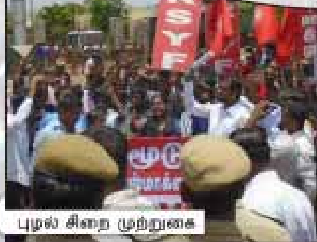
புழல் சிதை முற்றுகை