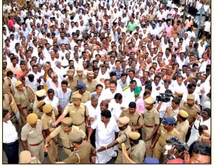
அனல் மின் நிலையத்தை முற்றுகையிட ஊர்வலமாகச் செல்லும் என்.எல்.சி. தொழிலாளர்கள்.

நிரந்தரத் தொழிலாளர்கள் கூடுதல் சம்பளம் பெறுவதற்கும், அதிகாரிகள் ஒரு லட்ச ரூபாய் அளவுக்கு சம்பளத்துடன் கொழுப்பதற்கும், என்.எல்.சி. யின் லாபம் பெருகியதற்கும் ஒப்பந்தத் தொழிலாளர்கள் தான் முக்கிய காரணமாக உள்ளனர். ஆனால், ஒப்பந்தத் தொழிலாளர் போராடினால் நிரந்தரத் தொழிலாளர்கள் ஆதரவாக நிற்பதில்லை. நிரந்தரத் தொழிலாளர்களுக்கென ஒரு சங்கமும், தற்காலிக - ஒப்பந்தத் தொழிலாளர்களுக்கென ஒரு சங்கமுமாக தொழிற்சங்கத் துரோகிகள் தொழிலாளர்களைப் பிரித்து வைத்துதான் இயக்குகின்றனர். நெய்வேலி மட்டு