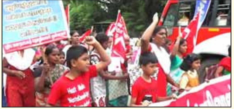
கோவை சாயிபாபா காலனியில் உள்ள டாஸ்மாக் கடையை அடித்து நொறுக்கிய மக்கள் அதிகாரம் அமைப்புத் தோழர்கள் மீது நடத்தப்பட்ட போலீசின் தாக்குதலைக் கண்டித்து, “ஜெயா அரசை வலுப்படுத்த அனைவரும் மது குடிக்க வாருங்கள்” என்ற நையாண்டி முழக்கத்தை முன்வைத்து புதிய ஜனநாயகத் தொழிலாளர் முன்னணியைச் சேர்ந்த பெண் தோழர்களால் கோவையில் நடத்தப்பட்ட ஆர்ப்பாட்டம்.

மாணவர்கள் நடத்திய இப்போராட்டங்களிலேயே சென்னை-பூவிருந்தவல்லி அண்ணா மேநிலைப் பள்ளி மாணவர்களும் சென்னை-மதுரவாயல் அரசு மேநிலைப்பள்ளி மாணவர்களும் நடத்திய சாலை