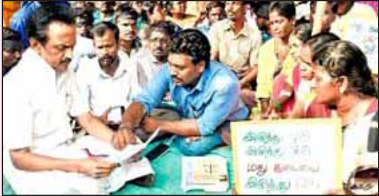
சென்னை சேப்பாக்கம் ரயில்வே மேம்பாலத்தின் கீழே உண்ணாவிரதமிருந்த டிசம்பர் 3 இயக்கத்தைச் சேர்ந்த மாற்றுத் திறனாளிகளைச் சந்தித்து, அவர்களின் போராட்டத்திற்கு ஆதரவு தெரிவிக்கும் தி.மு.க பொருளாளர் மு.க.ஸ்டாலின்.