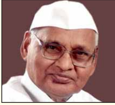
வியாபம் ஊழலில் தொடர்பு இருப்பதற்குப் போதிய ஆதாரங்கள் இருந்தபோதும், ஆளுநர் என்ற அரசியல் சாசனத்தகுதியைப் பயன்படுத்திக் கொண்டு வழக்கு விசாரணையிலிருந்து தப்பித்துக் கொண்ட ம.பி. மாநில ஆளுநர் ராம்நரேஷ் யாதவ்.