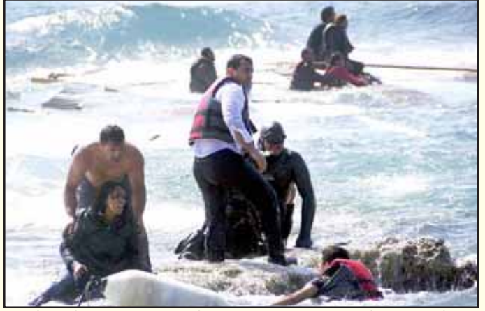
ஐரோப்பிய நாடுகளுக்குச் செல்ல முயன்று, படகு கவிழ்ந்து மத்தியத் தரைக்கடலில் தத்தளிக்கும் சிரிய அகதிகளை மீட்கும் கிரேக்க போலீசார்.

கள் கொத்துக்கொத்தாக மிதந்து கரை ஒதுங்கும் கோரம் - என முதலாளித்துவ உலகின் மனிதாபிமானமற்ற கொடூரத்தைக் கண்டு உலகமே காறி உமிழ்கிறது. அகதிகளின் அவலங்களும் ஐரோப்பிய நாட்டு அரசுகளின் அடக்குமுறைகளும் உலகெங்கும் அம்பலமாகத் தொடங்கி, குறிப்பாக சிறுவன் அய்லான் பிணமாக மண்ணில் புதைந்துள்ள புகைப்படம் வெளியாகி கண்டனங்கள் வலுத்த பிறகுதான், ஐரோப்பிய அரசுகள் வரம்புக்குட்பட்ட அளவுக்கு அகதிகளைத் தற்காலிகமாக ஏற்பதாக அறிவித்துள்ளன.