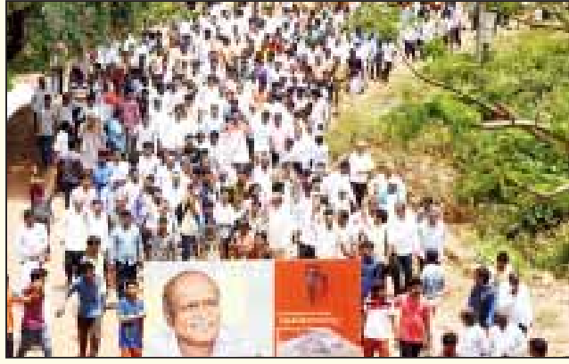
இந்துவெறி காட்டுமிராண்டித்தனத்தை எதிர்த்து தார்வாட் நகரில் பெருந்திரளான உழைக்கும் மக்கள் பங்கேற்ற கல்பூர்கியின் இறுதி ஊர்வலம்.

“சாதனா” என்ற மூடநம்பிக்கை எதிர்ப்பு பத்திரிகையையும் தொடர்ந்து நடத்தி வந்தார். மூட நம்பிக்கைகள் மற்றும் போலி சாமியார்களுக்கு எதிராக ஒரு சட்டத்தை நடப்பு சட்டமன்றக் கூட்டத்தில் அறிமுகம் செய்யவேண்டியதொரு கட்டாயத்தை மாநில அரசுக்கு ஏற்படுத்தும் வகையில், பல்வேறு போராட்டங்களை நடத்தியவர்தான் தபோல்கர். அதனாலேயே அம்மூத்த பகுத்தறிவாளர் இந்து வெறியர்களால்