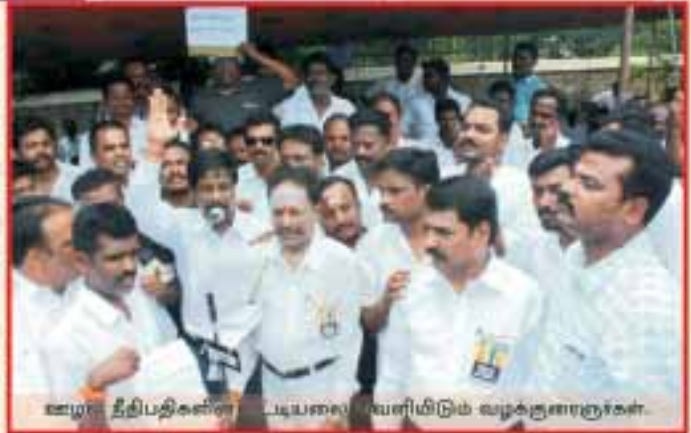
ஊழல் நீதிபதிகளின் படியலை எவளியிடும் வழக்குளாளர்கள்.

"காசு-பணம்-துட்டு-நீதிபதி!", "கவத்தை அப்புறம் பார்ப்போம், உயர்நீதி மன்றத்தை முதலில் கவனிப்போம்" என்பன போன்ற முழக்கங்கள் மக்கள் மன்றத்தில்