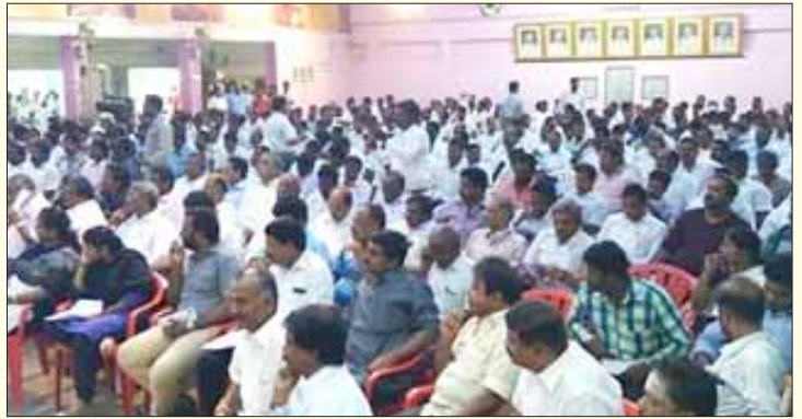
நீதித்துறை ஊழலையும், அதன் சர்வாதிகாரப் போக்கையும் கண்டித்து திருச்சி வழக்குரைஞர்கள் சங்கத்தின் சார்பில் திருச்சியில் நடத்தப்பட்ட கூட்டம்.

தமிழக வழக்கறிஞர்கள் மீதான இந்த 'அனைத்திந்திய வன்மத்துக்கு' மதுரை ஊழல் எதிர்ப்புப் பேரணி மட்டுமே காரணம் அல்ல. தமிழக வழக்கறிஞர்கள் சமூக அரசியல் பிரச்சினைகளுக்காகப் போராடுவதில் இந்தியா