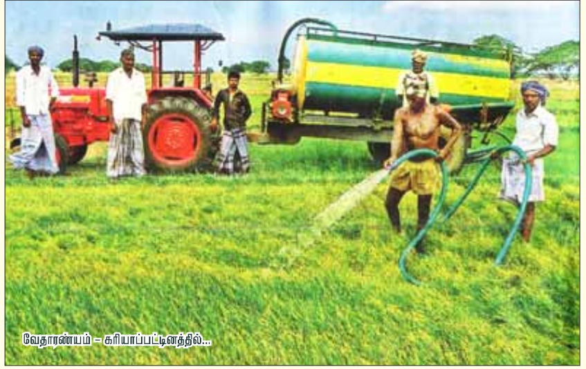
வேதாரண்யம் - கிரியாப்படிவத்தில்...

காவிரி டெல்டா மாவட்டங்களில் பல இலட்சம் ஏக்கரில் பயிரிடப்பட்டுள்ள சம்பா பயிரின் நிலை இன்றோ அல்லது நாளையோ என்ற அபாயக் கட்டத்தைத் தொட்டு நிற்கிறது. காவிரித் தண்ணீரை நம்பி வெள்ளாமையில் இறங்கிய விவசாயிகள், இன்று வாரித் தண்ணீரை வயலில் பாய்ச்சி பயிர்களைக் காப்பாற்றப் போராடிக் கொண்டிருக்கிறார்கள். இப்படி நிலைமை கைமீறிப் போய்க் கொண்டிருக்கும் வேளையில் தான், மைய அரசு தனது கும்பகர்ண தூக்கத்திலிருந்து எழுந்து டெல்லியில் கடந்த செப்.28 அன்று காவிரி கண்காணிப்புக் குழுவைக் கூட்டியது. கொஞ்சத்துக்கு கொஞ்ச