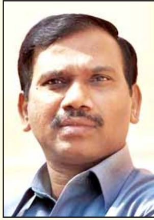
ஆ.ராசா மீது திடீரெனப் பாய்ந்தது சொத்துக்குவிப்பு வழக்கு.

இந்த சந்தேகங்கள் குறித்து சி.பி.ஐ. எந்தவிதமான விளக்