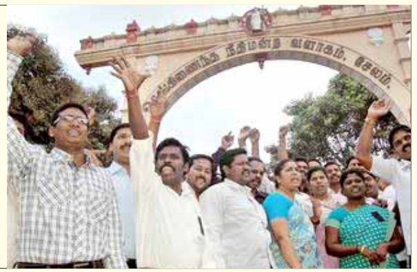
காவிரி மற்றும் முல்லைப்பெரியாறு பிரச்சினைகளில் தமிழகம் வஞ்சிக்கப்படுவதைக் கண்டித்து வழக்குரைஞர்கள் சங்கத்தின் சார்பில் தஞ்சையிலும் (இடது) சேலத்திலும் நடந்த ஆர்ப்பாட்டங்கள். (கோப்புப் படங்கள்)

போராட்டமே தப்பு என்று பேசும் கலாம் ரசிகர்கள், இத் தனை நஞ்சுகளுக்கும் தேன் சேர்த்து மக்களின் நாக்கில் தடவும் ஊடகவியலாளர்கள் - என இந்தப் பொதுக் கருத்தைப் பல கைகளும் வளைந்து உருவாக்குகின்றன.