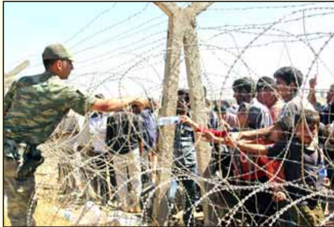
ஐரோப்பிய நாடுகளுக்குச் செல்ல துருக்கி எல்லையில் அனுமதிக்காகக் காத்திருக்கும் சிரிய அகதிகளின் அவலம்.

அதன் பிறகு, இராக்கில் சதாம் உசைனின் ஆட்சி தூக்கியெறியப்பட்டு, தனது நோக்கங்களுக்குச் சேவை செய்யும் வகையிலான ஷியா பிரிவு முஸ்லிம்கள் தலைமையில் ஒரு பொம்மை அரசை உருவாக்கி, ஜனநாயகத்தையும் அமைதியையும் நிலைநாட்டிவிட்டதாக அமெரிக்கா கூறிக் கொண்டாலும், சன்னி பிரிவு இஸ்லாமிய பயங்கரவாதக் குழுக்கள் நடத்தும் எதிர்தாக்குதலால் இன்று அந்நாடே