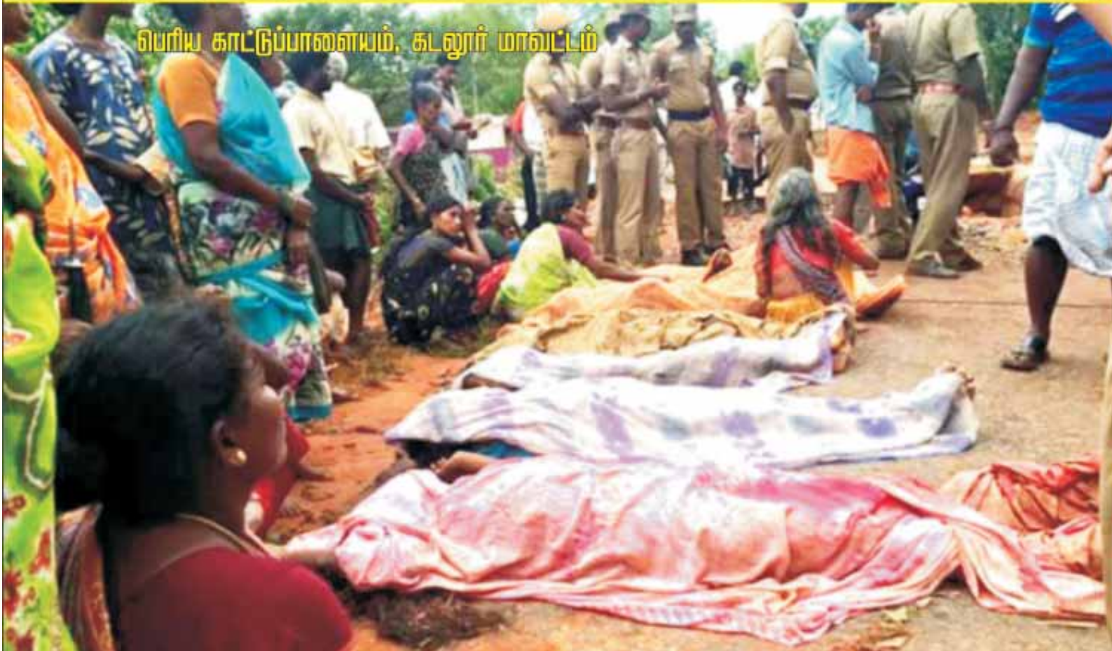
பெரிய காட்டுப்பாளையம், கடலூர் மாவட்டம்