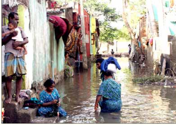
குட்டை போலத் தேங்கி நிற்கும் வெள்ள நீருக்குள்ளேயே வசிக்க வேண்டிய கட்டாயத்தில் பொழிச்சலூர் பகுதி மக்கள்.

வலசை செல்லும் பறவைகளுக்கு இனப்பெருக்க பூமியாகவும், ஏராளமான நீர்த் தாவரங்கள், மீன்கள், நுண்ணிய முதுகெலும்பு இல்லா உயிரினங்கள் வசிக்கும் பல்லுயிர் சூழல் முக்கியத்துவம் வாய்ந்த பகுதி இவை. நன்னீர் சதுப்பு நிலம் என்பது அரிதினும் அரிதானவை. அப்படிப்பட்ட நன்னீர் சதுப்பு நிலமான பள்ளிக்கரணையை அரசும், ரியல் எஸ்டேட் மாஃபியாக்களும், ஐ.டி. நிறுவனங்களும் கூறு போட்டு, அதன் பெரும்பகுதியை நாசப் படுத்திவிட்டன. (பார்க்க: பெட்டிச் செய்தி)