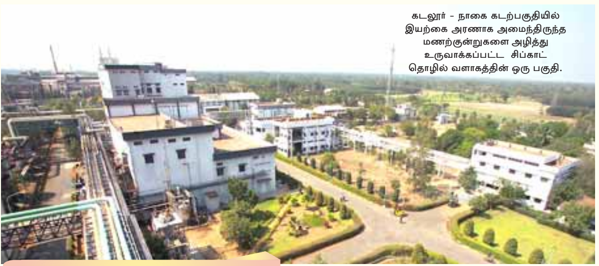
கடலூர் - நாகை கடற்பகுதியில் இயற்கை அரணாக அமைந்திருந்த மணற்குன்றுகளை அழித்து உருவாக்கப்பட்ட சிப்காட் தொழில் வளாகத்தின் ஒரு பகுதி.