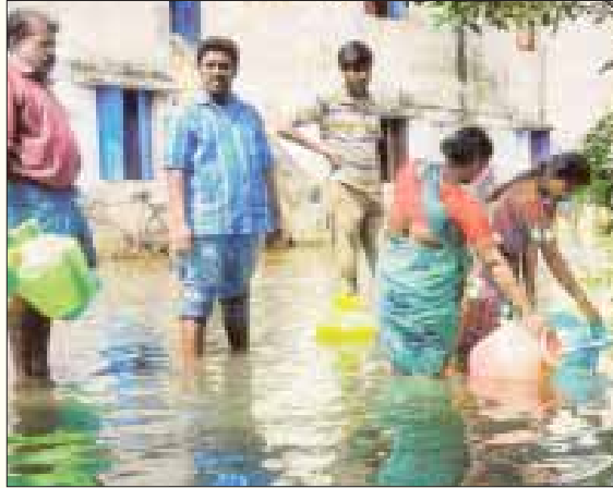
கழிவுநீர் கலந்துவரும் குடிநீரைக் குடிக்க வேண்டிய நிலையில் நிறுத்தப்பட்டுள்ள செம்மஞ்சேரி சுனாமி குடியிருப்பு பகுதி மக்கள்.

1970-80 காலக்கட்டத்தில் உருவான முகப்பேர், விருகம்பாக்கம் உள்ளிட்ட பகுதிகளும், 1990-களில் தனியார்மயம் புகுத்தப்பட்டபின் உருவான வேளச்சேரி, பெரும்பாக்கம், மடிப்பாக்கம், மேற்குதாம்பரம் உள்ளிட்ட பகுதிகளும் பல்வேறு நீர் ஆதாரங்களை அழித்தும், ஆக்கிரமித்தும்தான் எழுந்து நிற்கின்றன.