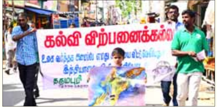
கல்வியை முழுமையாகக் கடைச்சரக்காக மாற்றும் காட்சி ஒப்பந்தத்தில் இந்திய அரசு கையெழுத்திடக் கூடாதெனக் கோரி பொதுக் கல்விக்கான மாநில மேடை அமைப்பின் சார்பில் நடத்தப்பட்ட ஆர்ப்பாட்ட ஊர்வலம். (கோப்புப் படம்)

இதுமட்டுமல்ல, DTH (நேரடி அலை வரிசை) வாயிலாக பெண்களுக்கான கல்வி அவர்கள் வீட்டுக்கே வரும் என்றும் இது பாதுகாப்பானது என்றும் சொல்வதன் மூலம், புதியக் கல்விக் கொள்கையானது, தொழில்நுட்பத்தின் உதவியோடு பெண்களை