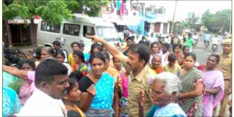
“அ.தி.மு.க.விற்கு ஓட்டுப் போடுவோம்” என சத்தியம் வாங்கிக் கொண்டு நிவாரணப் பொருட்களை வழங்கும் அ.தி.மு.க.வின் கயமைத்தனத்தைக் கண்டித்து கடலூரில் பொதுமக்கள் நடத்திய ஆர்ப்பாட்டம்.

● செம்பரம்பாக்கம் ஏரியை ஆழப்படுத்தும் திட்டத்தில் 30 சதவீதப் பணிகள்கூட நிறைவேற்றப்படவில்லை. இதனால், டிசம்பர் 1 அன்று நள்ளிரவில் அந்த ஏரியிலிருந்து 18,000 கன அடி நீர் வெளியேற்றப்பட்டது. மேட்டுர் அணையிலிருந்து கூட இவ்வளவு