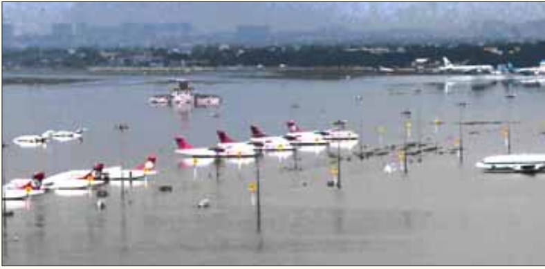
அடையாறின் வெள்ள நீர் வடிநிலத்தை ஆக்கிரமித்து உருவாகியுள்ள சென்னை புதிய விமான நிலையம்.

நீதி மன்றக் கிளை இருக்கும் இடம், முன்பு உலகனேரி கண்மாயாக இருந்தது. தல்லாகுளம் கண்மாயின் அழிவின் மேல்தான் மதுரை மாநகராட்சி, சட்டக்கல்லூரி, வணிக வரி அலுவலகங்கள் அமைந்துள்ளன.