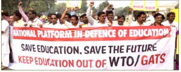
கல்வியைப் பண்டமாக்கவும், மாணவனை நுகர்வோனாகவும் மாற்றும் காட்ஸ் ஒப்பந்தத்தை எதிர்த்து அனைத்திந்திய பல்கலைக் கழகமற்றும் கல்லூரி ஆசிரியர் சங்கங்களின் கூட்டமைப்பின் சார்பில் டெல்லியில் நடைபெற்ற பேரணி.

● இதுவரை ஆராய்ச்சித் திட்டங்களில் உருவாக்கப்பட்ட "கிளினிக்கல் டிரையல்ஸ்" தரவுகள் மற்றும் கண்டுபிடிப்புகள் பொதுமக்கள் அணுக முடியாத வண்ணம் அறிவுசார் சொத்துரிமை (Intellectual property rights) விதிகளின்படி அமல்படுத்தப்பட இருக்கிறது. உலக மேல்நிலை வல்லரசான அமெரிக்காவிலேயே மக்களின் நீண்ட நெடிய போராட்டத்தின் காரணமாக, சென்ட்டில் இதற்காக தரவு வேலை பார்த்த Elsevier என்ற பன்னாட்டு அறிவியல் பதிப்பகம் பின்வாங்க நேர்ந்தது நினைவிருக்கலாம். ஆனால், இங்கோ வளர்ச்சி, விகாஸ் எனும் பெயரில் அப்பட்டமான வேசைத்தனமே IPRஐப்