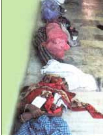
மண்பாக்கம் ஏரிக்குள் கட்டப்பட்ட மியாட் மருத்துவமனையில் இறந்துபோனவர்களின் சடலங்கள்.

தமிழகத்தில் வெள்ளப் பெருக்கு ஏற்படுவதைத் தடுக்கவும், மழை நீரைச் சேமித்து வைக்கவும் இருக்கின்ற ஏரிகள், குளங்களையாவது பாதுகாக்க வேண்டும் என்ற கோரிக்கை இப்பொழுது வலுப்படுத்த தொடங்கியிருக்கிறது. எனினும், இந்தக் கோரிக்கையை முன்வைக்கும் பலரும் விவசாய நசிவைப் பற்றிப் பேசுவது கிடையாது. ஏரிகளைப் பாதுகாக்க கோரும் பெரும்பாலோர் சுற்றுப்புறச் சூழல் அரசியல் கண்ணோட்டத்திலிருந்து அல்லது பாதிப்பால் ஏற்பட்ட அனுபவத்திலிருந்து மட்டுமே இக்கோரிக்கையை முன்வைக்கின்றனர். ஏரிகளின், தமிழக ஆறுகளின் பேரழிவுக்குக் காரணமான தனியார்மய வளர்ச்சிப் பாதையை நிராகரிக்காமல், நீர் நிலைகளைப் பாதுகாத்துவிட முடியும் எனக் கருதுவது கனவுகளில்கூட சாத்தியமாகாது.