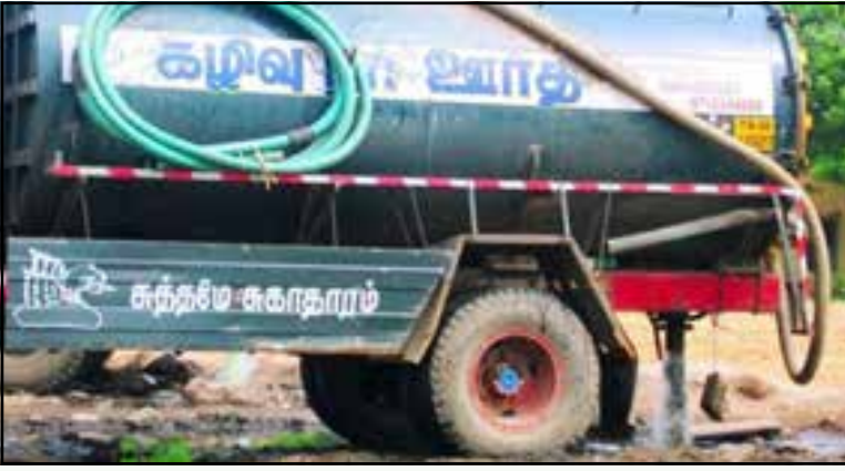
பள்ளிக்கரணை சதுப்பு நிலத்திற்குள் கழிவு நீரைக் கொட்டும் அக்கிரமம்.

தகுதியற்றவை” என்ற வகையினம், ராம்சார் உடன் படிக்கையில் இல்லை. ஏன், நாம் அறிந்தவரையில் எந்த இந்தியச் சட்டங்களிலும் குறிப்பிடப்படவில்லை.