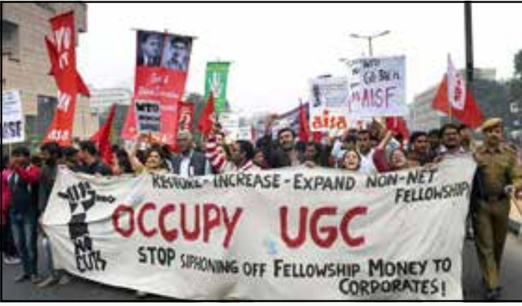
உயர்கல்வியில் தனியார்மயம் புகுத்தப்படுவதை எதிர்த்து, பல்கலைக்கழக மாணியக் குழுவை முற்றுகையிடுவோம் என்ற முழக்கத்தை முன்னவைது டெல்லியில் மாணவர் அமைப்புகள் நடத்திய போராட்டத்தின் ஒரு பகுதியாக நடந்த ஆர்ப்பாட்ட ஊர்வலம்.

களையும் சந்தையே தீர்மானிக்கும். அதாவது, கல்விக்கான கட்டணம் மட்டுமல்ல; பாடத்திட்டம், பயிற்று முறை, பட்டங்கள் வழங்குவது, கல்லூரிகளின் வடிவம் - என அனைத்தையும் சந்தையின் தேவைகளே தீர்மானிக்கும்; சமூகத்தின் தேவைகள் அவற்றை தீர்மானிக்காது” என “அம்பாணி-பிரீலா” அறிக்கை தெளிவாகக் கூறியது. இந்த அறிக்கையானது, இந்தியக் கல்விக் கட்டுமானத்தின் மீதான தாக்குதல் மட்டுமல்ல, அது நமது நாட்டின் அறிவுக் கட்டுமானத்தின் மீதான தாக்குதலாகும்.