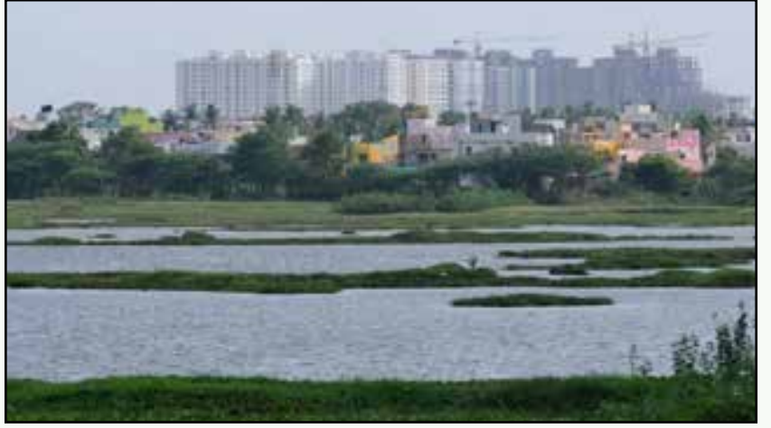
இயற்கைசார் சுற்றுலா (எகோ டூரிஸம்) என்ற பெயரில் ரெட்டேரியைத் தனியார்மயம் விழுங்குவதற்குத் திட்டங்களைத் தயாரித்து வருகிறது, தமிழக அரசு.

“மதுரை மாவட்டத்தின் எந்தப் பகுதியிலும் இயற்கையாய் அமைந்த குளங்களோ குட்டைகளோ எதுவுமே இல்லை. தண்ணீரை ஒருவர் எங்காவது கண்டார் என்றால் அது நிச்சயம் செயற்கையாக தேக்கி வைத்ததுதான். பழனி மலைகள் தொடங்கி கடற்கரை வரை செல்லும் பயணி ஒருவர் எந்தவொரு இயற்கையான நீர்நிலையையும் ஒருபோதும் காணவே முடியாது. (பக். 2, பாகம்-1)”