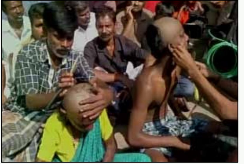
ஜல்லிக்கட்டிற்குத் தடைவிதித்த உச்சநீதி மன்றத்தின் ஆணையை எதிர்த்து மொட்டை போட்டுக் கொள்ளும் தமிழ் மறவர்கள்.

பாரதிய ஜனதாவின் கூற்றை மட்டும் குப்பை என்று தள்ளி விடுவோம். எஞ்சியிருப்பனவற்றில் பல, அரை உண்மைகள். ஆனால் சல்லிக்கட்டுக்கு ஆதரவாக வாதாடுபவர்கள், இந்த தடையின் காரணமாகத்தான் நாட்டு மாடுகள் அழியத் தொடங்கின என்று தொடங்கி, அப்படியே அதை விவசாயத்தின் அழிவு வரை நீட்டித்துச் செல்வது, “சிப்பை ஒளித்த தால்தான் கல்யாணம் நின்றுவிட்டது” என்பதற்குச் சமமான நகைச்சுவை.