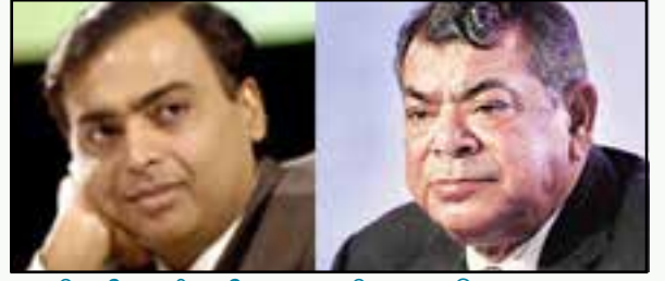
பெட்ரோல் விலையேற்றத்தால் கொள்ளை இலாபமடையும் ரிலையன்ஸ் அதிபர் முகேஷ் அம்பானி மற்றும் எஸ்லார் நிறுவனத் தலைவர் சசி ரூயா.

“ ஒரு லிட்டர் பெட்ரோலின் அடக்கவிலை ரூ.19.95 ஆகக் குறைந்துவிட்டது. ஒரு லிட்டர் டீசலின் அடக்கவிலை அதனைவிடக் குறைவாக (ரூ.15.04) உள்ளது. ஆனால், இந்தியச் சந்தையில் ஒரு லிட்டர் பெட்ரோலும் டீசலும் அவற்றின் அடக்க விலையைவிட மூன்று மடங்கு அதிகமாக விற்கப்படுகின்றன.