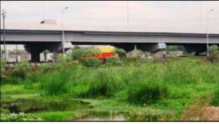
பள்ளிக்கரணை சதுப்பு நிலத்தை ஆக்கிரமித்துக் கட்டப்பட்டுள்ள அதிவிரைவுச் சாலை மேம்பாலம்.

வந்ததே கோபம், நீதிபதிகளுக்கு! கேட்காத கேள்விக்கு எப்படியடா பதில் சொன்னீர்கள்? என்று எரிச்சல் பொங்கி வழிய அந்த அறிக்கையை குப்பைத் தொட்டியில் தூக்கி வீசிவிட்டு பள்ளிக்கூட அகராதியில் இந்த இடத்திற்கான விளக்கத்தைத் தேடினார்கள். அவர்களுக்குக் கிடைத்த புரிதலின்படி, அரசு இந்த இடத்தை குடிசை மாற்று வாரிய வீடுகள் கட்டுவதற்குத் தேர்வு செய்தது சரிதான் என்று தீர்ப்பளித்தனர். அறிக்கை எழுதிய அறிவியலாளர்களையும், அதிகாரியையும் அவமரியாதை செய்யும் அளவுக்கு தமது சொற்களைப் பயன்படுத்தியிருந்தனர். இதோ அவர்கள் “வேதனை” கொப்பளிக்க எழுதிய வார்த்தைகளைப் பாருங்கள்: