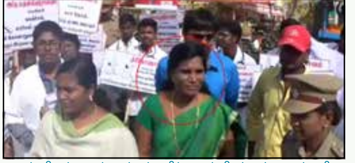
எஸ்.வி.எஸ். மருத்துவக் கல்லூரிக்கு ஆள் பிடிப்பதற்காக கல்லூரி நிர்வாகத்தால் ஏற்பாடு செய்யப்பட்டு நடத்தப்பட்ட ஊர்வலம். (கோப்புப் படம்)