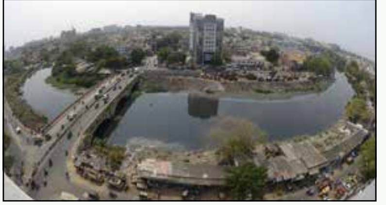
கூவத்தைக் குடிசைகள் மட்டுமா ஆக்கிரமித்திருக்கின்றன?

இடத்திற்கு இடம் ஏன் மாறுபடுகிறது என்று இயற்பியல் விளக்கத்தோடு நிறுத்திக் கொள்ளவில்லை. இந்திய விவசாயத்திற்கு ஏரிகளின் முக்கியத்துவம் என்ன என்று விளக்குவதுடன், ஏரிகளின் அழகையும் வியந்து எழுதியிருக்கிறார். குடியிருப்புகளுக்கு இடையே அமைந்த ஏரிகளின் காட்சி எவ்வளவு அழகாயிருக்கின்றது என்று வியப்புகிறார். ஏரி நீரில் காலைக் கதிரவன் எழும் காட்சியும், மாலைக் கதிரவன் மறையும் காட்சியும் உள்ளத்திற்கு எத்தகைய கிளர்ச்சியைத் தருகின்றன என்று விவரிக்கிறார். “மனித முகத்திற்கு கண்கள் தரும் அழகைப் போன்று, தான் அமைந்திருக்கும் நிலப்பரப்பிற்கு ஏரிகள் அழகைச் சேர்க்கின்றன” என்பது அவர் கருத்து.