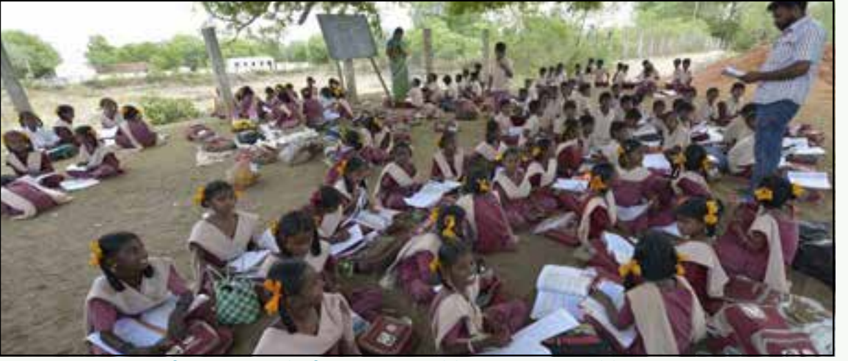
கட்டிடம் இல்லாமல் மரத்தடியில் இயங்கும் அரசுப் பள்ளியின் அவலம்: உலக வங்கியின் கட்டளைப்படி பள்ளிக் கல்விக்கான ஒதுக்கீடுகள் குறைக்கப்பட்டதன் விளைவு. (கோப்புப் படம்)

யாக நடைமுறைப்படுத்தப்படுவதை நான் பார்த்துள்ளேன். அவை ஏதனை நோக்கமாகக் கொண்டு உருவாக்கப்பட்டனவோ, அவை அச்சுப் பிச்சாமல் அப்படியே நிறைவேற்றப்பட்டுள்ளன.