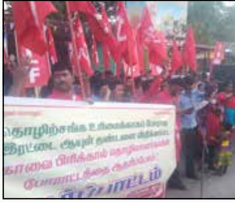
கோவை பிரிக்கால் தொழிலாளர் போராட்டத்தை ஆதரித்து சென்னை-ஆவடியில் பு.ஜ.தொ.மு. நடத்திய ஆர்ப்பாட்டம்.