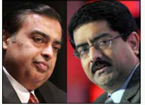
கல்வியில் தனியார்மயத்தை முழுமையாகப் புகுத்துவதற்கு ஏற்ப அரசிற்கு அறிக்கை தயாரித்து அளித்த தரகு முதலாளிகள் முகேஷ் அம்பானி, குமாரமங்கலம் பிரீலா.

பள்ளிக் கல்வியில்தான் இவ்வாறு என்றில்லை; உயர்கல்வியிலும் இதற்குச் சற்றும் குறையாத அளவிற்கு நவீன தாராளவாதக் கொள்கைகள் மூலம் பெரும் சீரழிவுகளை உருவாக்கியுள்ளனர். இதற்கு முந்தைய பா.ஜ.க. ஆட்சிக் காலத்தில் 2000-மாவது ஆண்டில் யுனெஸ்கோ மாநாடு ஒன்றில்