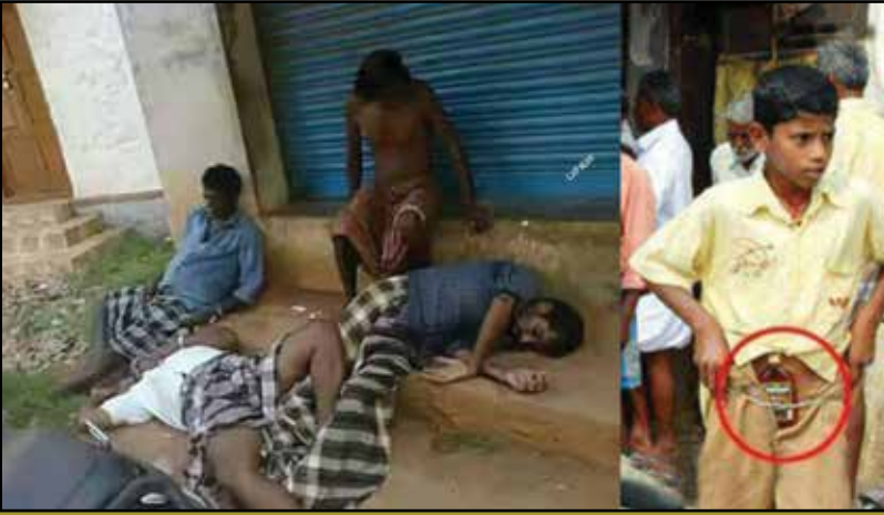
தமிழ்நாட்டைக் குடிநாடாக்கிய அ.தி.மு.க. ஆட்சியின் அலங்கோலங்கள்.

இந்தக் கட்டமைப்பு நியாயப்படுத்த முடியாத அளவுக்கு சீர்கெட்டு விட்டது என்ற போதிலும், வேறு மாற்று குறித்த சிந்தனையே எழுத வண்ணம், ஆளும் வர்க்கங்களும் ஊடகங்களும் மக்களை இந்த தேர்தல் அரசியல் வரம்புக்கு உள்ளேயே சிந்திக்கும்படி கட்டுப்படுத்துகின்றன.