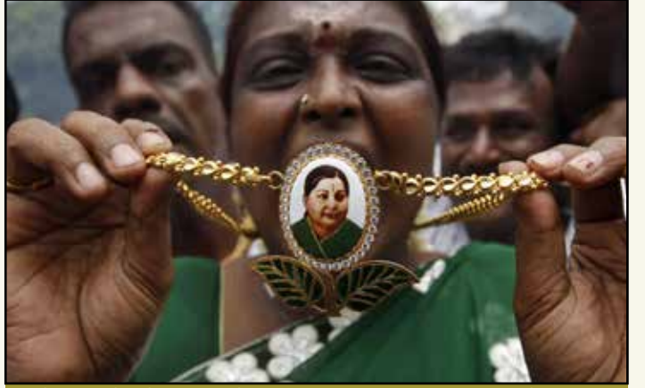
பொறுக்கித் திண்ணும் பிழைப்புவாதக் கூட்டத்தையும் அரசியலற்ற உதிரிப் பாட்டாளிகளையும் அடித்தளமாகக் கொண்டதுதான் அ.தி.மு.க.

தி.மு.க. ஒருவேளை வெற்றி பெற்றிருந்தால், அது இந்த அரசியல் சமூகக் கட்டமைவின் தோல்வியை எந்த விதத்திலும் மாற்றப் போவதில்லை. ஆனால், ஜெயலலிதா பெற்றிருக்கும் வெற்றி, தமிழ்ச்சமூகம் உள்ளார்க்குள் அழகத் தொடங்கி விட்டதை அறிவிக்கின்றது.