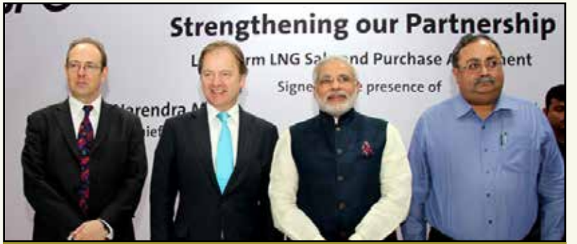
குஜராத் அரசு பெட்ரோலியக் கழகத்திற்கும் பிரிட்டிஷ் கேள் நிறுவனத்திற்கும் இடையே இயற்கை எரிவாயு வணிகம் தொடர்பாக நடந்த பேச்சு வார்த்தையில் கலந்துகொண்ட அன்றைய குஜராத் முதல்வர் நரேந்திர மோடி உள்ளிட்டோர்: நரேந்திர மோடி அரசின் வெட்டி பந்தா. (கோப்பு படம்)

ஆனால், இதுவரை உற்பத்தி தொடங்கவில்லை. மாறாக, மூலதனச் செலவிற்காகப் பொதுத் துறை வங்கிகளிடமிருந்து வாங்கப்பட்ட கடன் மட்டும் அதிகரித்துக் கொண்டே சென்றிருக்கிறது. 2011-இல் உற்பத்தி தொடங்கிவிடும் எனக் காட்டி 2008-இல் 2,386 கோடி ரூபாய் கடன் பெறப்பட்டிருக்கிறது. 2012-இல் உற்பத்தி