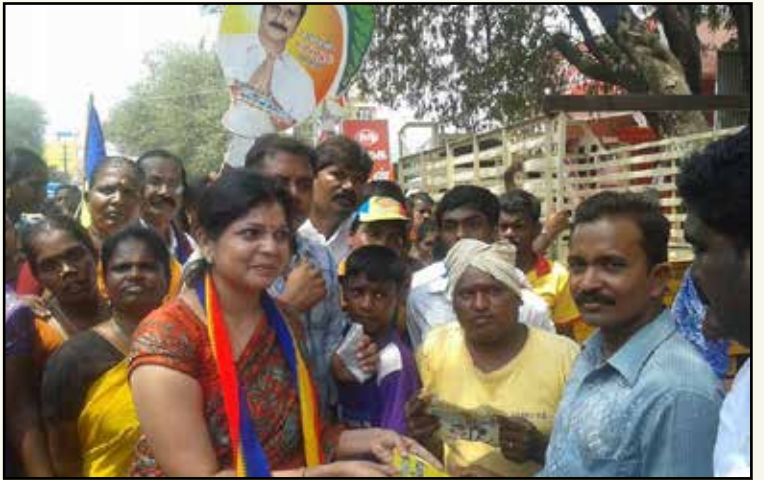
அன்புமணியின் மனைவியும் மக்களும் அவருக்காக வன்னிய சாதி உழைக்கும் மக்களிடத்தில் பிரச்சார வேட்டை நடத்தியதைப் பற்றிக் கேட்பொழுது, “அவுங்க கலரைப் பாரு, நம்ம கலரைப் பாரு, ரெண்டு பேரும் ஒரு சாதியாப்பா?” என்று கேலி செய்து சிரித்தனர்.

“உங்க ஏரியாவுல எவ்வளவு காச கொடுத்தாங்க?”