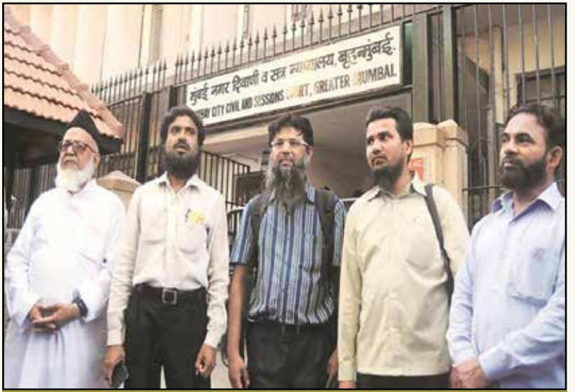
மலேகான் குண்டுவெடிப்பு வழக்கில் கைதாகி, கடந்த ஏப்ரலில் மும்பை கீழமை நீதிமன்றத்தால் விடுதலை செய்யப்பட்ட அப்பாவி முஸ்லிம்கள்.