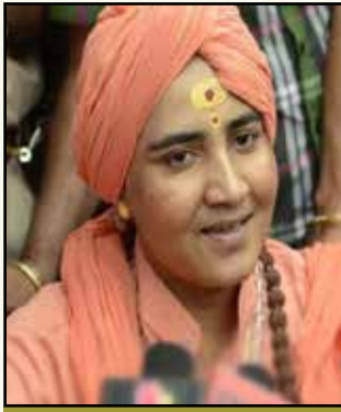
தேசிய புலனாய்வுக் கழகத்தால் குற்றமற்றவராக அறிவிக்கப்பட்டுள்ள இந்துவெறி பயங்கரவாத பெண் சாமியார் பிரக்யா சிங்.

மலேகான் குண்டு வெடிப்பு விசாரணையை முடித்த தேசிய புலனாய்வுக் கழகம், மும்பை சிறப்பு நீதிமன்றத்தில் கடந்த மே 13 அன்று குற்றப் பத்திரிகையைத் தாக்கல் செய்தது. இந்த அறிக்கையில், மகாராஷ்டிரா தீவிரவாத எதிர்ப்புப் போலீசார் இந்த வழக்கு விசாரணையில்