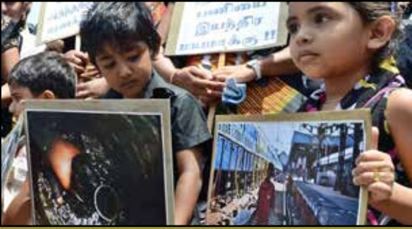
கையால் மலம் அள்ளும் இழிவு தாழ்த்தப்பட்டோர் மீது சுமத்தப்படுவதை முற்றிலுமாகத் தடை செய்யக் கோரி கோயம்புத்தூரில் நடைபெற்ற ஆர்ப்பாட்டம். (கோப்புப் படம்)

அனைத்து மாநில அரசுகளும், “எங்கள் மாநிலத்தில் மனிதக் கழிவை மனிதனே அகற்றும் பிரச்சினை இல்லவே இல்லை” என்றே சாதிக்கின்றன. ஆனால், நாடெங்கும் 7,94,000 பேர் மனிதக் கழிவு அகற்றும் பணியில் ஈடுபட்டிருப்பதாக 2011 மக்கள் தொகை கணக்கெடுப்பு கூறுகிறது.