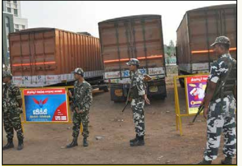
திருப்பூர் மாவட்ட ஆட்சியர் அலுவலக வளாகத்தில் நிறுத்தி வைக்கப்பட்ட மரம் கண்டெய்னர்கள்: ஜெயா-சசி கும்பல் கொள்ளையடித்துப் பதுக்கி வைத்த பணத்தைப் பாதுகாக்கும் போலீசு.