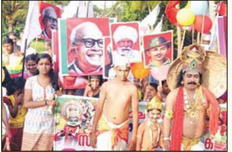
ஓணம் பண்டிகையையொட்டி குழந்தைக்கு மாவலி மன்னன் வேடமிட்டு பக்தசிங் படத்துடன் சி.பி.எம். கட்சியினர் நடத்தும் ஊர்வலம்.

மாதொரு பாகன் விவகாரத்தில் கொங்கு வேளாளக் கவுண்டர் சாதிவெறி ஆதிக்கத்தை எதிர்க்க முன்வராமல், இது எழுத்தாளரின் கருத்துரிமையைப் பறிக்கும் செயல் என்று நழுவிக்கொண்டதைப்போலத்தான், இந்து மதத்தின் மையமான பார்ப்பனியத்தை எதிர்க்காமல் கேரள போலி கம்யூனிஸ்டுகள் பக்கவாட்டில் ஓதுங்கிக் கொள்கிறார்கள். “பால கோசுலம்” என்ற அமைப்பின் பெயரால் குழந்தைகளுக்குக் கிருஷ்ணன், ராதை வேடமிட்டு இந்துவெறியர்கள் கிருஷ்ண ஜெயந்தி விழா ஊர்வலம் நடத்துகிறார்கள் என்றால், அதற்குப் போட்டியாக “பால சங்கம்” என்ற அமைப்பின் பெயரால் அதேபோல கிருஷ்ண ஜெயந்தி விழா ஊர்வலத்தை போலி கம்யூனிஸ்டுகள் நடத்துகிறார்கள். ஓணம் பண்டிகையின் போது குழந்தைகளுக்கு மாவலி மன்னன் வேடமிட்டு கார்ல் மார்க்ஸ், பக்தசிங் படங்களுடன் சி.பி.எம். கட்சி ஊர்வலம் நடத்திக் கொண்டிருக்கிறது. சபரிமலையின் மகரஜோதி அதிசயம் என்பது கேரள மின்வாரியம், போலீசு மற்றும் திருவாங்கூர் தேவஸ்தான போர்டு ஆகியன இணைந்து நடத்தும் நாடகம் என்பது ஏற்கெனவே அம்பலமாகியுள்ள போதிலும், இந்த மூட நம்பிக்கைக்கும் மோசடிக்கும் எதிராக வாய் திறக்காமல், அரசு அதிகாரத்தில் இருந்த சமயத்திலும்கூட இதனை அங்கீகரித்து போலி கம்யூனிஸ்டுகள் சந்தர்ப்பவாதமாகவே நடந்து கொள்கின்றனர். தேர்தல் வெற்றிக்காக சாதி-மதவாத பிற்போக்கு சக்திகளுடன் சந்தர்ப்பவாதமாகக் கூட்டணி சேர்வது, இந்து மனப்பான்மைக்கு ஏற்ப நெளிவுசுழிவாக நடந்து