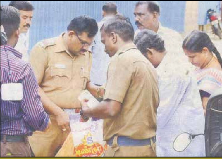
காரைக்குடி அ.தி.மு.க. தலைமை அலுவலக வாசலில் நிறுத்தி வைக்கப்பட்டிருந்த வாசல்களில் பதுக்கி வைக்கப்பட்டிருந்த பணத்தைப் பறிமுதல் செய்யும் போலீசு.