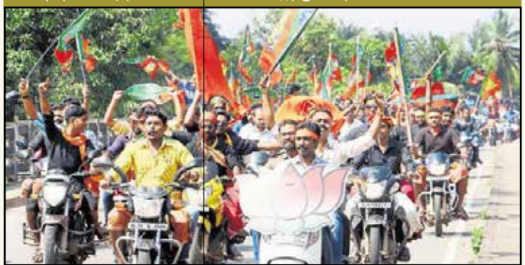
தேர்தல் வெற்றியைக் கொண்டாடும் இந்து வெறியர்களின் ஊர்வலம்.

இடதுசாரி சக்திகள் செல்வாக்கு பெற்றுள்ளதைப் போலவே கேரளத்