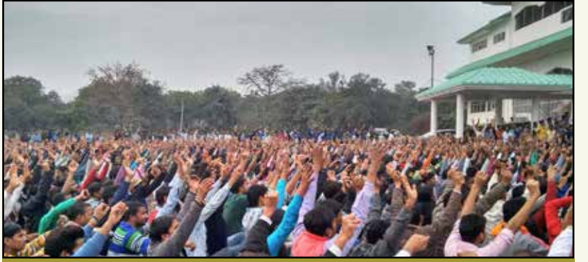
ஹோண்டா தொழிலாளர்கள் மீது நடத்தப்பட்ட தாக்குதலைக் கண்டித்து குர்கான், மாணே சர், தாபுகாரா சிறப்புப் பொருளாதார மண்டலங்களைச் சேர்ந்த தொழிலாளர்கள் குர்கானில் உள்ள தேவிலால் விளையாட்டு அரங்க மைதானத்தில் நடத்திய கண்டன ஆர்ப்பாட்டம்.

இத்திருத்தங்கள் தொழிலாளர்கள் மத்தியில் பீதியை உருவாக்கி விடும் என பா.ஜ.க.வின் வசுந்தரா ராஜே அரசும், பன்னாட்டு நிறுவனங்களும் கனவு கண்டன. அந்த எண்ணத்தில் சம்மட்டி அடியாக இறங்கியது, ஹோண்டா தொழிலாளர்களின் ஐக்கியமும் போராட்டமும். தொழிலாளர் நலச் சட்டங்கள் திருத்தப்பட்டவுடனேயே, ஆகஸ்டு 2015-இல் ஹோண்டா தொழிற்