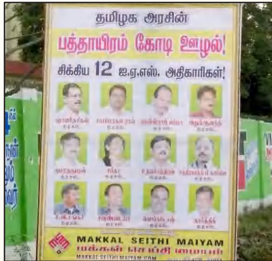
ஜெயா முதல்வராக இருந்த சமயத்திலும் ஊழல் கொடிகட்டிப் பறந்ததை அம்பலப்படுத்தி மக்கள் செய்தி மையம் என்ற அமைப்பால் வைக்கப்பட்ட பிரச்சாரத் தட்டி.