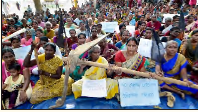
ஹைட்ரோ கார்பன் திட்டத்துக்கு எதிராக நெடுவாசல் பகுதி மக்களின் போராட்டம்: மனிதமுகம் கொண்ட உலகமயம் என்பதெல்லாம் மோசடி என்ற தெளிவு மக்களிடம் ஏற்பட்டுவருவதன் சான்று.

மனித முகம் கொண்ட பார்ப்பனியமும் இல்லை, மனித முகம் கொண்ட உலகமயமும் இல்லை என்கின்ற தெளிவு பரவி வருவதைத்தான் “நெகிழ்வுத் தன்மைக்கு எதிரான போக்கு” வளர்ந்து வருவதாகவும்