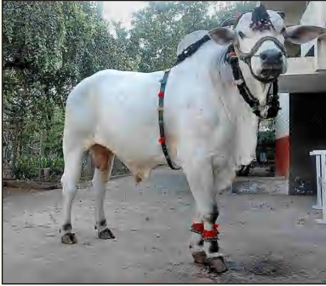
பிரேசிலில் போற்றிக் கொண்டாடப்படும் ஓங்கோல் மாட்டினம், இந்தியாவில் “அழிந்து வரும் இனமாக” அறிவிக்கப்பட்டிருக்கிறது.

பார்ப்பன மத நம்பிக்கையான “பசுவதைத் தடை”யை, “கால்நடை செல்வத்தைப் பேணுதல்” என்ற மதச்சார்பற்ற மொழியில் திணித்திருக்கின்ற இந்தக் கயமையை அரசியல் நிர்ணய சபை விவாதத்தி