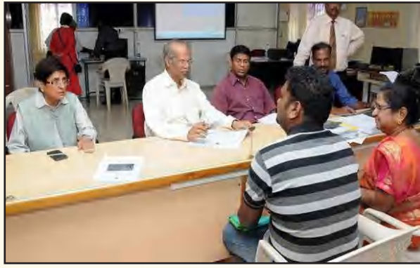
பாண்டிச்சேரியில் முதுகலை மருத்துவ கவுன்சிலிங்கை நடத்திய அரசு நிறுவனம் சென்டாக், தனியார் மருத்துவக் கல்லூரிகளோடு கைகோர்த்துக்கொண்டு முறைகேடுகளில் ஈடுபட்டதாக எழுந்த குற்றச்சாட்டையடுத்து, அக்கவுன்சிலிங்கை ஆய்வு செய்யும் அம்மாநில துணைநிலை ஆளுநர் கிரண் பேடி.

நீட் தேர்விற்கு ஆதரவாக வாதிடும் அறிவு ஜீவிகளோ, பா.ஜ.க.வினரோ பொதுமக்களின் இந்த அடிப்படையான பிரச்சினை குறித்துப் பேசுவதில்லை. மாறாக, தரம், தரம் என மழைக் கால தவளையைப் போல நாராசமாக வாதிடுகிறார்கள். “இந்தியாவின்