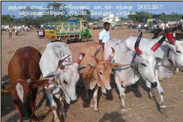
தஞ்சை மாவட்டம், திருவோணம் மாட்டுச் சந்தை: 28.05.2017. விற்பனையாகாமல் திரும்பி செல்லும் மாடுகள்.

தஞ்சை மாவட்டம் திருவோணம் சந்தையில் விற்பனையாகாமல் திரும்ப அழைத்துச் செல்லப்படும் மாடுகள்.