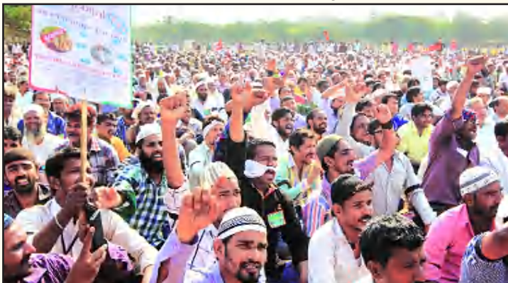
மகாராஷ்டிராவில் மாட்டிறைச்சிக்குத் தடைக்கு எதிராகக் கால்நடை மற்றும் இறைச்சி விவியாபாரிகள் நடத்திய பிரம்மாண்டமான ஆர்ப்பாட்டம். (கோப்புப் படம்)

மாடு இல்லாத காரணத்தினால் விவசாயம் பாதிக்கப்படுவதாகக் கூறுவது அண்டப்புளுகு விவசாயம் சார்ந்த பணிகளில் மாடுகளைப் பயன்படுத்துவது மிகவும் அரிதாகிவிட்டது என்பதே உண்மை. மாட்டின் பராமரிப்புச் செலவு அதிகமாகி