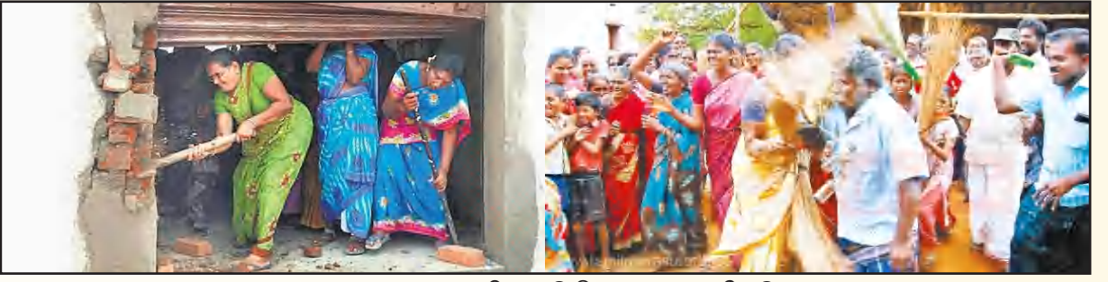
டாஸ்மாக்க கலையைக் கடப்பாரையைக் கொண்டு இடித்துத்தள்ளுவதோடு, குடிமகன்களுக்கு வெளக்குமாறு பூசை கொடுக்கும் அளவிற்குத் தமிழகப் பெண்களிடம் 'சகிப்பின்மை' வளர்ந்துவருகிறது.

இந்தக் குற்றச்சாட்டின் அருகதையைப் பரிசீலிப்போம்.