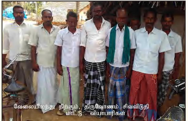
வேலையிலுந்து நிற்கும், திருவோணம் சிவவிடுதி மாட்டு வியாபாரிகள்

வேலையிலுந்துபோன திருவோணம் - சிவவிடுதி மாட்டு வியாபாரிகள்.