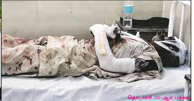
தொடர்ச்சி 35-ஆம் பக்கம்