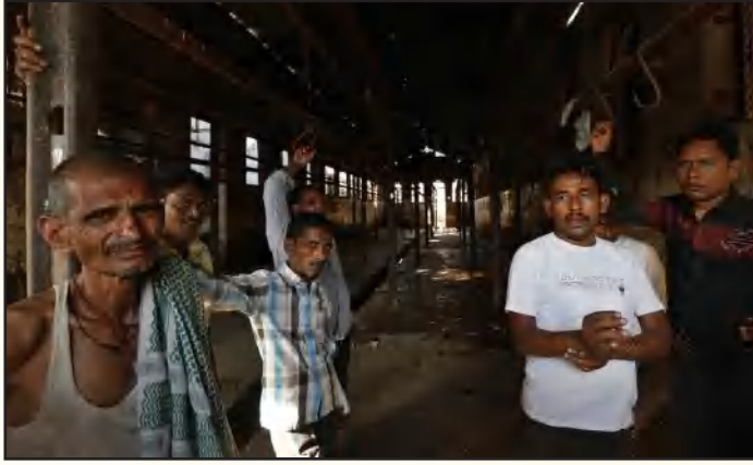
மாட்டிறைச்சிக்கு விதிக்கப்பட்ட கட்டுப்பாடுகளால் வேலையிழந்து நிற்கும் உ.பி. மாநில இறைச்சிக்கூடத் தொழிலாளர்கள்.

ளிட்ட அனைவரையும் ஒழித்துக்கட்டுவதற்கு FSSAI (Food Safety and Standards Authority of India - உணவுப் பாதுகாப்பு மற்றும் தரநீர்ணய ஆணையம்) என்ற மைய அதிகாரத்தின் மூலம் ஏற்கெனவே முயற்சிகள் மேற்கொள்ளப்பட்டு வருகின்றன. இதில் இறைச்சிக் கூடங்கள், இறைச்சிக்கடைகளும் அடக்கம்.